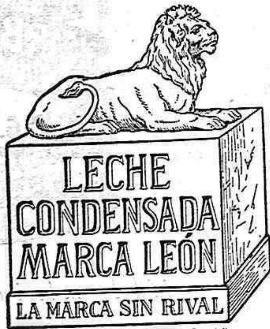
Natura-Milch-Exportgesellschaft, Bosch & Co. m. b. H. Waren in Mecklenburg.

Precios convencionales, según la mayor ó menor humedad que contengan los muros.