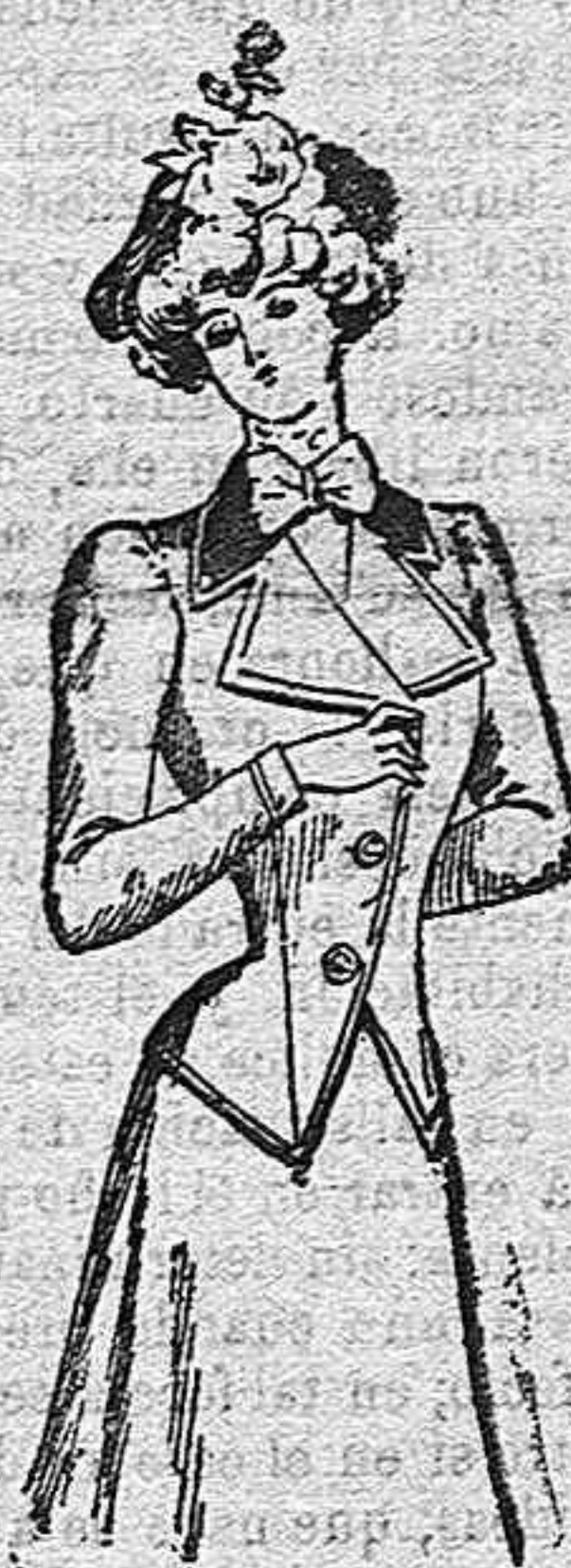
Chaqueta de entretiempo.

Corte elegantísimo y sencillo que nos ahorra su descripción. Paño beige, crema ó castaña. Tres botones. Cuello de terciopelo.