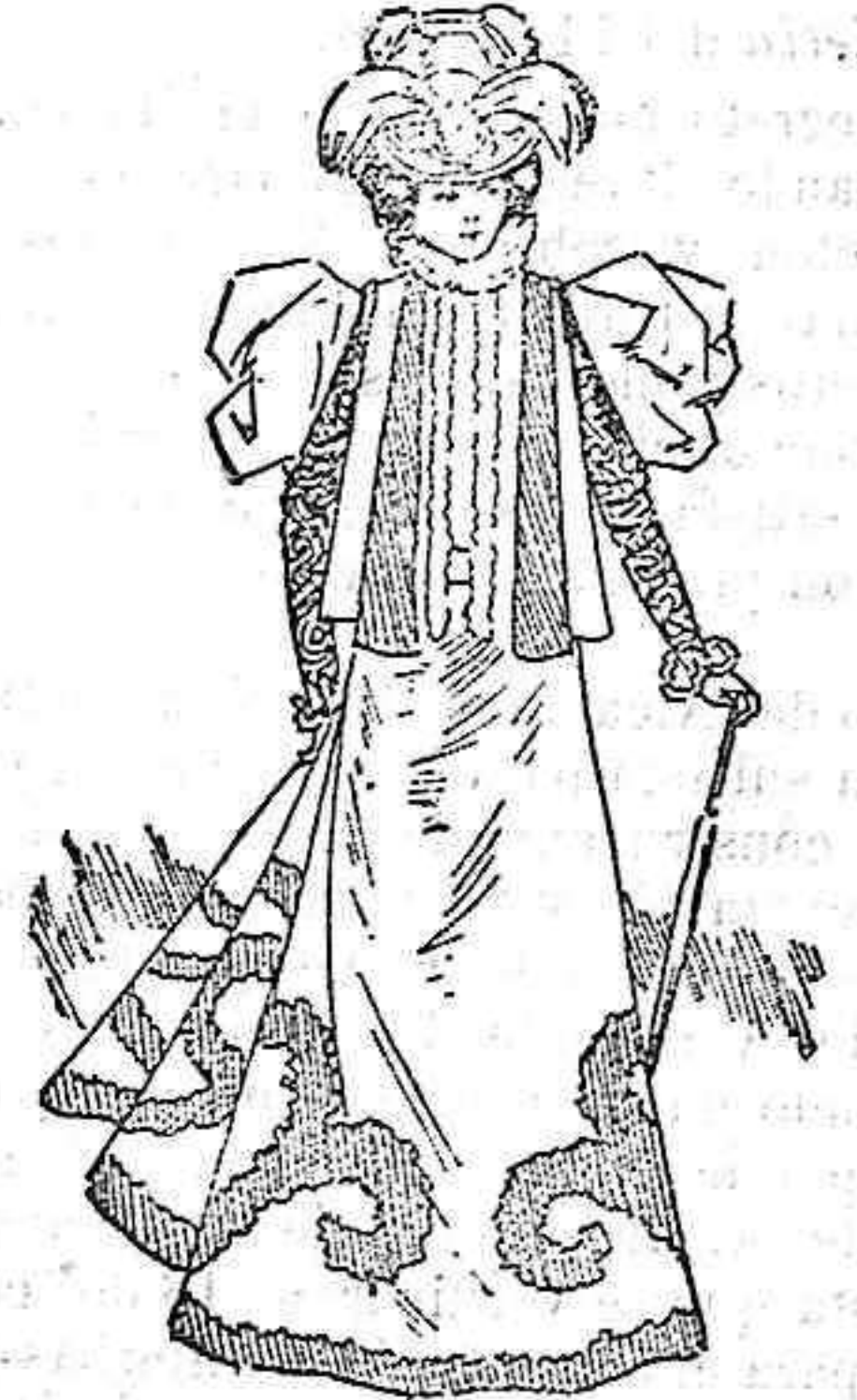
Traje para paseo.

Modelo exclusivo para nues ras lectoras, de los grandes almacenes de EL SIGLO, Barcelona (1).