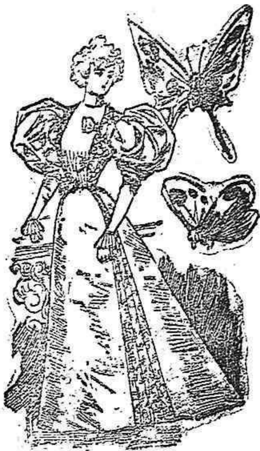
Traje de recepción.

Modelos exclusivos para nuestras lectoras de los grandes almacenes de EL SIGLO, Barcelona (1).