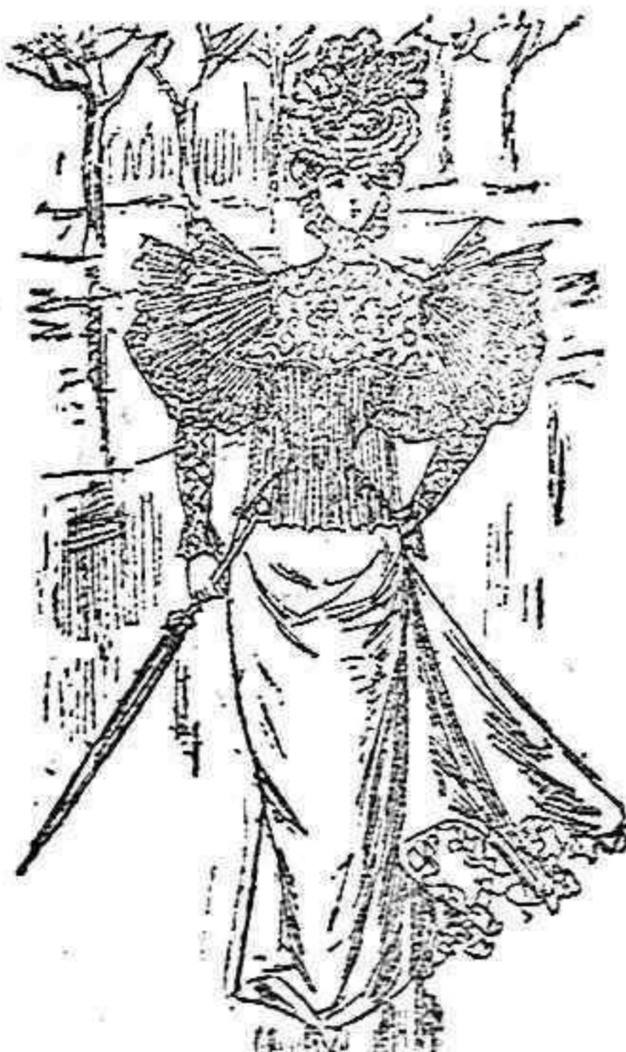
Traje para paseo.

De seda gró de Londres, verde; cuerpo entallado, con aldetas muy acampanadas y un volante del mismo género, alrededor de dichas aldetas; delantero abierto con un volante de gasa, color paja; plegado acordeón; dos bonitos botones en la cintura; cuello alto de gasa con dos chús; mangas de una pieza con el bollo pequeño, forma novedad y un volante de gasa en la bocamanga; falda forma campana, abierta en el delantero y lados sobre quillas de seda pompadour y bordadas las del delantero.