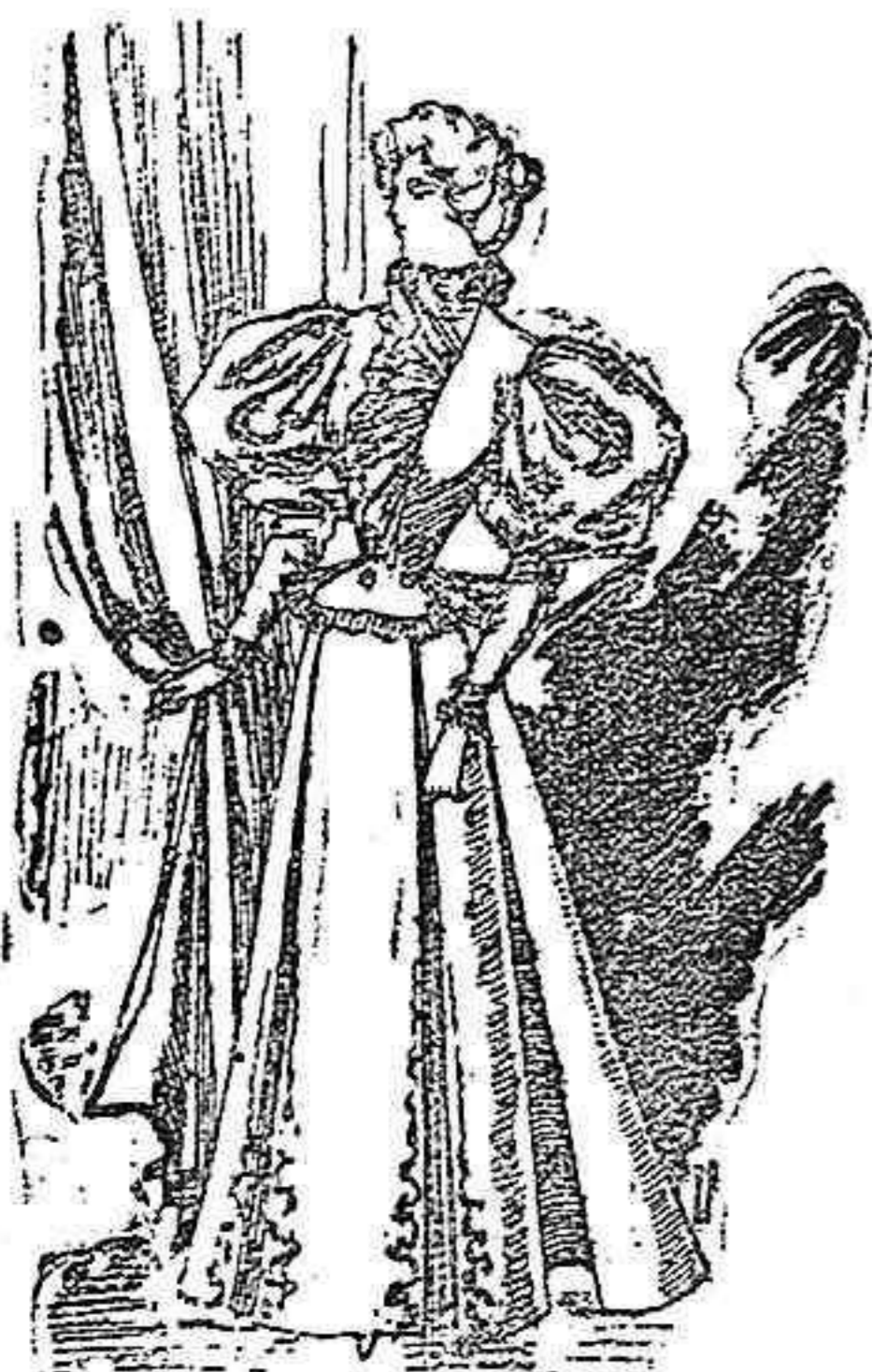
Traje para visita.

De gró de Londres; cuerpo entallado; delantero liso, con una torera de raso negro cubierta de encaje blanco bordado sobre tul; dos bonitos lazos van prendidos en el delantero de la torera y son de cinta; cuello alto de gró de Londres; mangas de una pieza con un pequeño bollo, forma última novedad; en la bocamanga lleva un volante de encaje blanco, un bouquet de flores en la cintura; falda forma campana, abierta en los lados sobre una quilla de raso negro cubierta de encaje blanco, bordado sobre tul negro.