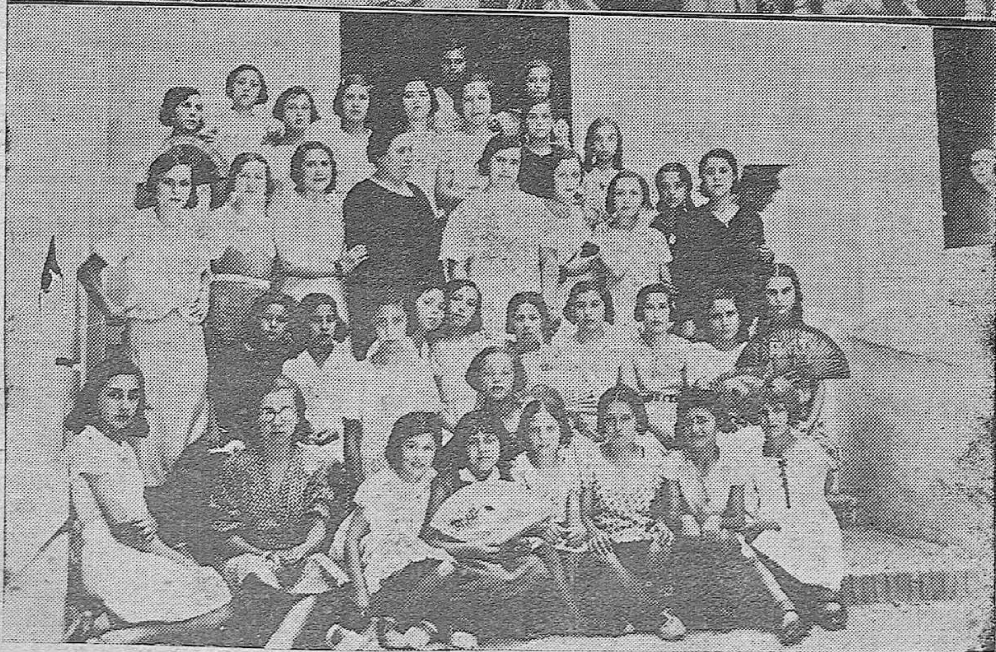
Arriba: Los 40 niños que forman la colonia escolar marítima enviada por el Ayuntamiento a Torremolino (Málaga), donde pasarán una temporada.—Abajo: Señoritas que confeccionan el ropero escolar municipal de nuestra ciudad.