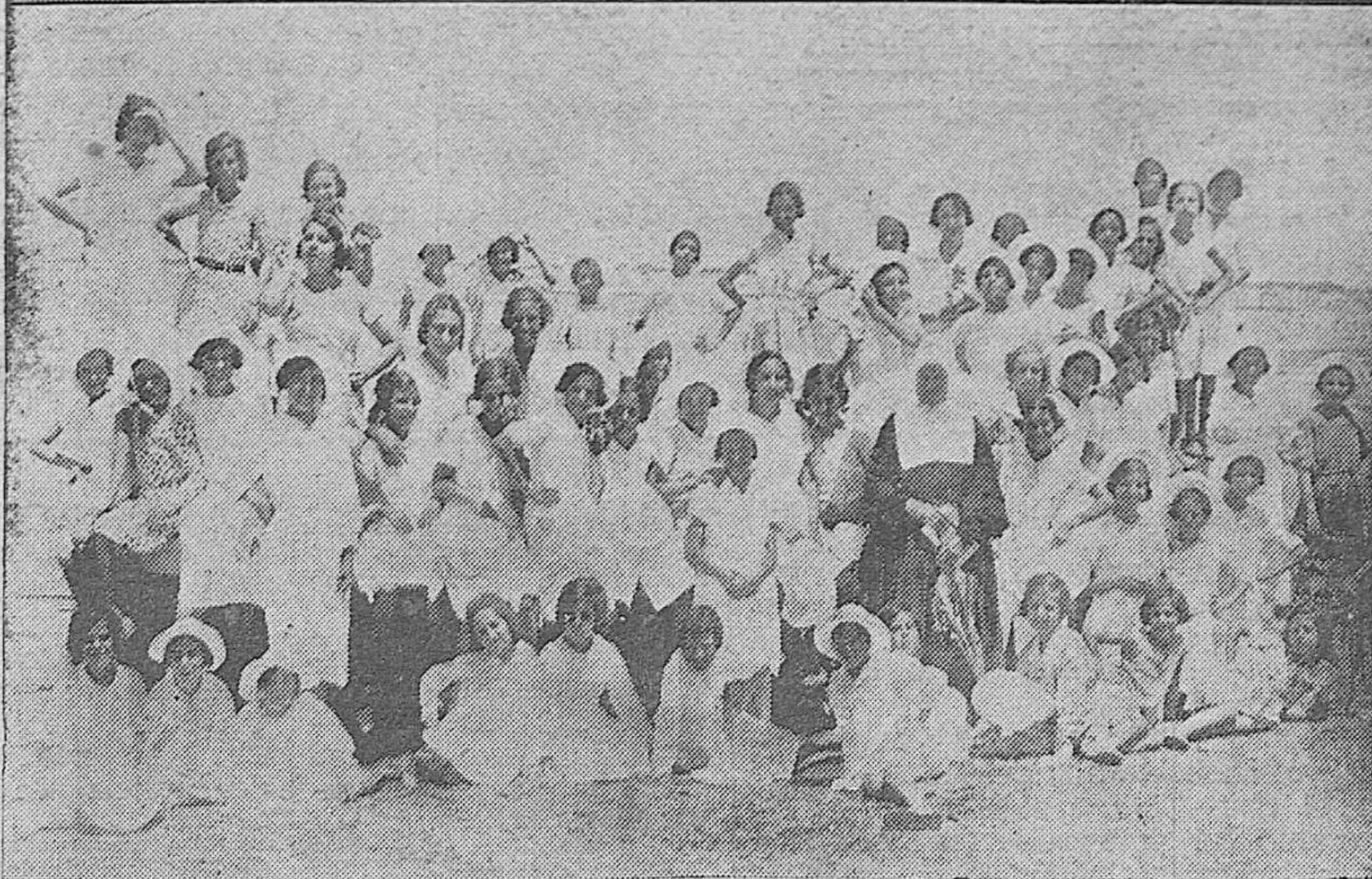
Algunos detalles de la inauguración de la temporada de baños de Sanlúcar de Barrameda.—Llegada a la mencionada playa de la colonia escolar sevillana.