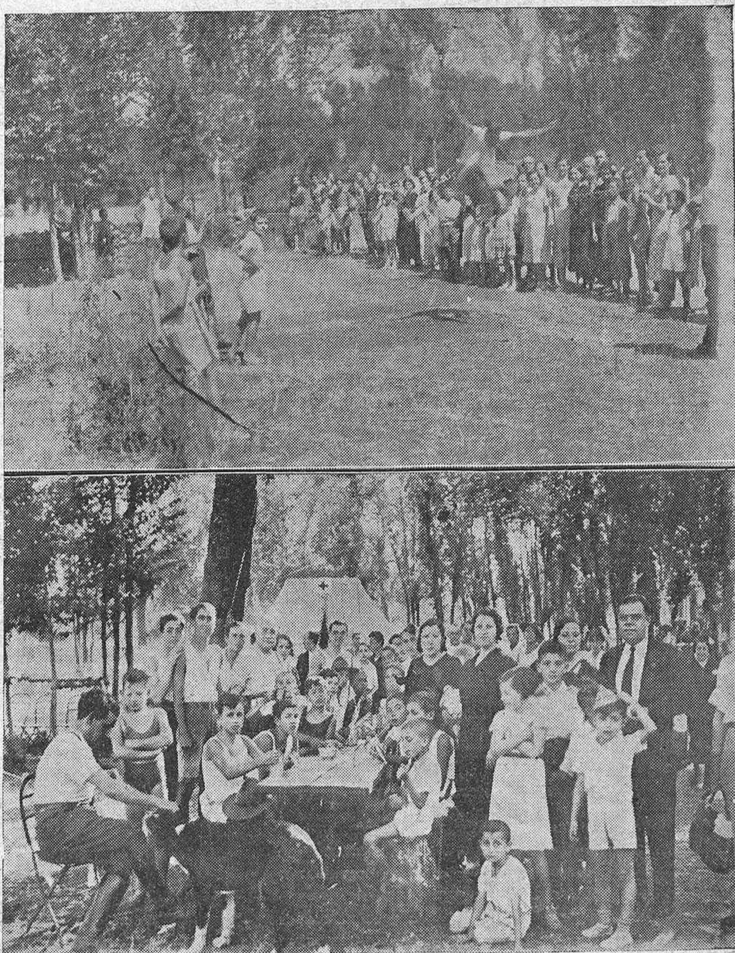
El campamento de los exploradores cordobeses en la sierra.—Arriba: El ejercicio de salto que practican a diario.—Abajo: El grupo de Lobatos durante la comida.