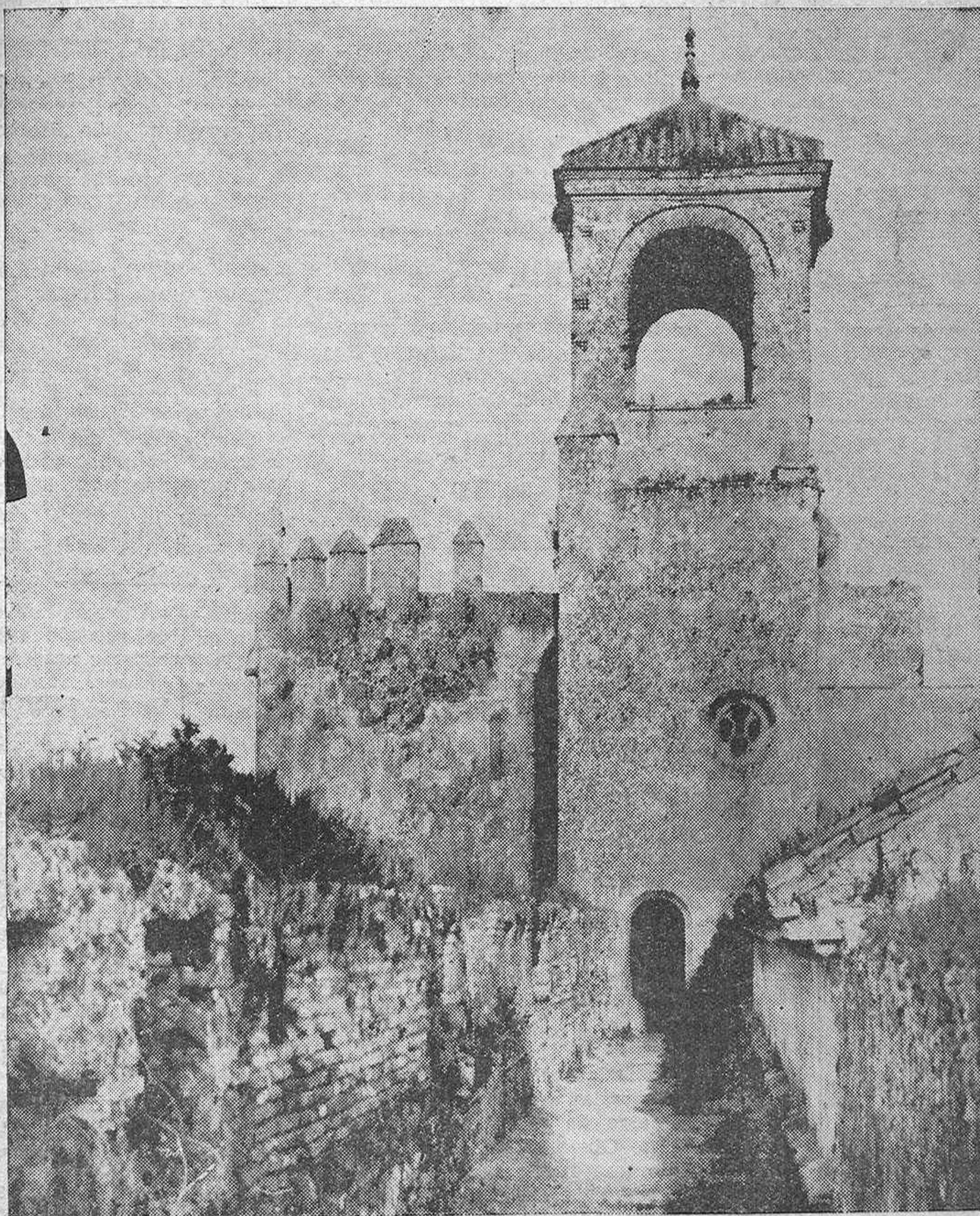
NOTAS GRAFICAS.—Córdoba Artística y Monumental: Vista del torreón del Alcázar Viejo y rastrillo de la Cárcel Provincial