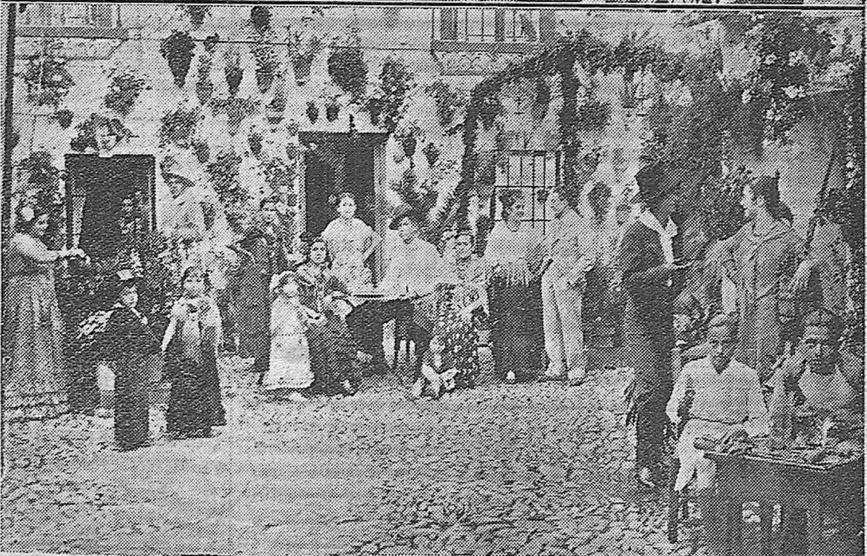
El concurso de Patios organizado por el Ayuntamiento.—Dos bonitos patios presentados al concurso, uno en la calle Conde Arenales y el otro en la calle Tafures.