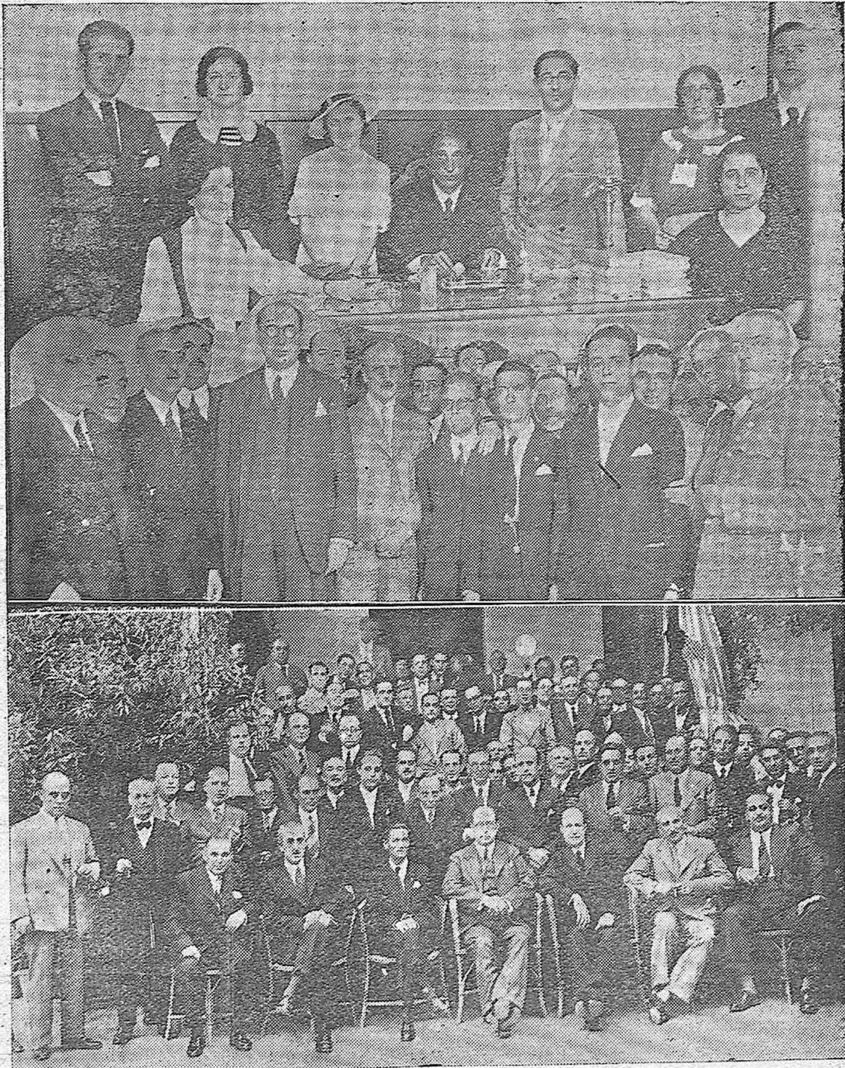
Se inaugura el Grupo Escolar Ferroviario de la Zona 21.—El cuadro de profesores del nuevo Grupo escolar.— El director general de Ferrocarriles, autoridades y altos empleados de la Compañía durante el acto de la inau- guración.—Asistentes al banquete celebrado en el Hotel Regina con dicho motivo