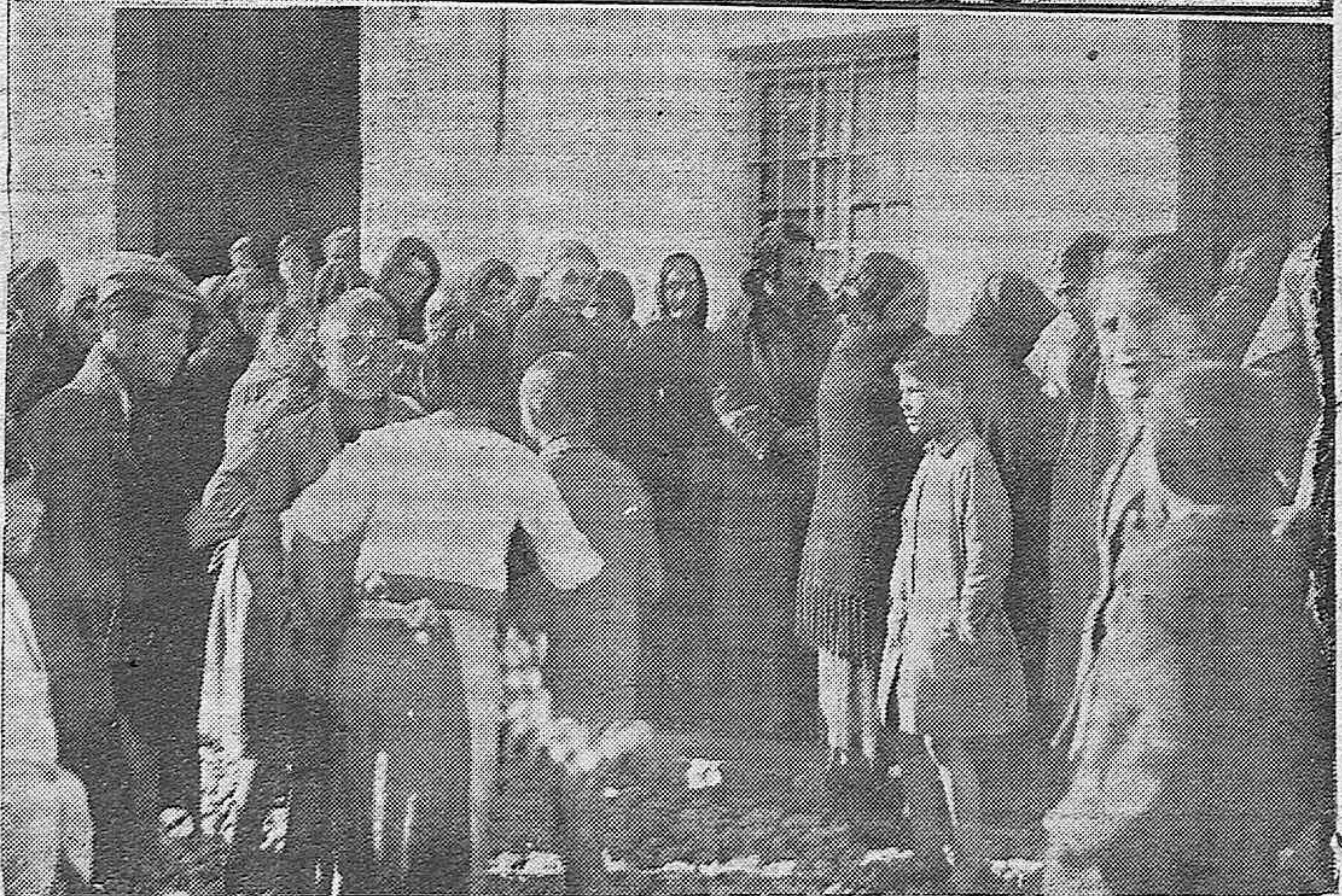
NOTAS GRAFICAS.—Dos aspectos de las "colas" ante los colegios electorales en el día de ayer