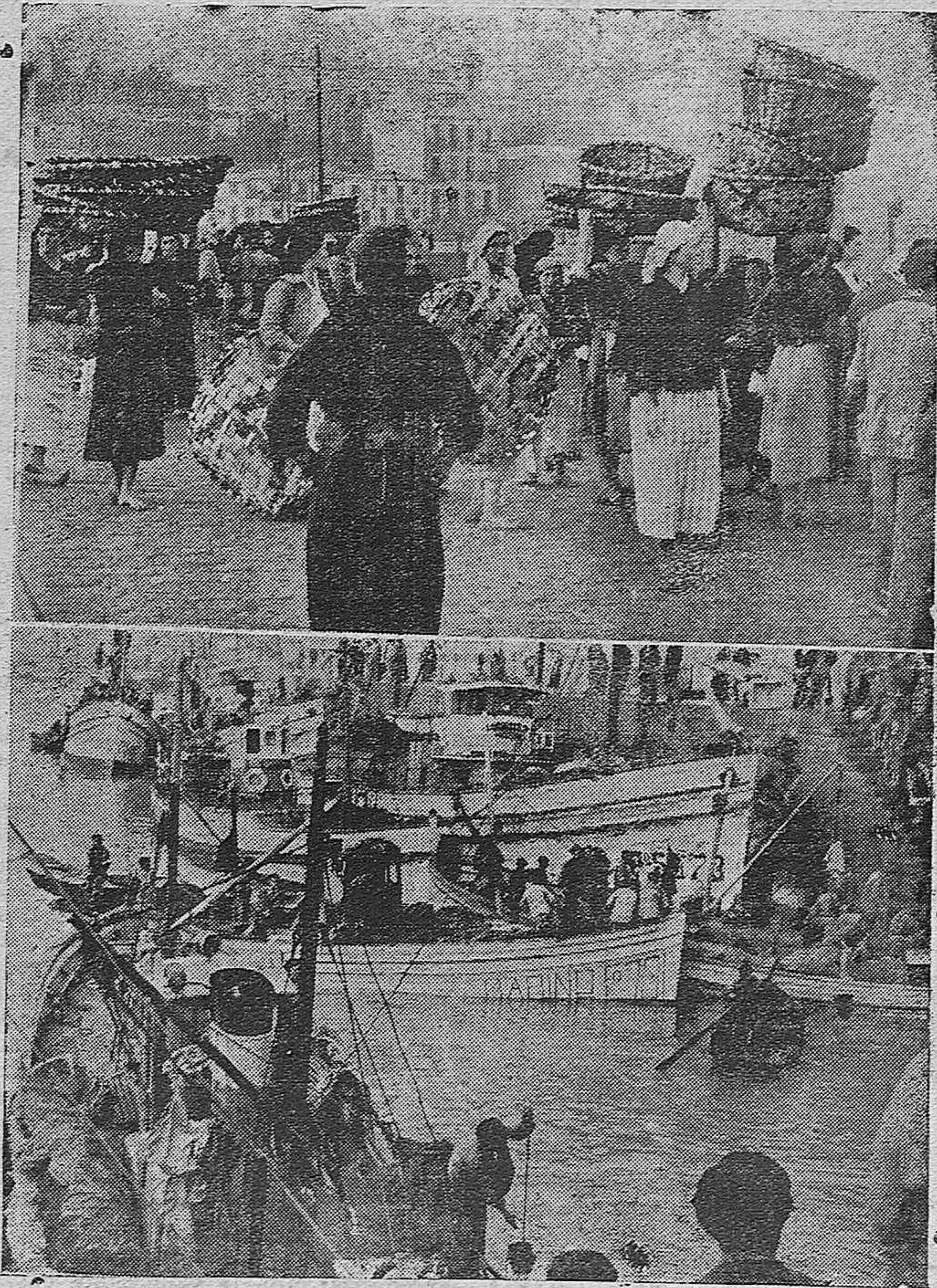
RETAGUARDIA FECUNDA.-Vigo.-Esperando el desembarque del pescado.-Embarcaciones pesqueras llegando al muelle de Barbés