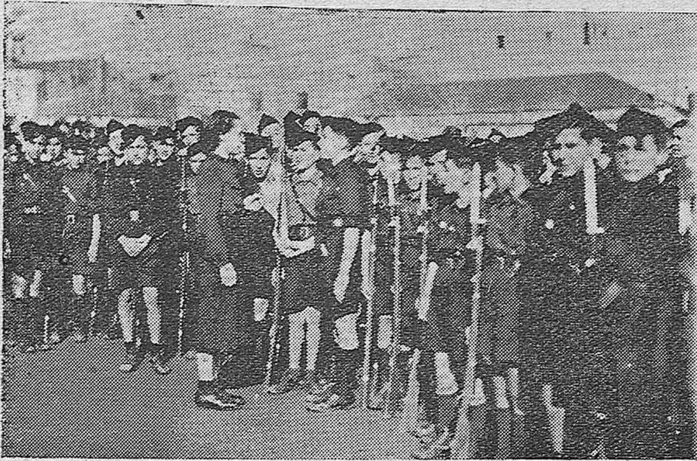
Momento de entrega de un banderín a la primera centuria de Flechas de Pueblonuevo del Terrible con motivo de la celebración del "Día de la Falange"