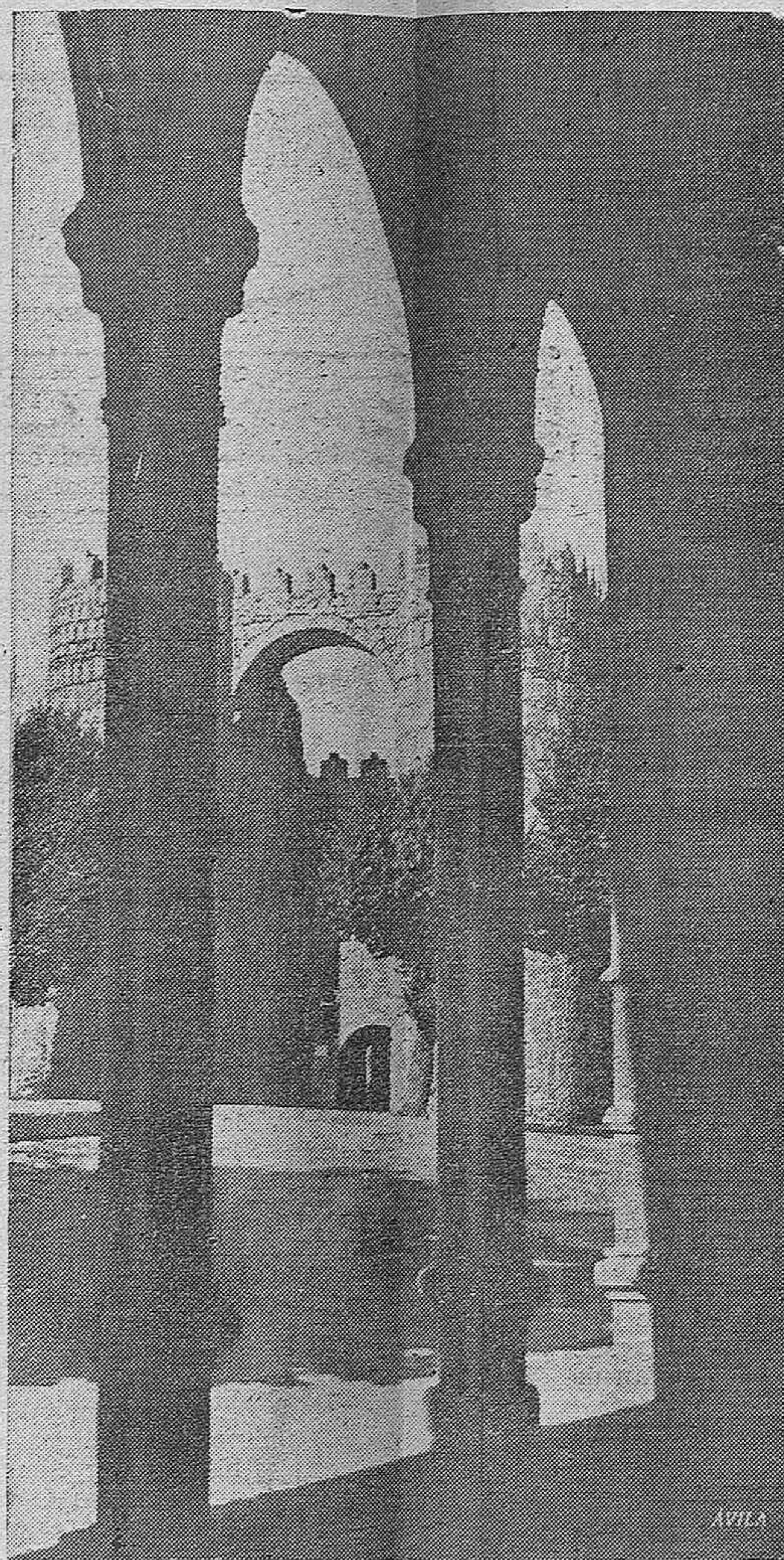
AVILA.-Las famosas murallas de la ciudad de Castilla, vistas desde un claustro