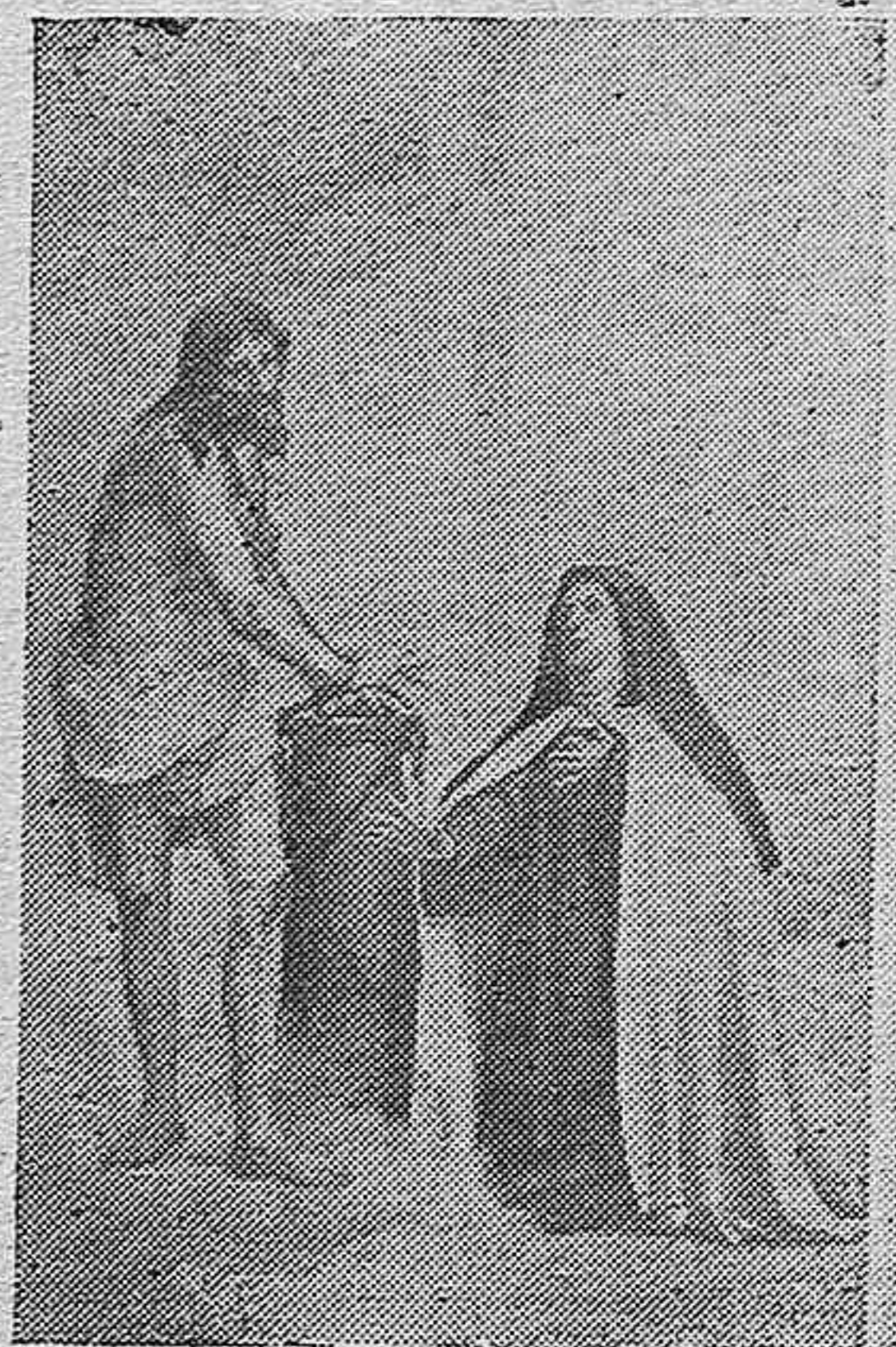
Apurición de Nuestro Señor, atado a la Columna, a Santa Teresa de Jesús