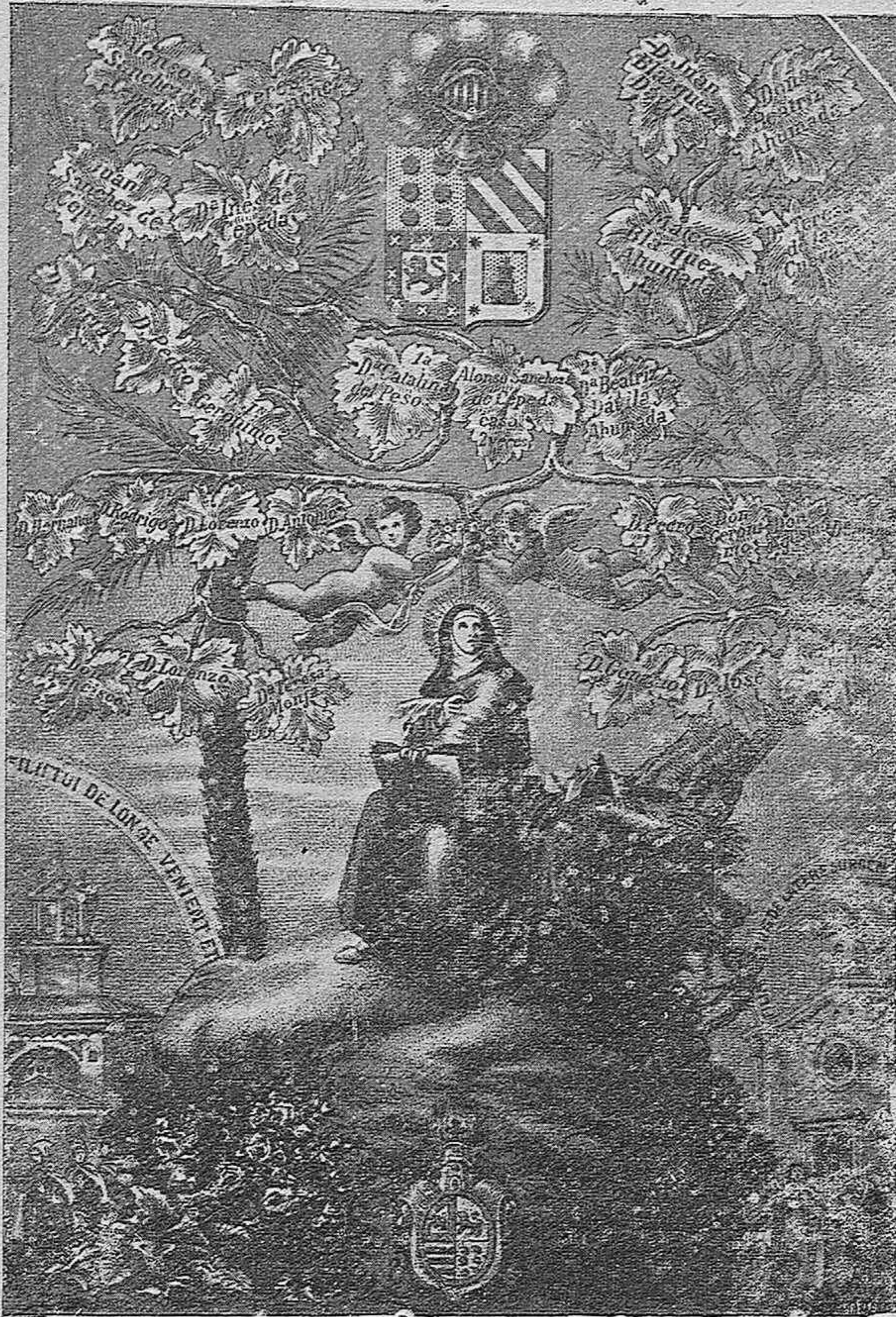
Arbol genealógico de las ilustres familias de Cepeda y Ahumada, antepasado de la Santa de Avila, Teresa de Jesús (De un grabado antiguo)