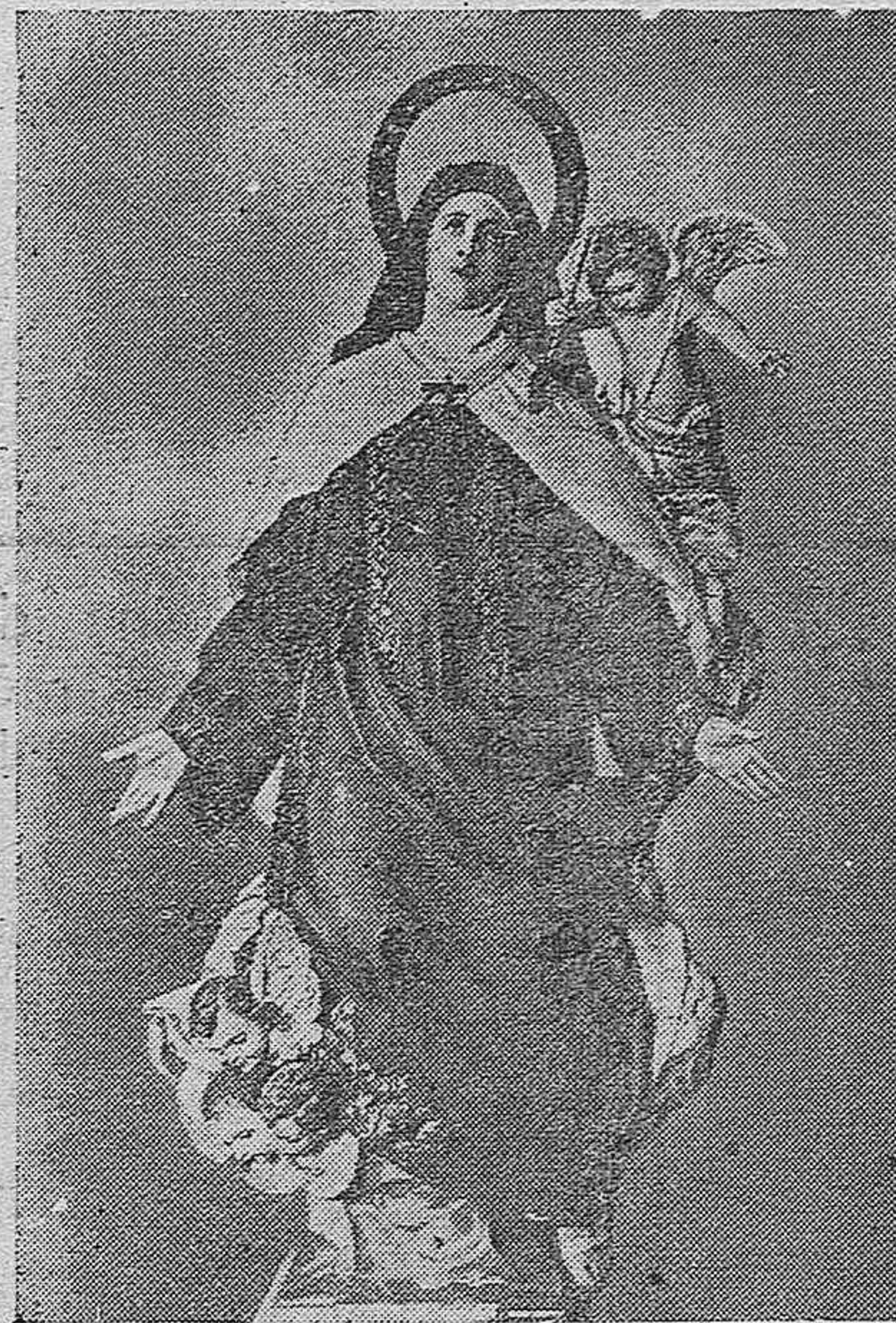
Imagen de la Transverberación de Santa Teresa, que se venera en el Convento de la Encarnación de Avila