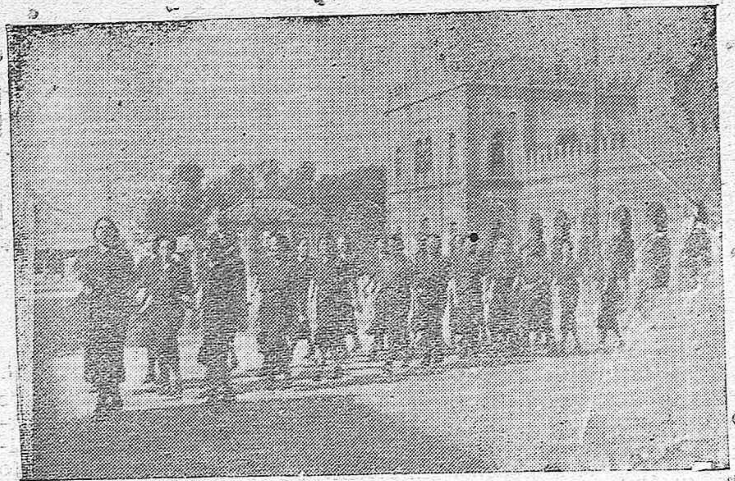
La Sección Femenina de Montilla llegando a Sevilla para continuar su viaje a Burgos

—Lo primero de todo, procurar a los camaradas que carecen de medios para costearlos, libros de estudio, llevando así, a la práctica, nuestra consigna que dice: "Hacer asequible la enseñanza a todo español capacitado". Estoy preparando una función de teatro para conseguir fondos, pues el curso ha empezado, y