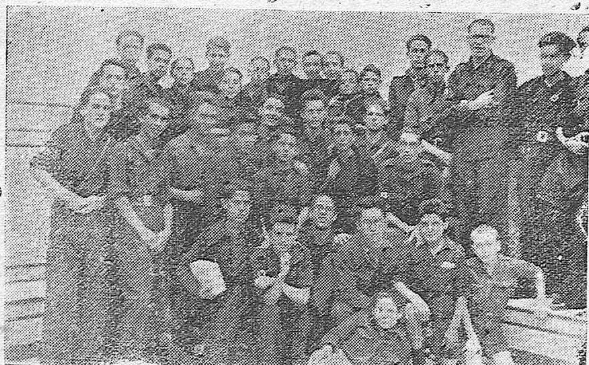
La representación del S. E. U. de Aguilar de la Frontera que fué al magnífico acto de la concentración de Burgos.