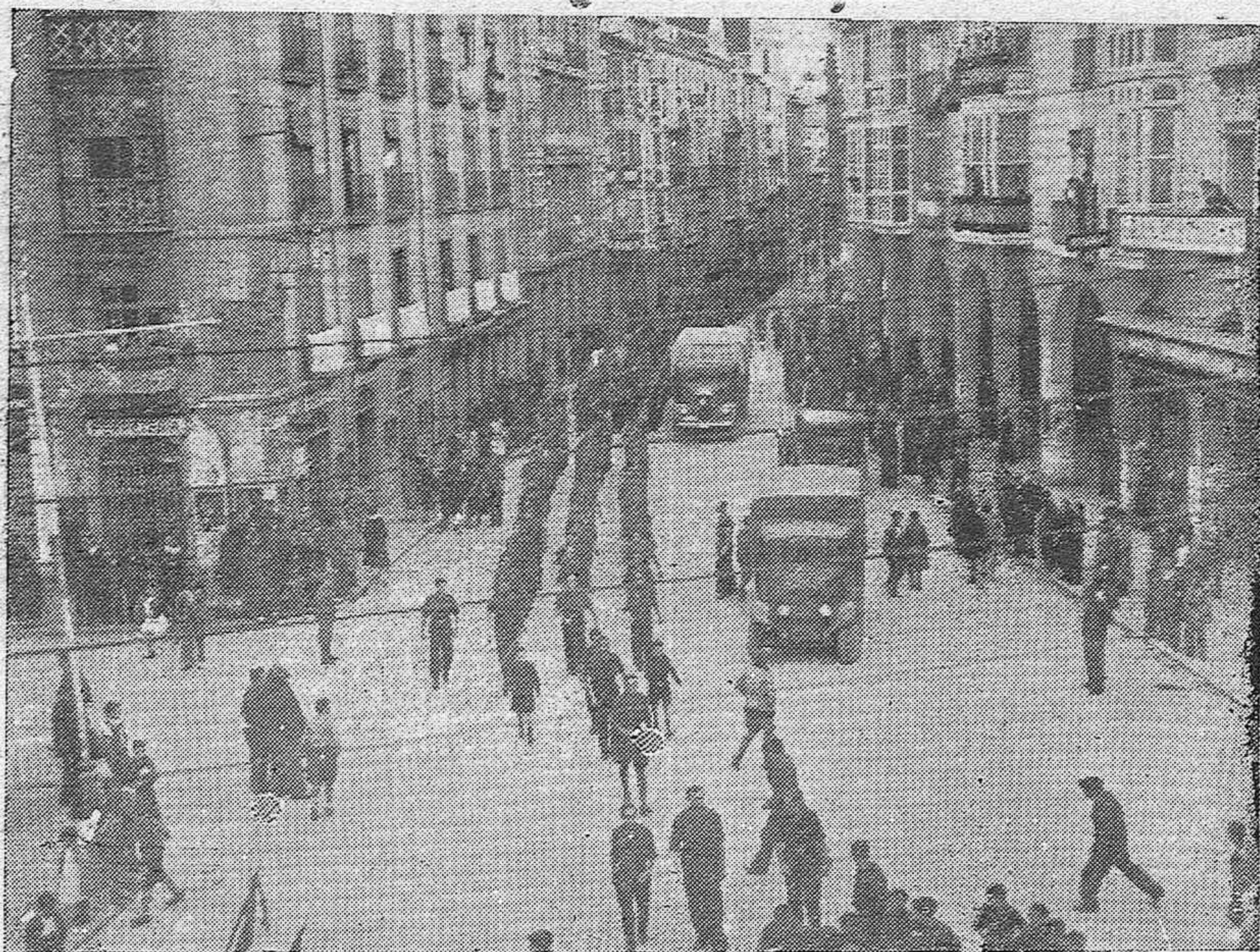
El S. E. U. de Córdoba, desfila marcialmente por una de las calles de Burgos.