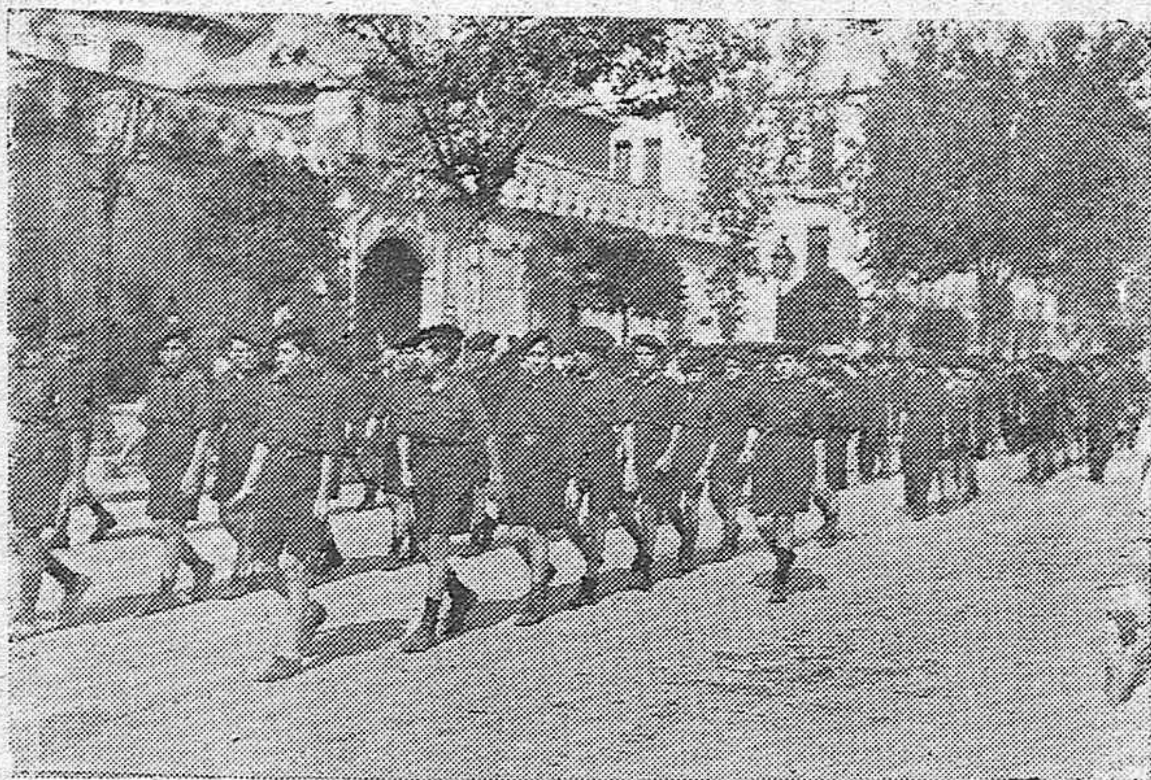
La Organización Juvenil, esperanza de España, desfila por la Avenida del Gran Capitán en Córdoba.