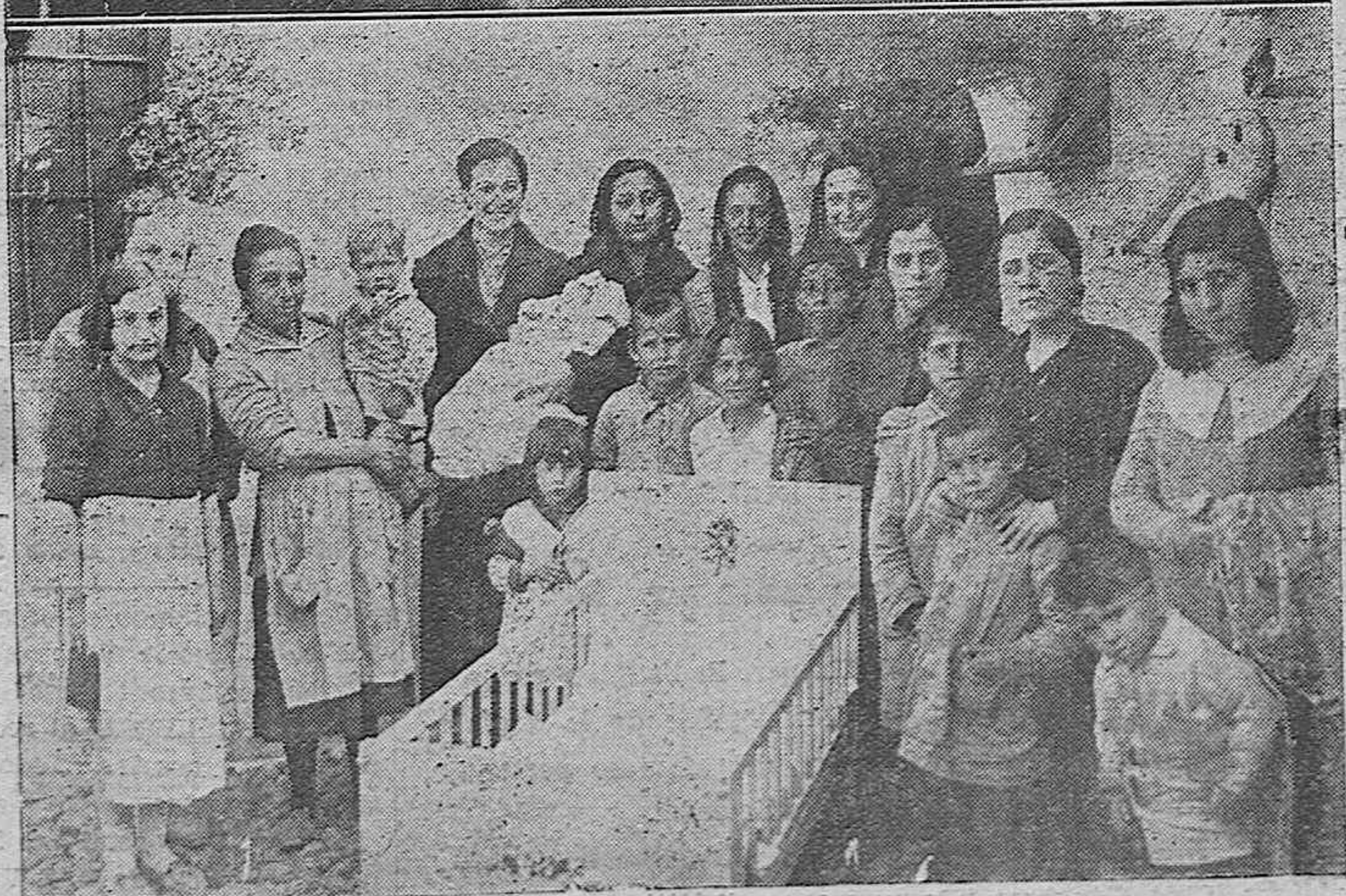
Bellas señoritas entregando varias cunas con las envueltas correspondientes a familias necesitadas, y cuyos últimos hijos nacieron en fecha próxima al día de Nochebuena.