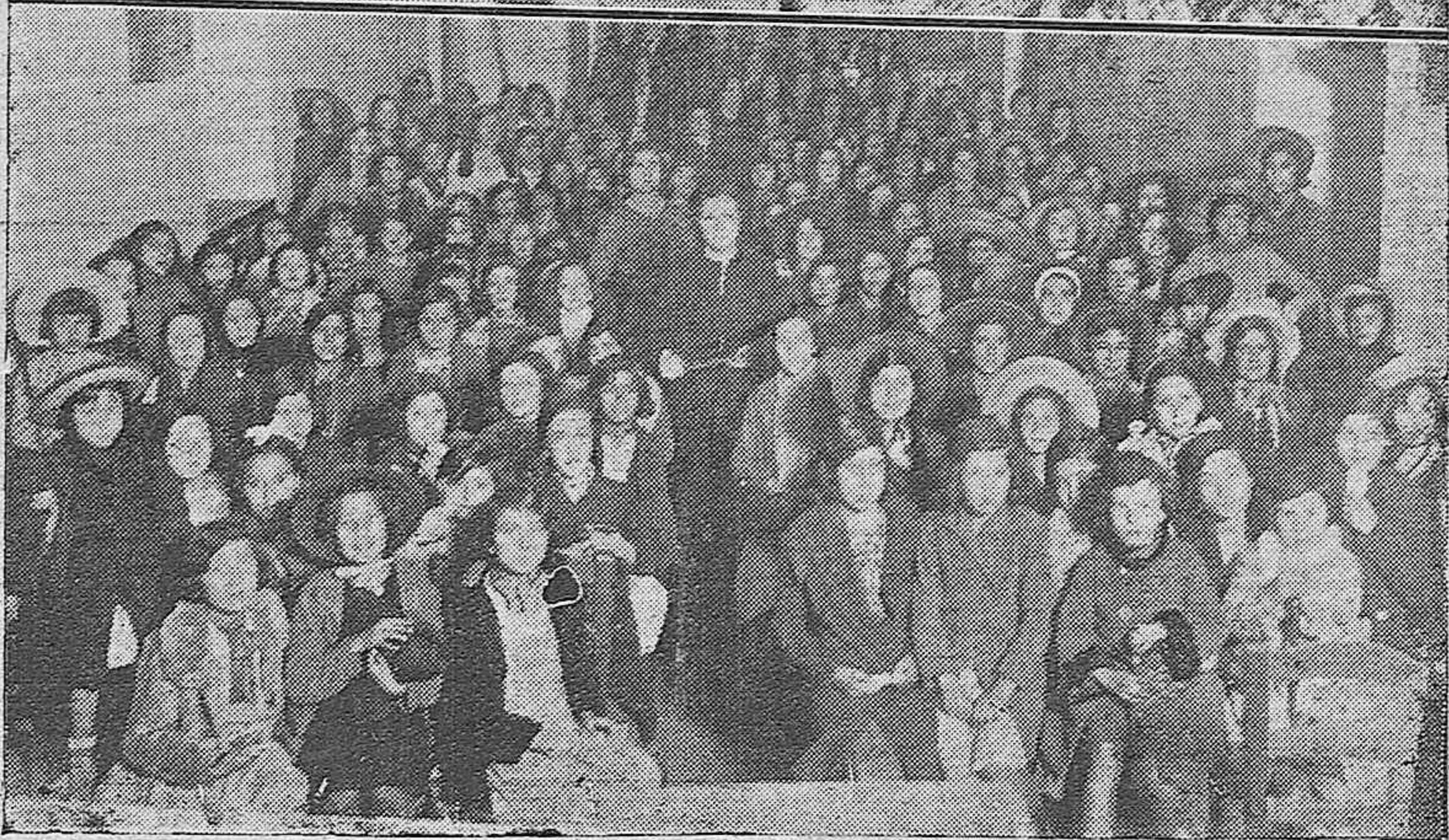
Arriba: Grupos de jóvenes confeccionando flores y otros adornos para la cabalgata de los Reyes Magos. —Abajo: Niñas ensayando los villancicos que vestidas de pastoras han de cantar en el desfile de la gran fiesta infantil que se prepara para la noche del 5 de Enero.