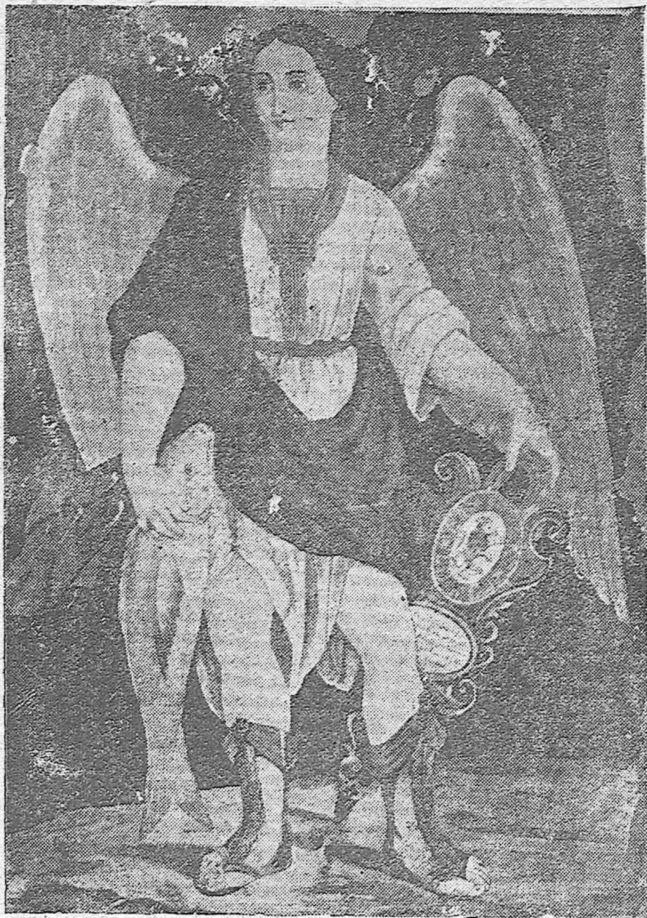
San Rafael Arcángel, Custodio de Córdoba. (Grabado antiguo)

Este templo que da la sensación de cierta grandiosidad y la iglesia del Colegio de Santa Victoria, de cuya construcción fué encargado el arquitecto francés don Baltasar Drevetón, son dos bellos ejemplares en nuestra ciudad de la