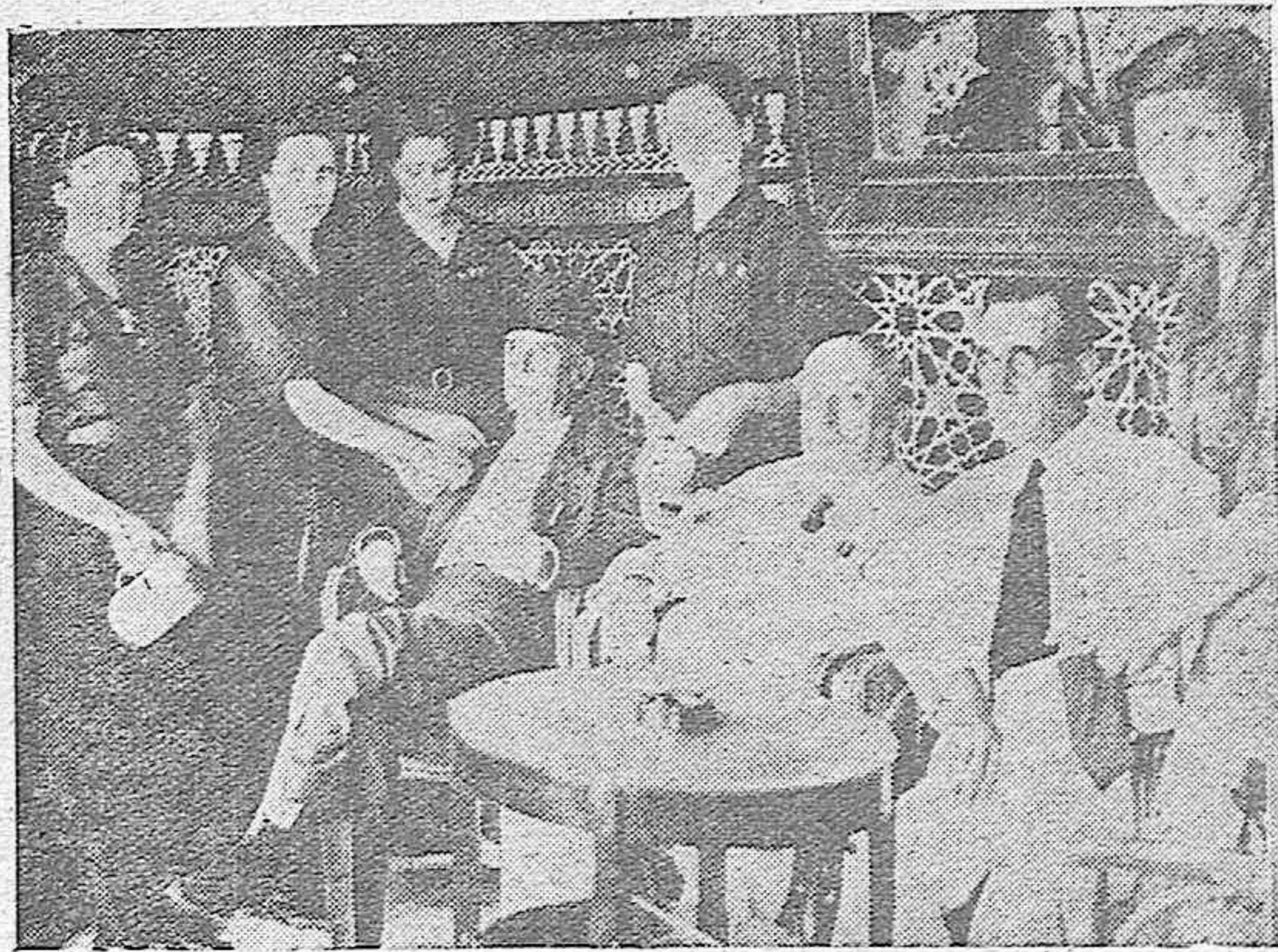
Las gentiles camaradas de la Sección Femenina de FET y de las ONS imponen el emblema de «Auxilio Social» a dos famosos Rafaeles, Guerrita y Machaquito