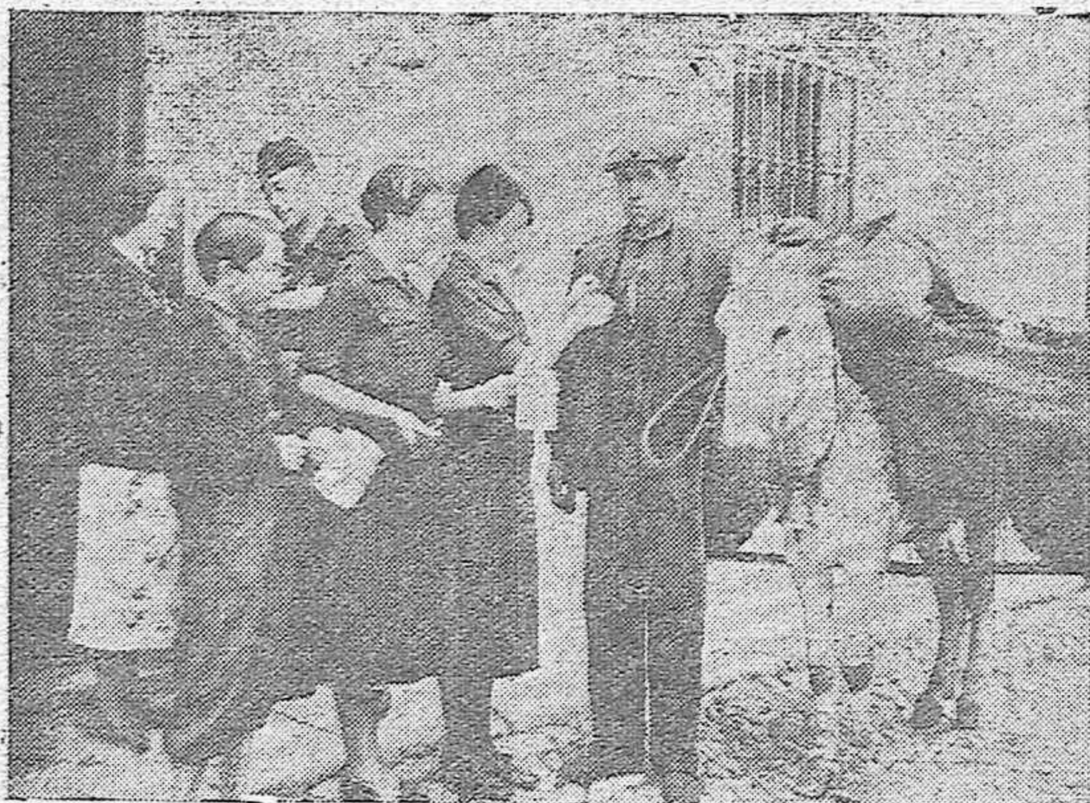
El piconero de Santa Marina que fué «sacado de pila» por Lagartijo, contribuye generosamente y luce con orgullo el emblema de «Auxilio Social»

Los niños que diariamente reciben sustento en los comedores y orfanatorios de la capital, se elevan a la cifra de mil ciento y para adultos se distribuyen diariamente entre las dos cocinas de hermandad y la dietética, unas mil raciones de comida abundante, nutritiva y suculenta.