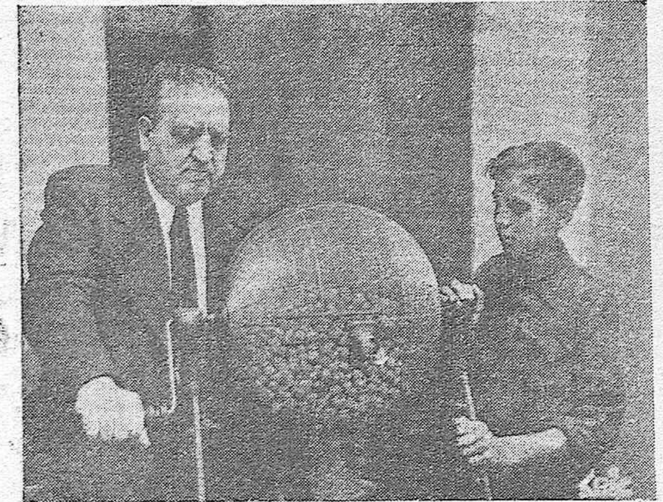
¡Atención! Comenzó su vertiginosa danza la b'lt'a mágica, que lleva en su entraña el número agraciado.

El cuarenta por ciento, para los ciegos; otro cuarenta, para premios; y un veinte queda de fondo para la Asociación.