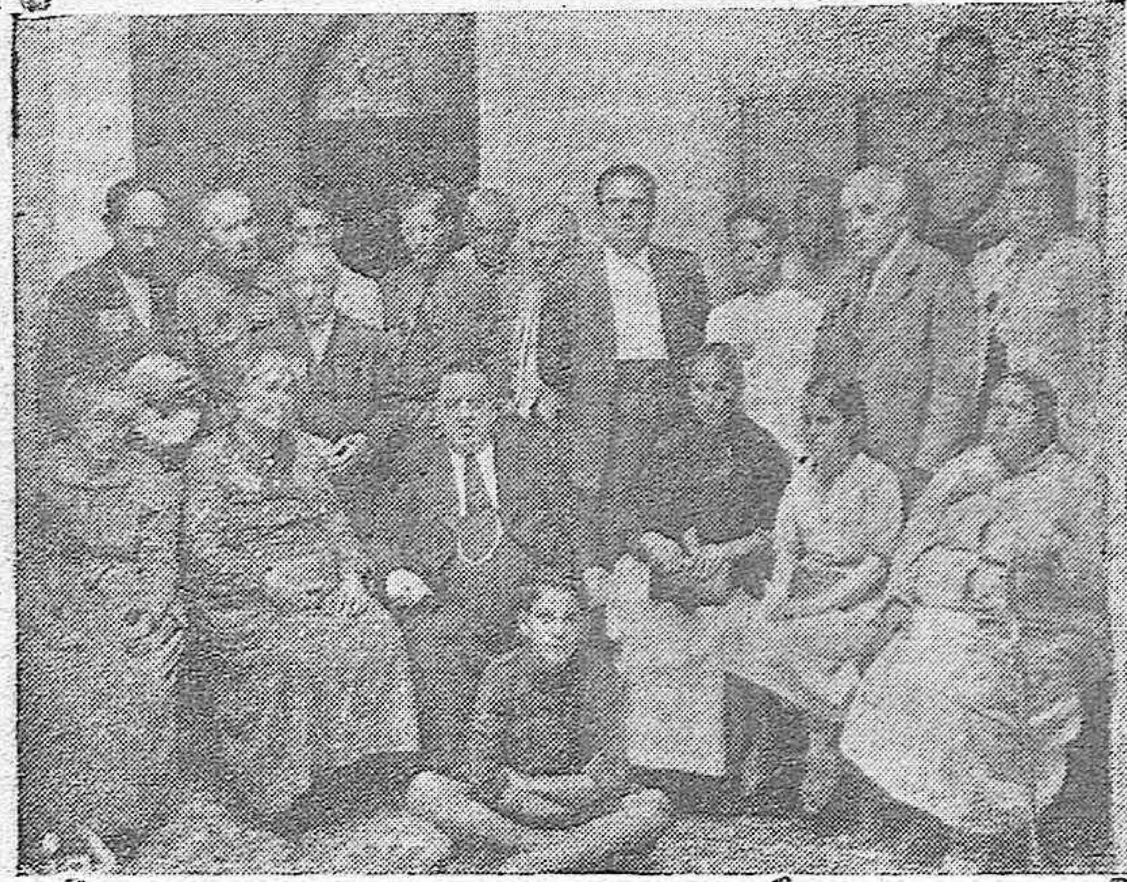
El Presidente de la Asociación Provincial de Ciegos rodeado de un grupo de expe. de lore. de cupon.

--¡Cuánto deben los cieguccitos a la Falange!-- Nos dice el Presidente de la Asociación.