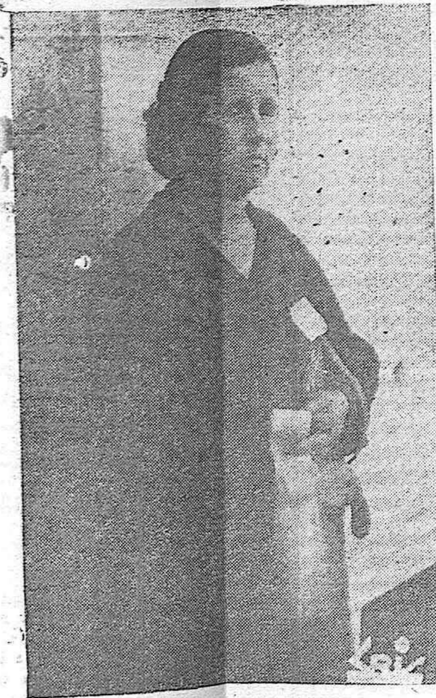
¡Cinco iguales para hoy! ¡Por diez céntimos treinta pesetas, para hoy!

Local confortable donde los sin vista departen aislados del ambiente callejero, peligroso, o del tabernario nocivo. En invierno, bien repletos braseros templan el local.