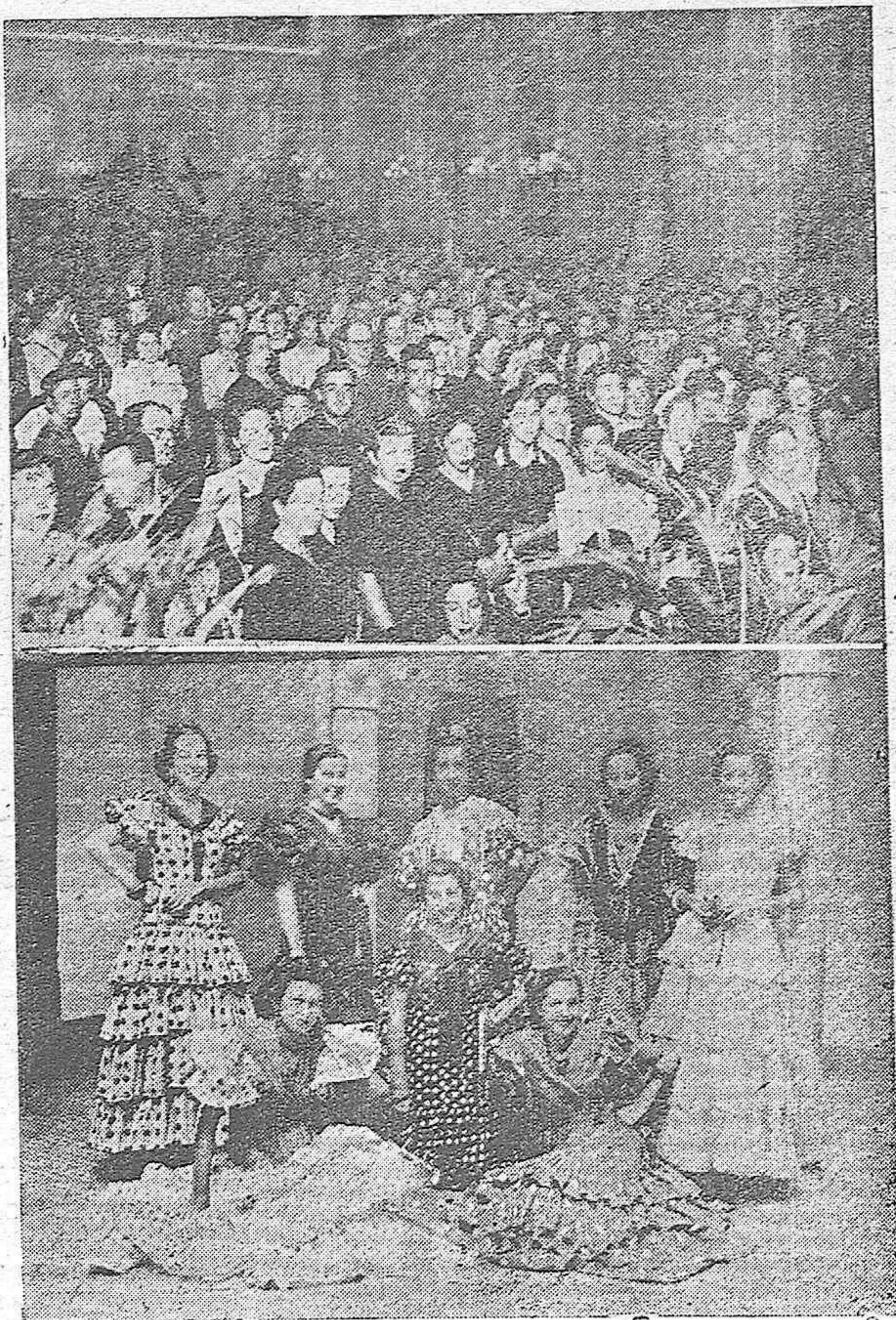
Un aspecto del Salón de Círculo durante el festival.—Bellas señoritas que tomaron parte en la fiesta y que fueron ovacionadísimas.