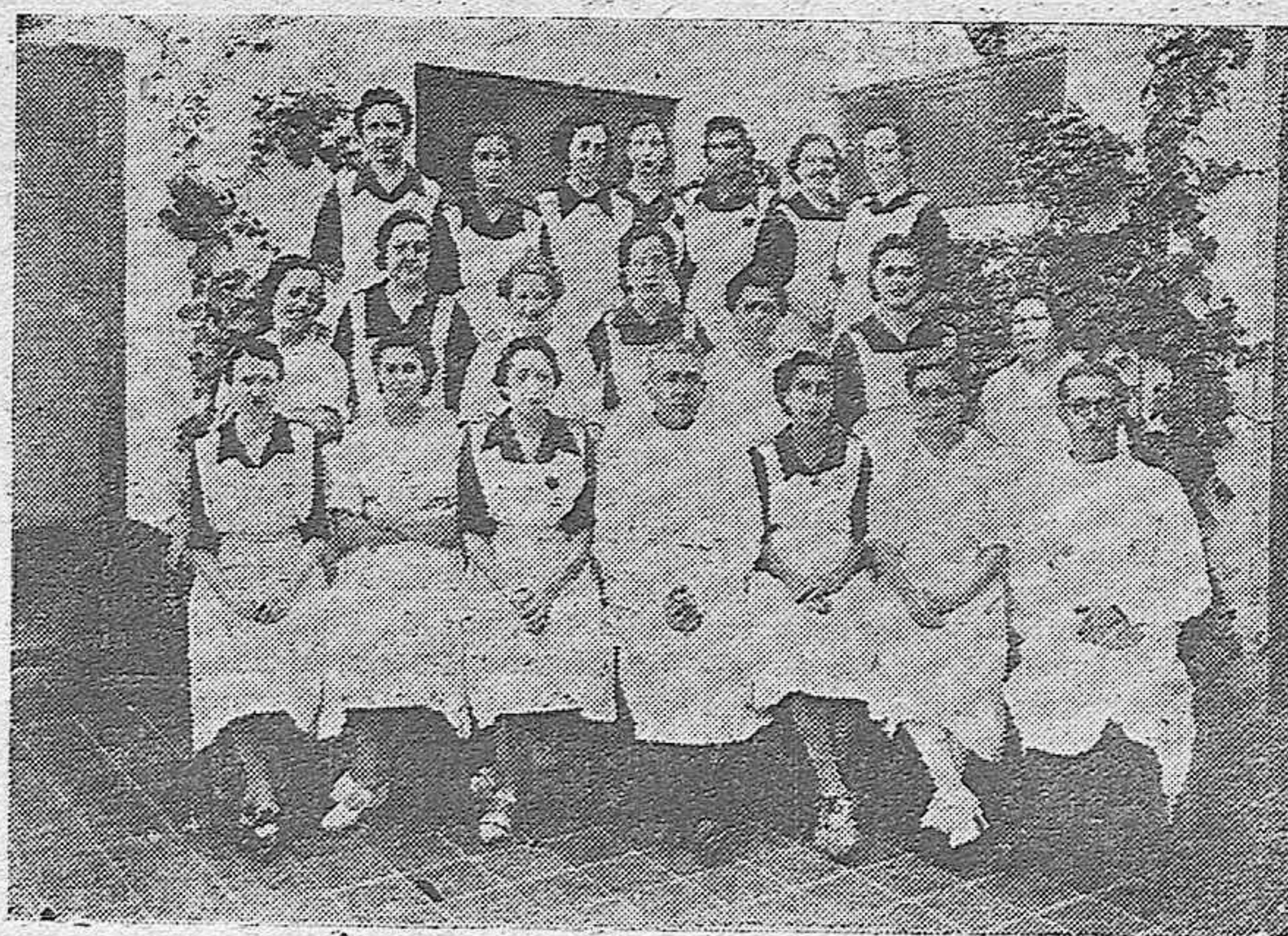
Nuestras camaradas de «Auxilio Social» que prestan servicio en la Cocina Dietética y Comedor de Diabéticos, bajo las órdenes del Doctor Peralbo.