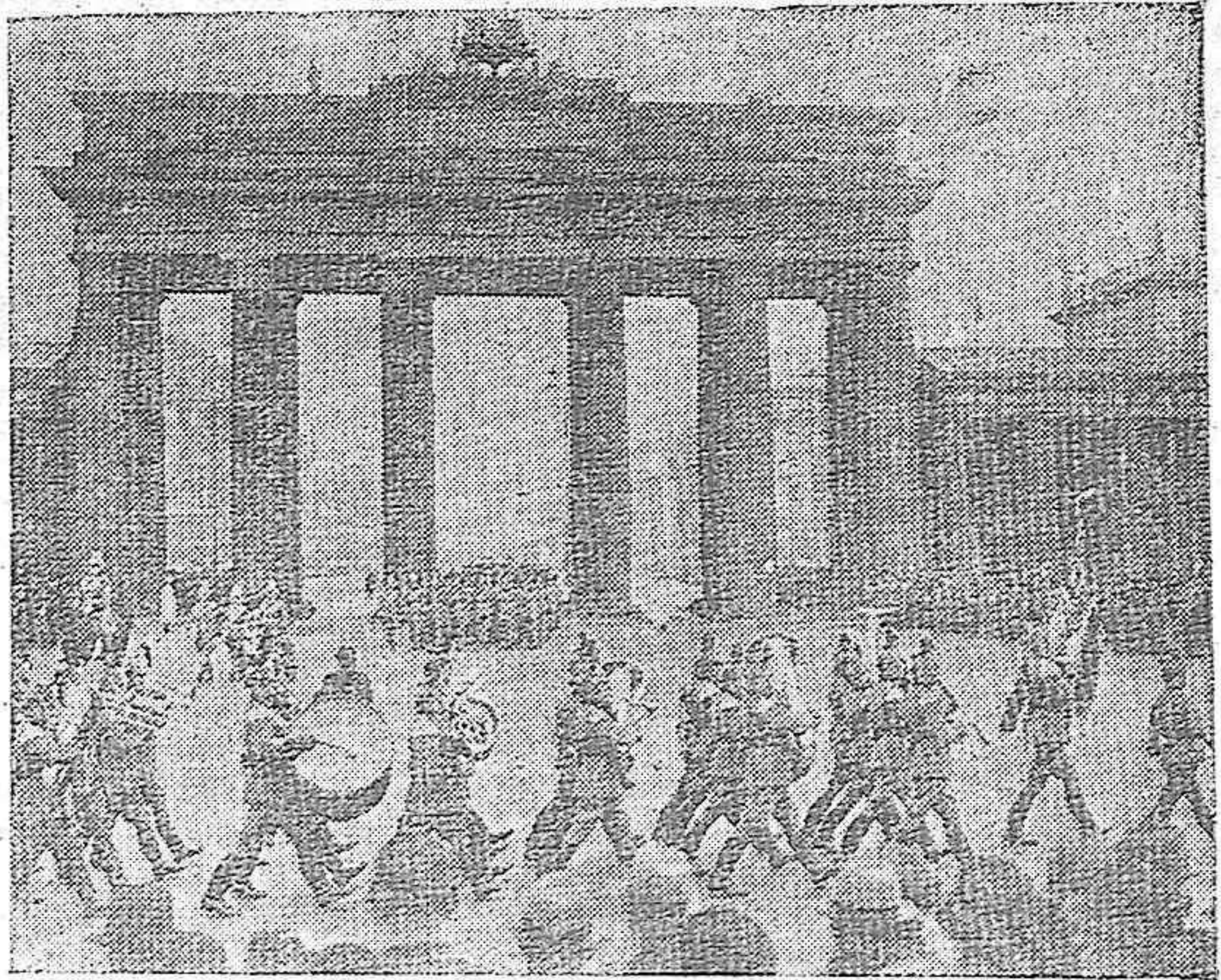
La policía alemana al servicio del «Auxilio de Invierno» --Un regimiento de la policía alemana, en uniforme de gala, dirigiéndose al centro de Berlín para postular en beneficio de la gran obra del Auxilio Social.

Parador de Alsásua, Invierno del Año de la Victoria.