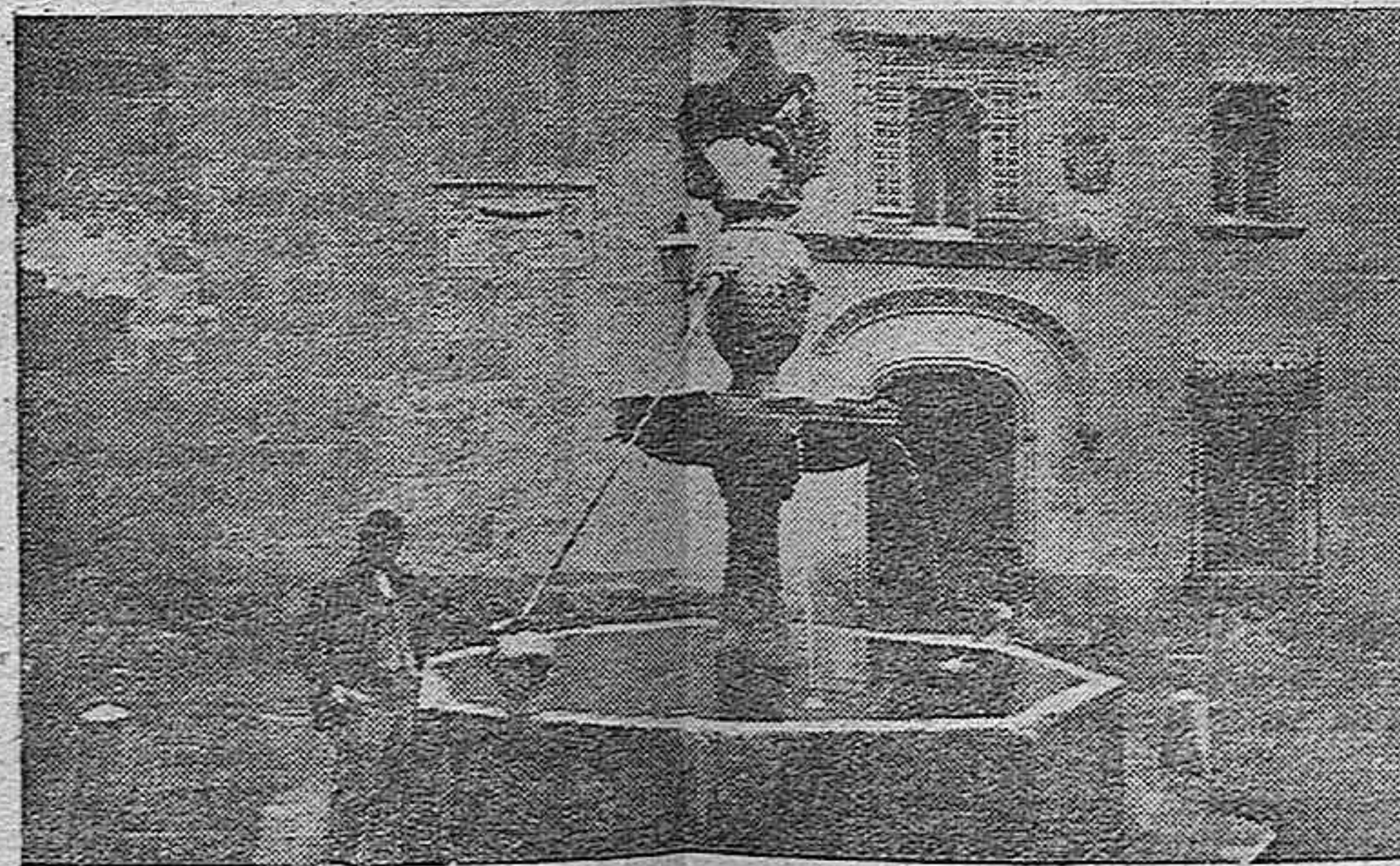
"¿Dónde está Córdoba, amigo—mi Córdoba entre naranjas?"

Atención a Radio Córdoba. Próximamente empezarán las emisiones del S. E. U.