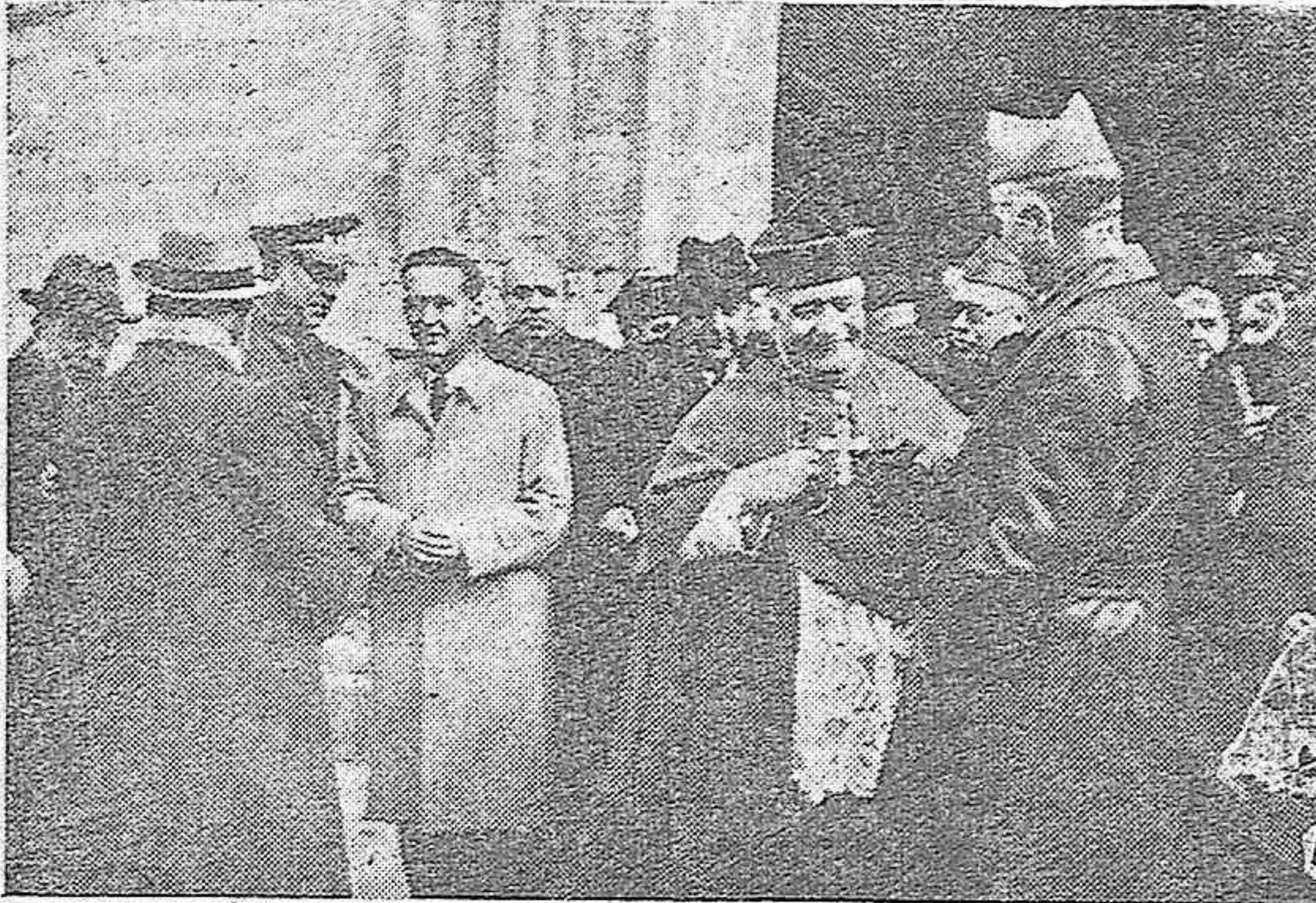
El General Queipo de Llano, al salir de los funerales, conversando con el Excmo. e Ilmo. señor Obispo de Córdoba.