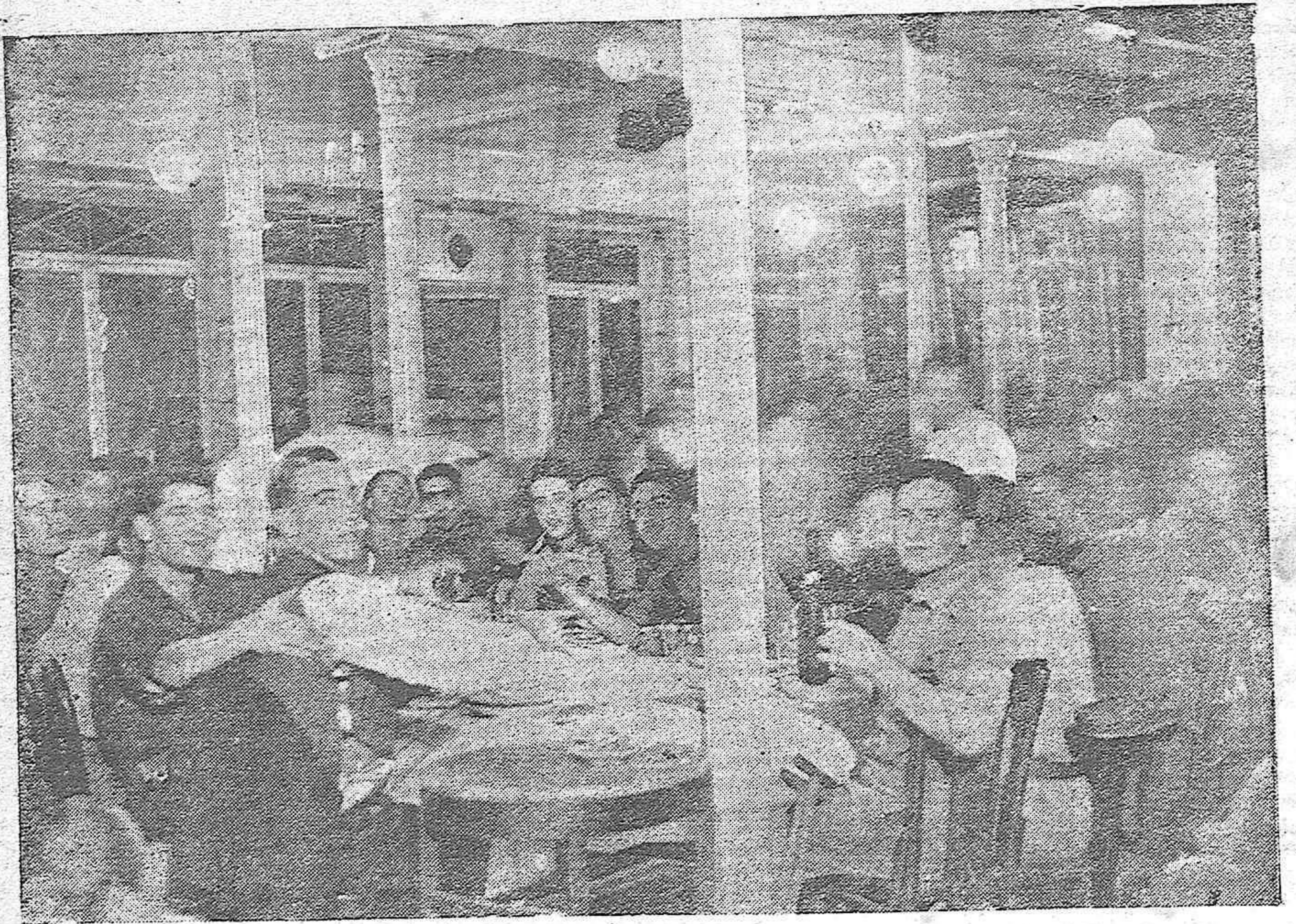
Un detalle de la cena de Año Nuevo en el «Hogar del Herido» en Córdoba.—Los bravos combatientes por España fueron obsequiadísimos y ellos aparecen en la foto satisfechos de las atenciones que recibieron.