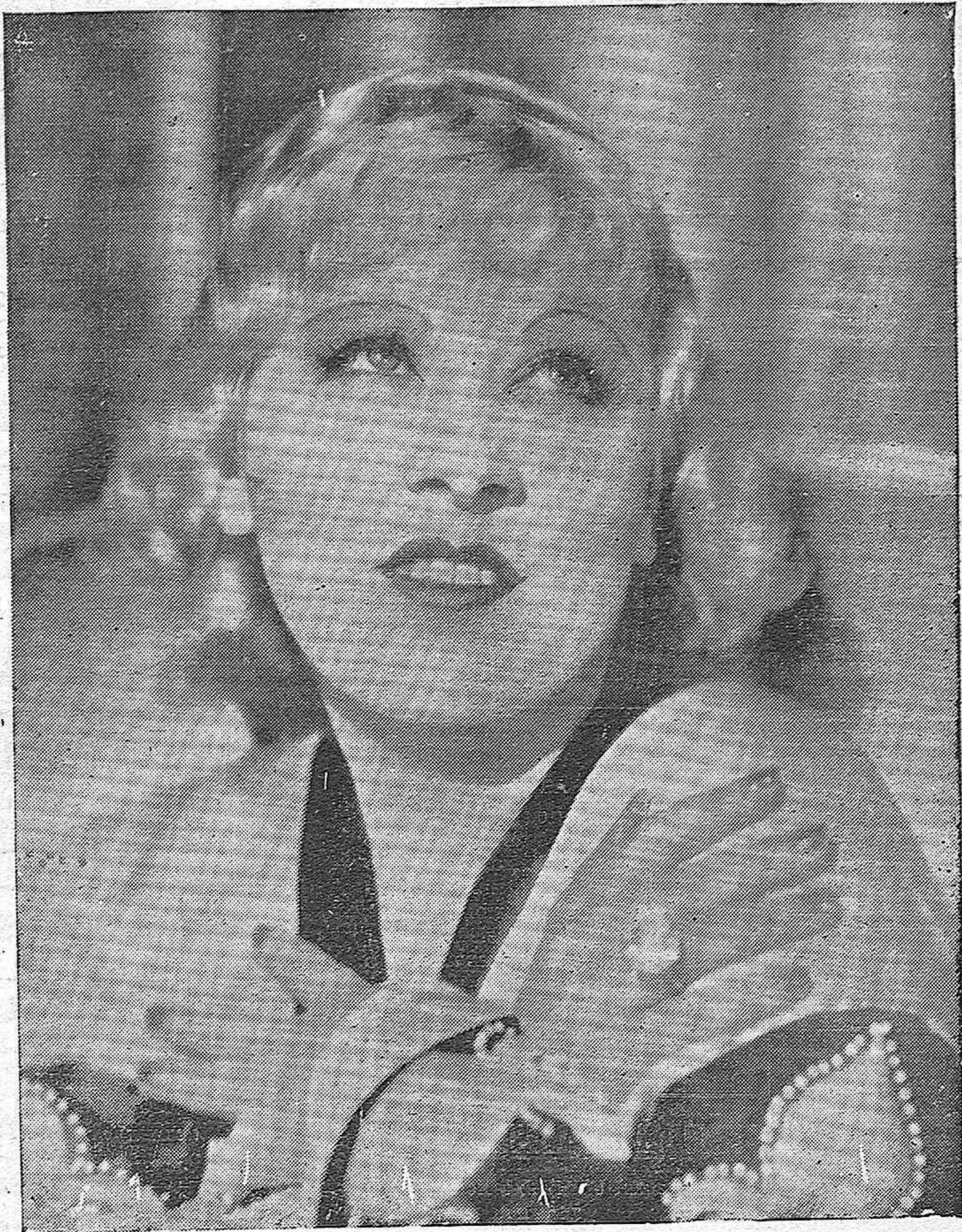
MAE WEST. la sugestiva actriz de la Paramount, protagonista de la hermosa película "No soy ningún ángel"