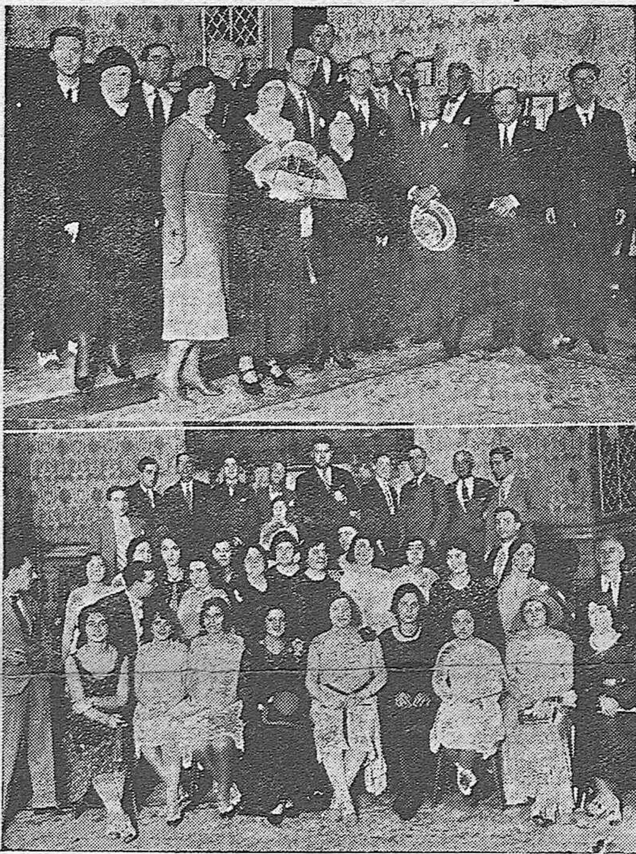
EN EL CONSERVATORIO DE MUSICA

Y se levantó la sesión a las tres menos cuarto de la tarde.