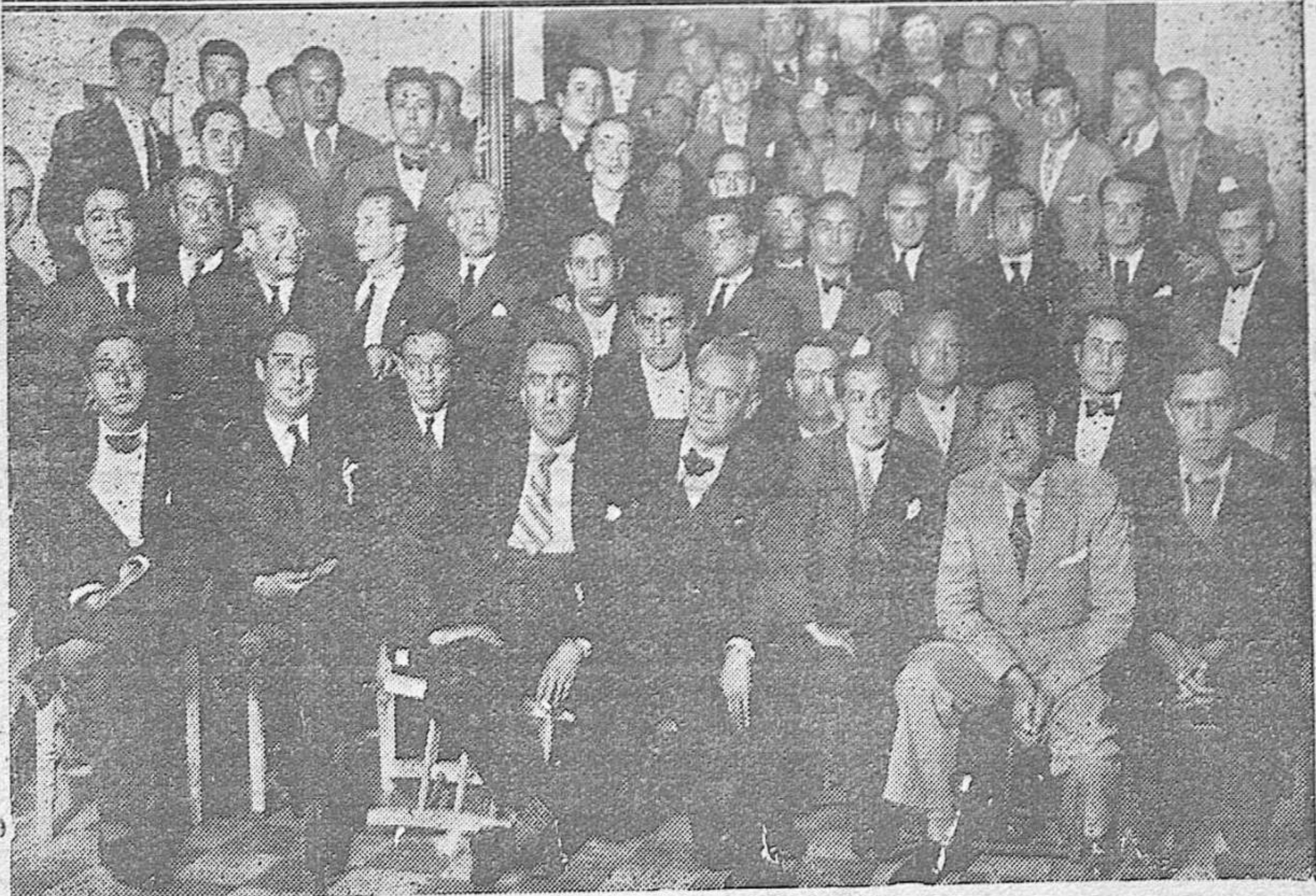
Arriba: Presidencia y oradores en el acto celebrado para festejar el 33 aniversario de la fundación de la Asociación "Unión de Dependientes, pe uqueros y barberos de Córdoba". Abajo: Algunos de los concurrentes al citado acto.