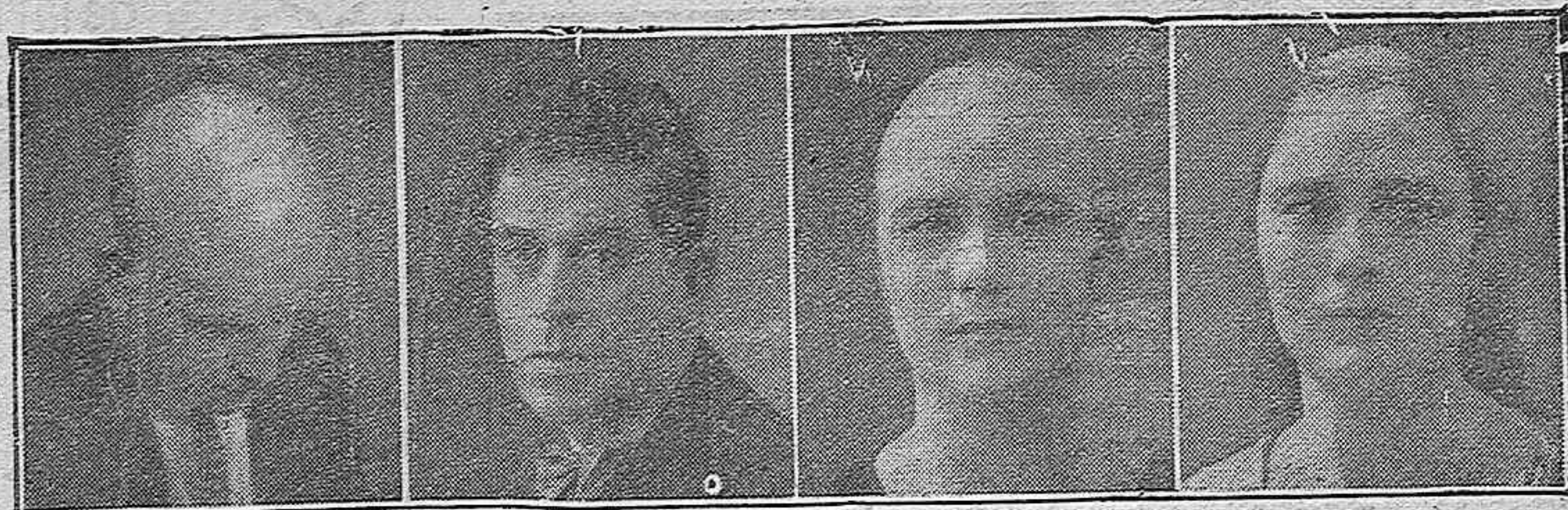
15 años calvo

65.000 cartas firman la eficacia. - 15.000 casos curados en Madrid, Barcelona y París. 2.700 casos dejados incurables toda clase de la calvicie. GRATUITAMENTE y la mitad precio de propaganda y exposición permanente de casos curados.