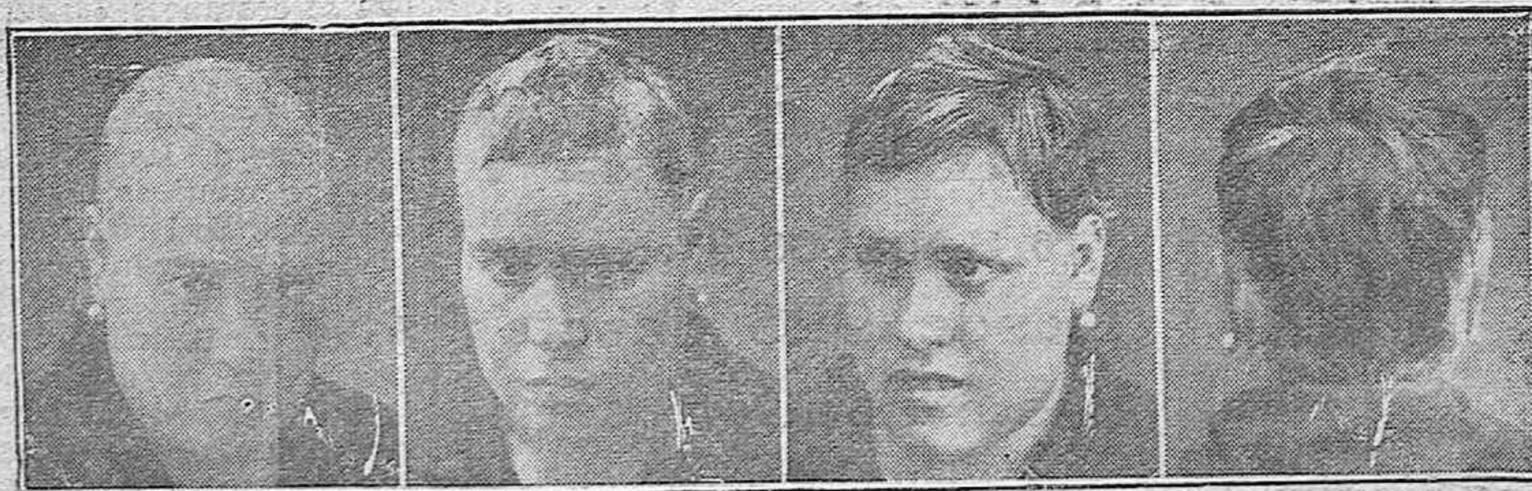
14 años calva

Todo frasco lleva esta etiqueta que sirve de garantía para el cliente.