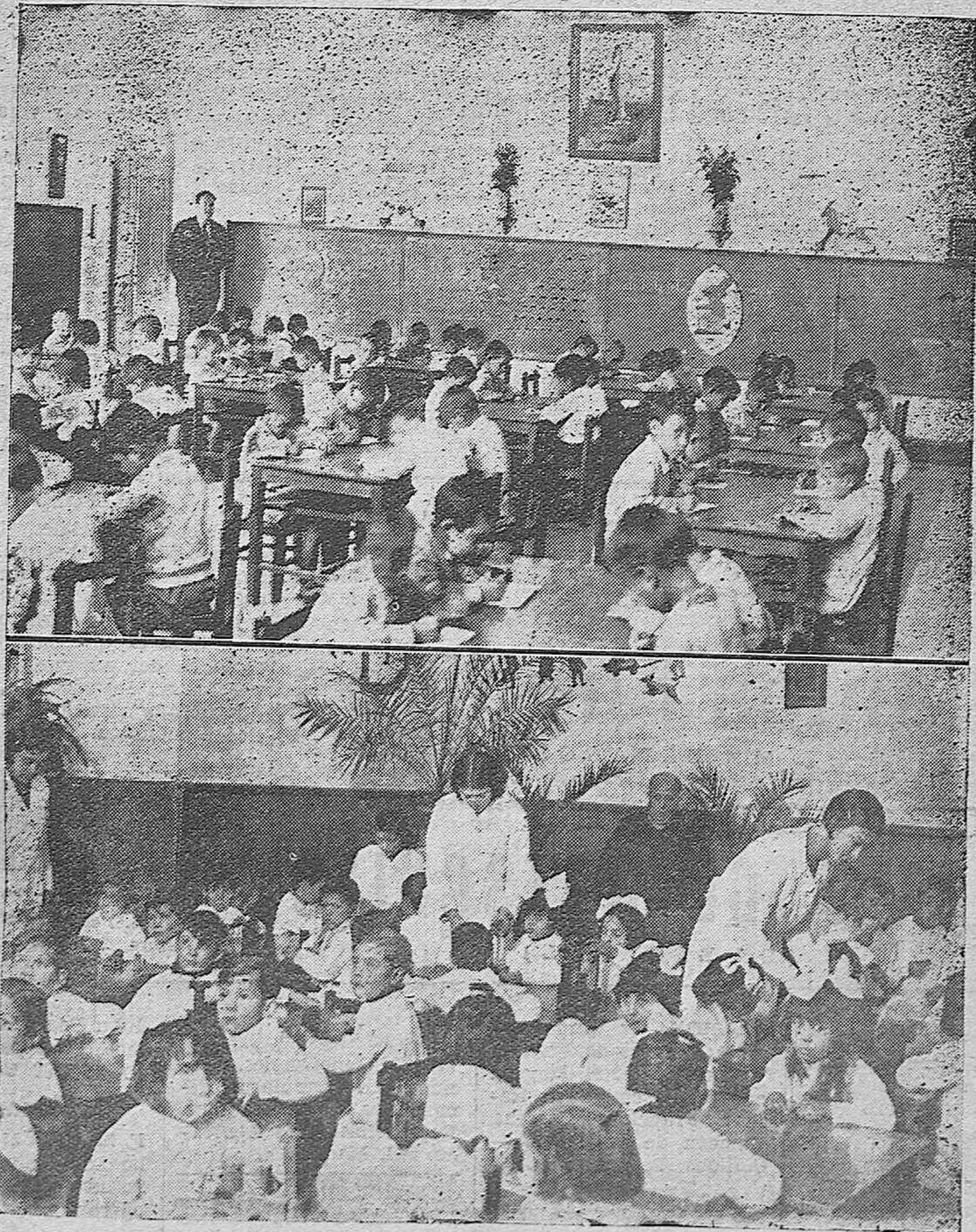
Una vista de las clases de párvulos del grupo escolar Carlos Rubio, y otra de la Escuela Maternal, durante un momento de la labor diaria.