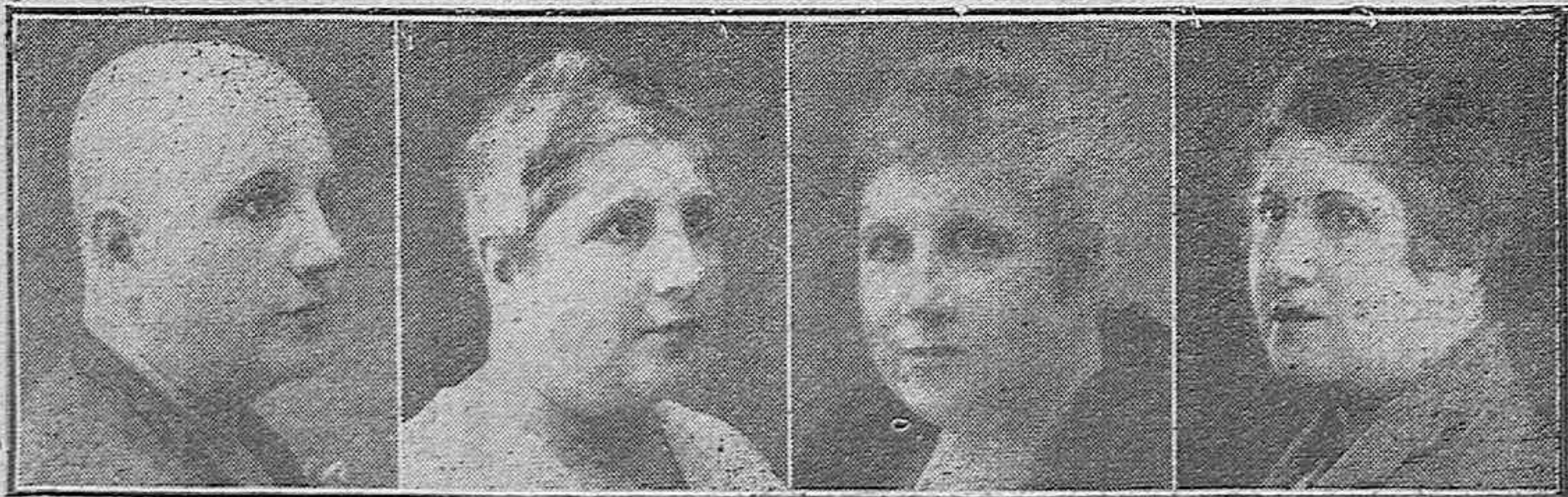
18 años calva

Todo frasco lleva esta etiqueta que sirve de garantía para el cliente.