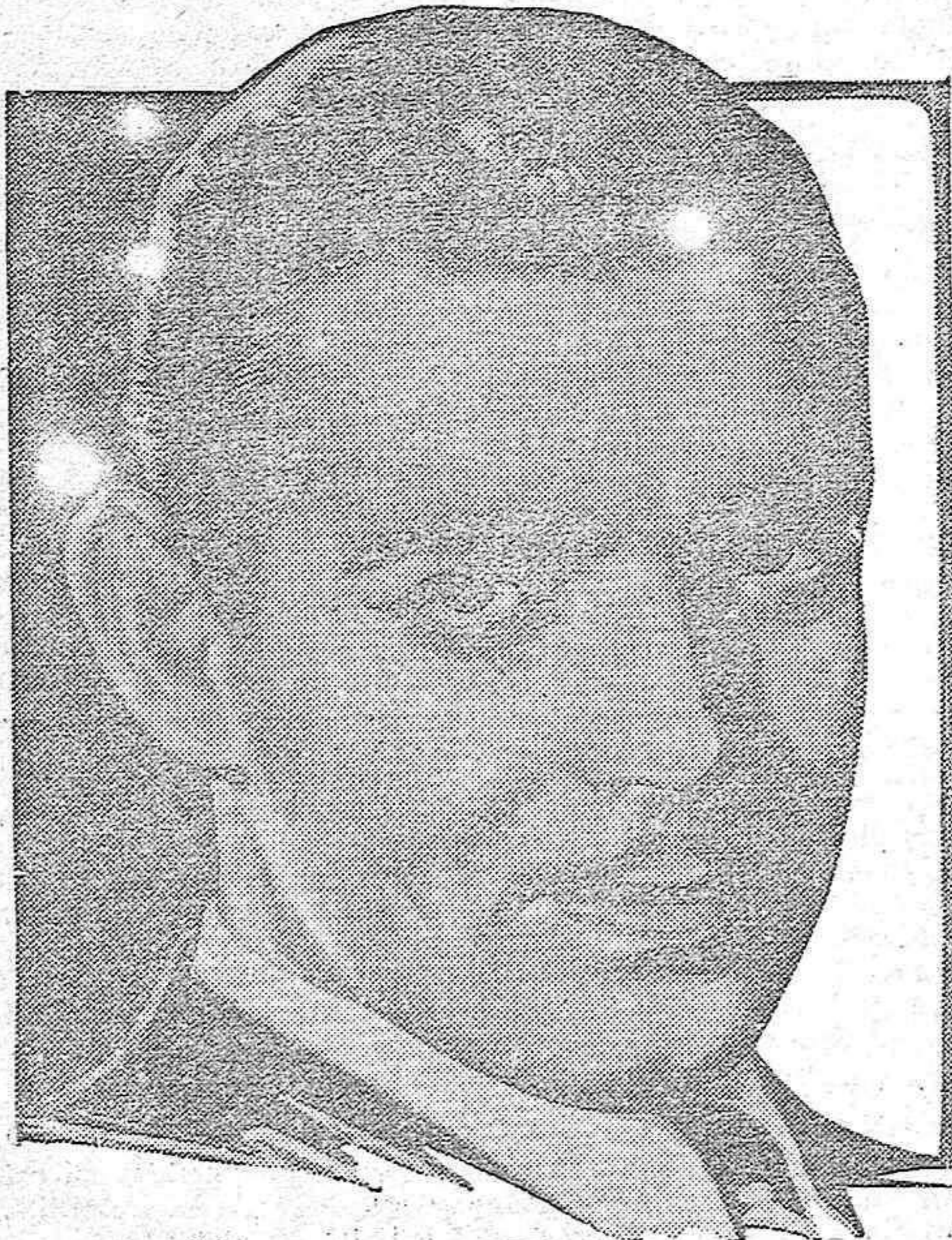
CLARK GABLE, PROTAGONISTA DEL FILM COLUMBIA "SUCEDIÓ UNA NOCHE"

Wilcoxon, el Marco Antonio de Cleopatra, y que De Mille incluirá en su nueva producción "Las Cruzadas", recurre al boxeo para conservar la línea. Como George Raft y Carl Brisson, Harry Wilcoxon, actor de Paramount, fué boxeador antes de dedicarse al cine.