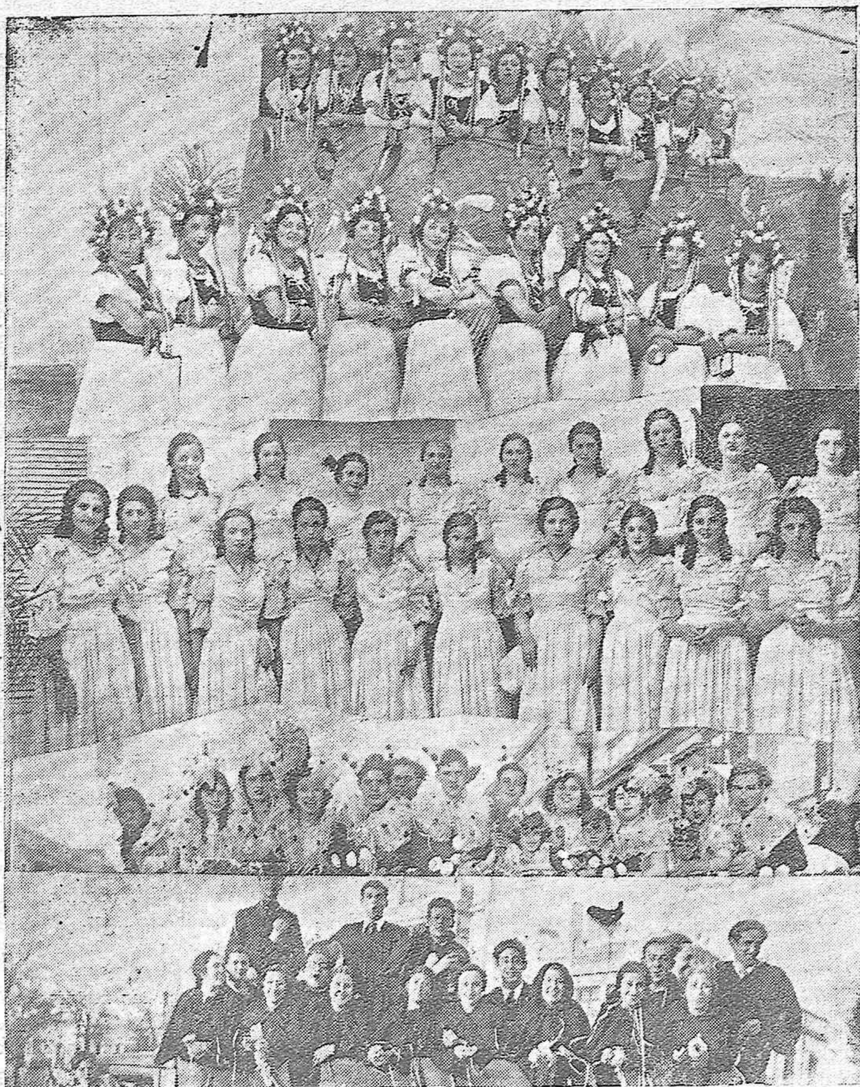
Varios detalles de las carrozas ocupadas por bellas señoritas que tomaron parte ayer tarde en la batalla de flores celebrada en el paseo de la Victoria.