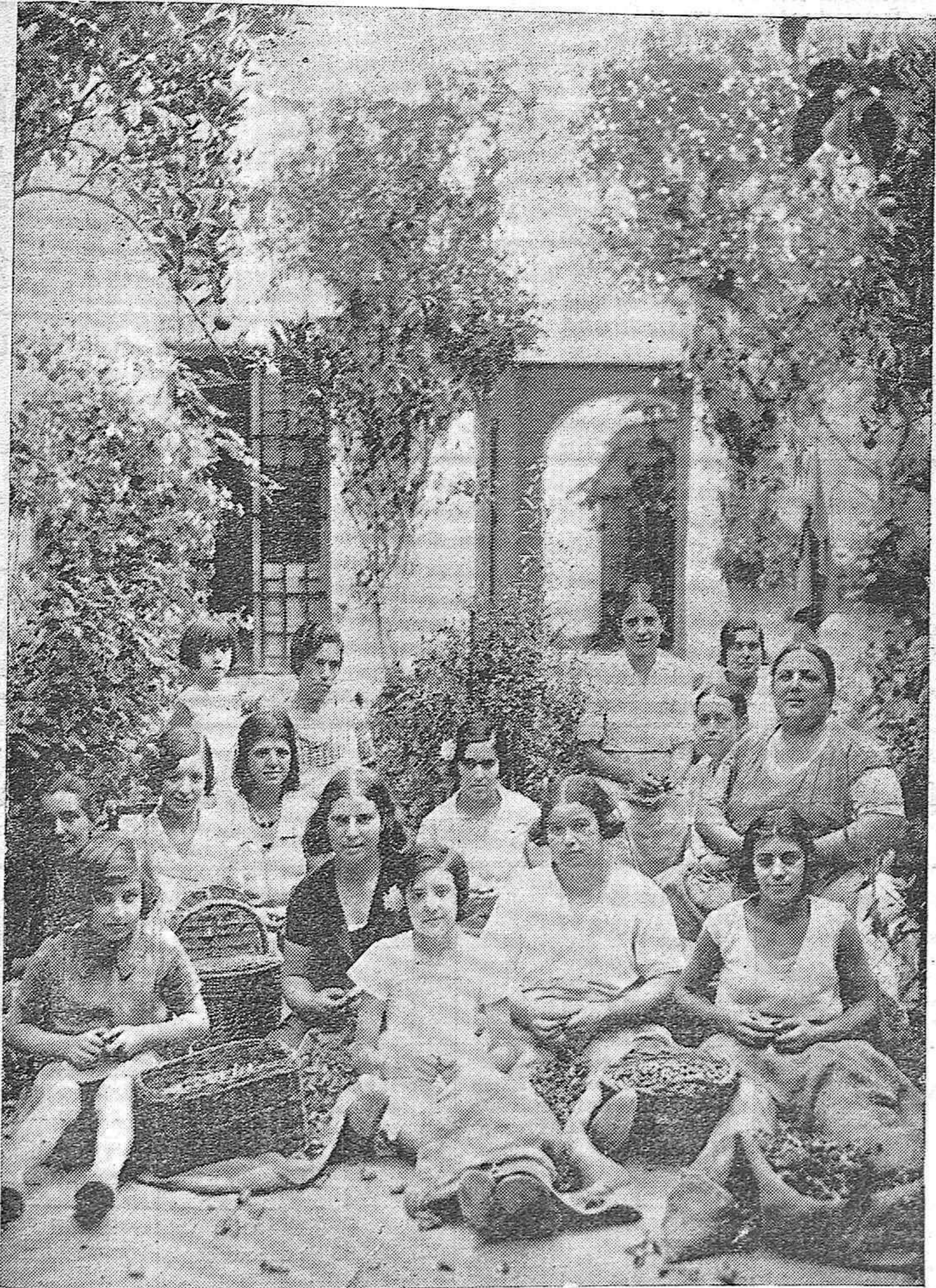
LAS AVELLANERAS CORDOBESAS. —Una nota típica y de actualidad es este bello patio de una casa de San Agustín, en la que encantadoras mocitas del barrio, obtienen un modesto jornal pelando las famosas avellanas que producen las extensas plantaciones de Trassierra