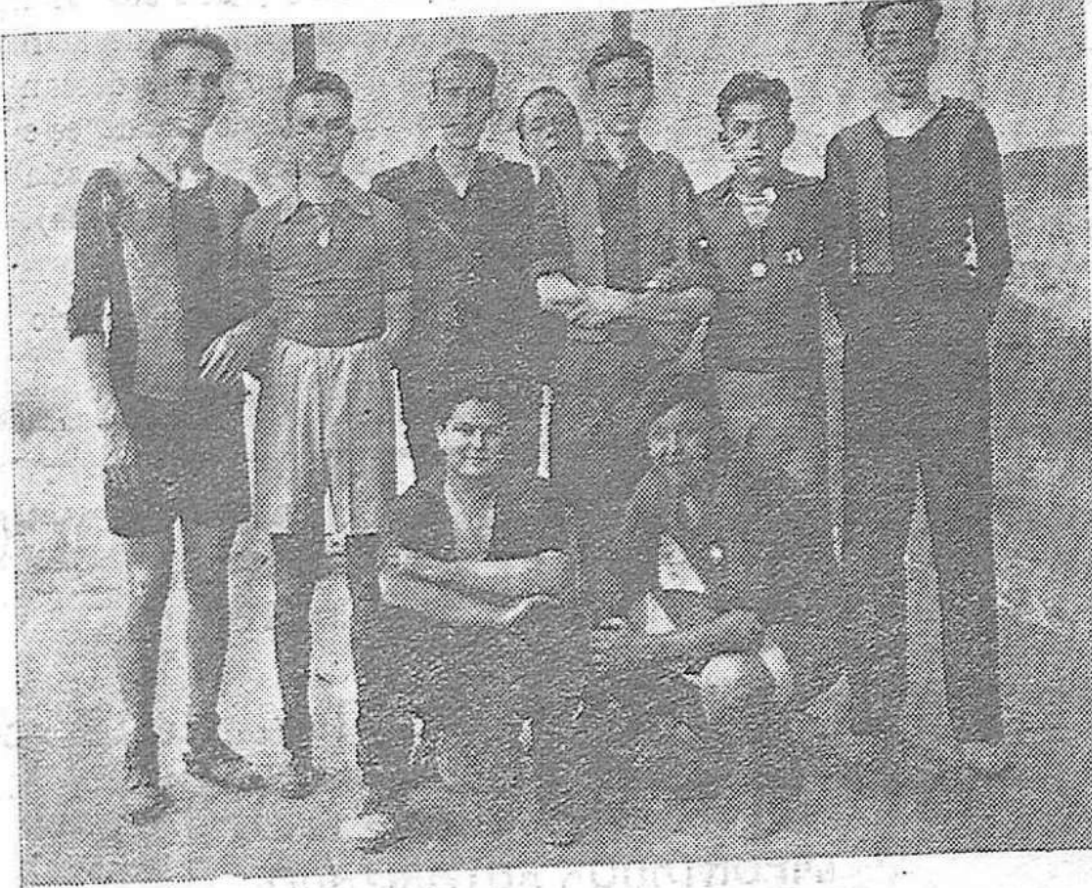
Equipo vencedor del partido de baloncesto celebrado en el campo deportivo de los Salesianos y organizado por el S. E. U. de Córdoba