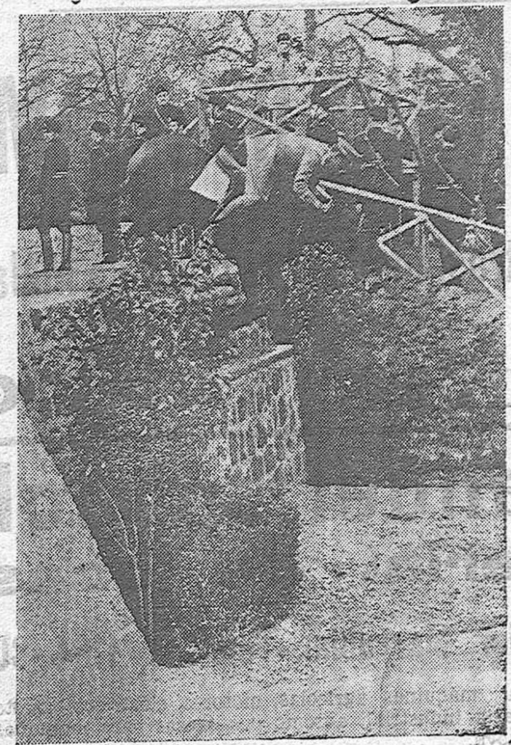
ROMA.—El Duce inaugura el campo Hípico de Villa Humberto.

Tragedia bárbara en Toledo; lejos del frente de batalla sin valentía y sin duelo los rojos lanzan su metralla. Sobre el dolor de la orfandad la muerte gira tenebrosa, y contra un signo de Hermandad la villanía abre la fosa. La paz del blanco comedor se enturbia en sangre de inocente, contra la infancia y el amor hacen la guerra inicuamente. La bestia roja muje y mata y no hay piedad que la contenga, negro rencor su afán desata, sin que en su furia se detenga. ¿Qué atroz designio va en su fila, y qué perversa sinrazón? Es el espíritu de Atila, odia al hermano corazón. Niños, mujeres toledanos, sangre de Abel allí esparida, caíes son vuestros hermanos que han puesto precio a vuestra vida. Hondo pesar, duro quebranto, la herida nuncal se restaña, Toledo está lleno de llanto, y con Toledo toda España. Tragedia bárbara y mortal, clama el dolor de los que gimen... vuela el siniestro Angel del Mal y se oyen los pasos del Crimen!