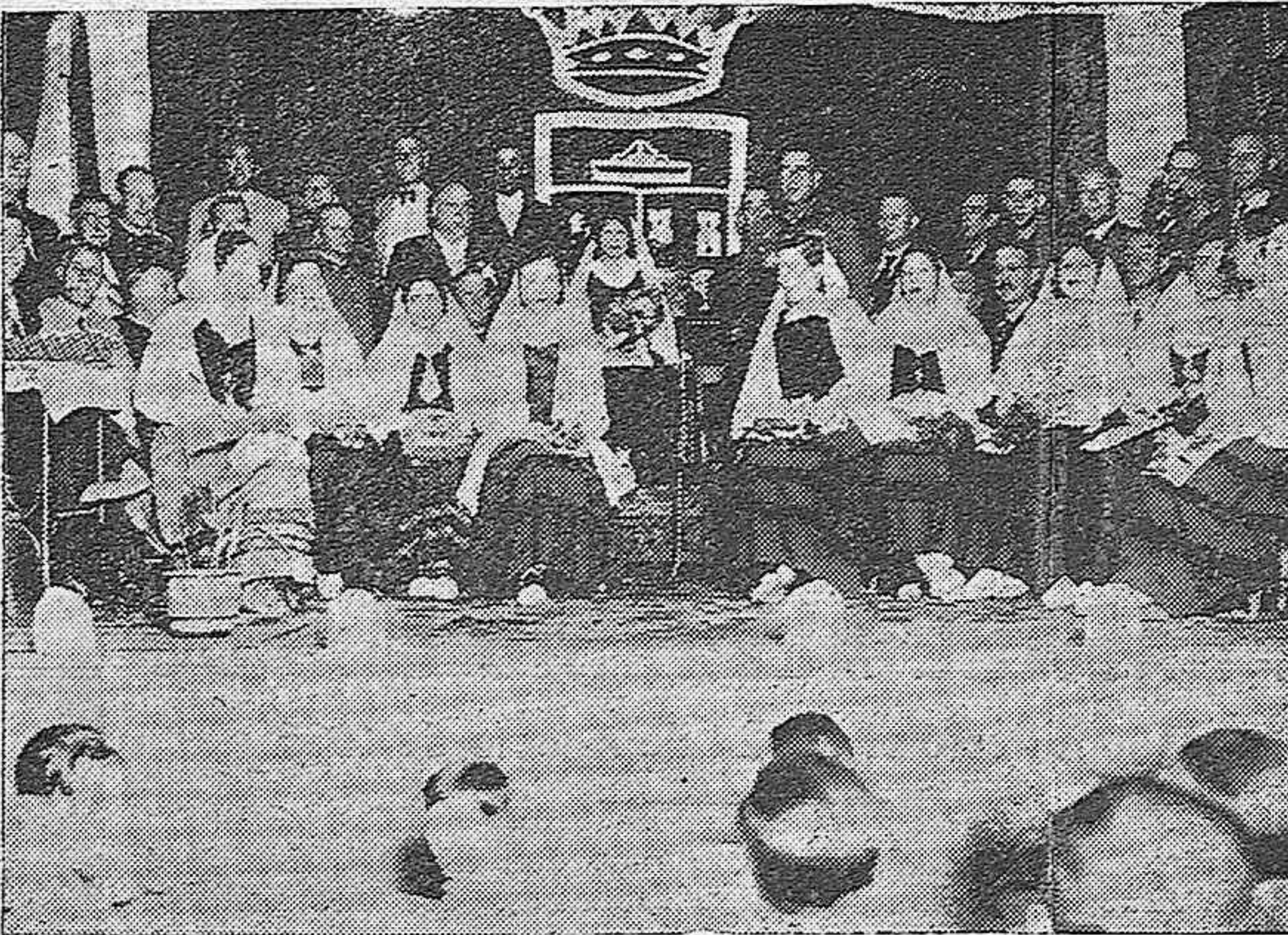
En el Teatro de Fuente Obejuna, se celebró el Gran Certamen Literario.—Vista de la Presidencia en la que figuran bellísimas señoritas de la localidad, el gobernador civil de Córdoba, alcalde de Fuente Obejuna, y otras personalidades.

El acto brillantísimo del Certamen del cual daremos más amplia información, ha constituido una nota destacada de los Festejos inaugurados, y un éxito rotundo de la Comisión organizadora.