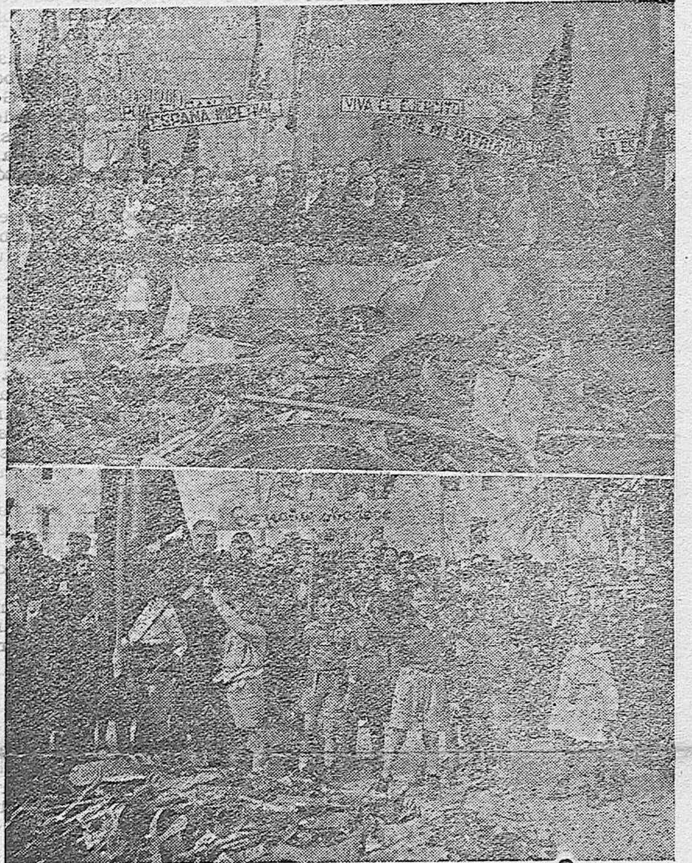
EL DIA DE LA CHATARRA EN LUCENA.—Autoridades que presidieron el patriótico acto.—Los niños de las escuelas públicas, haciendo entrega de la chatarra.