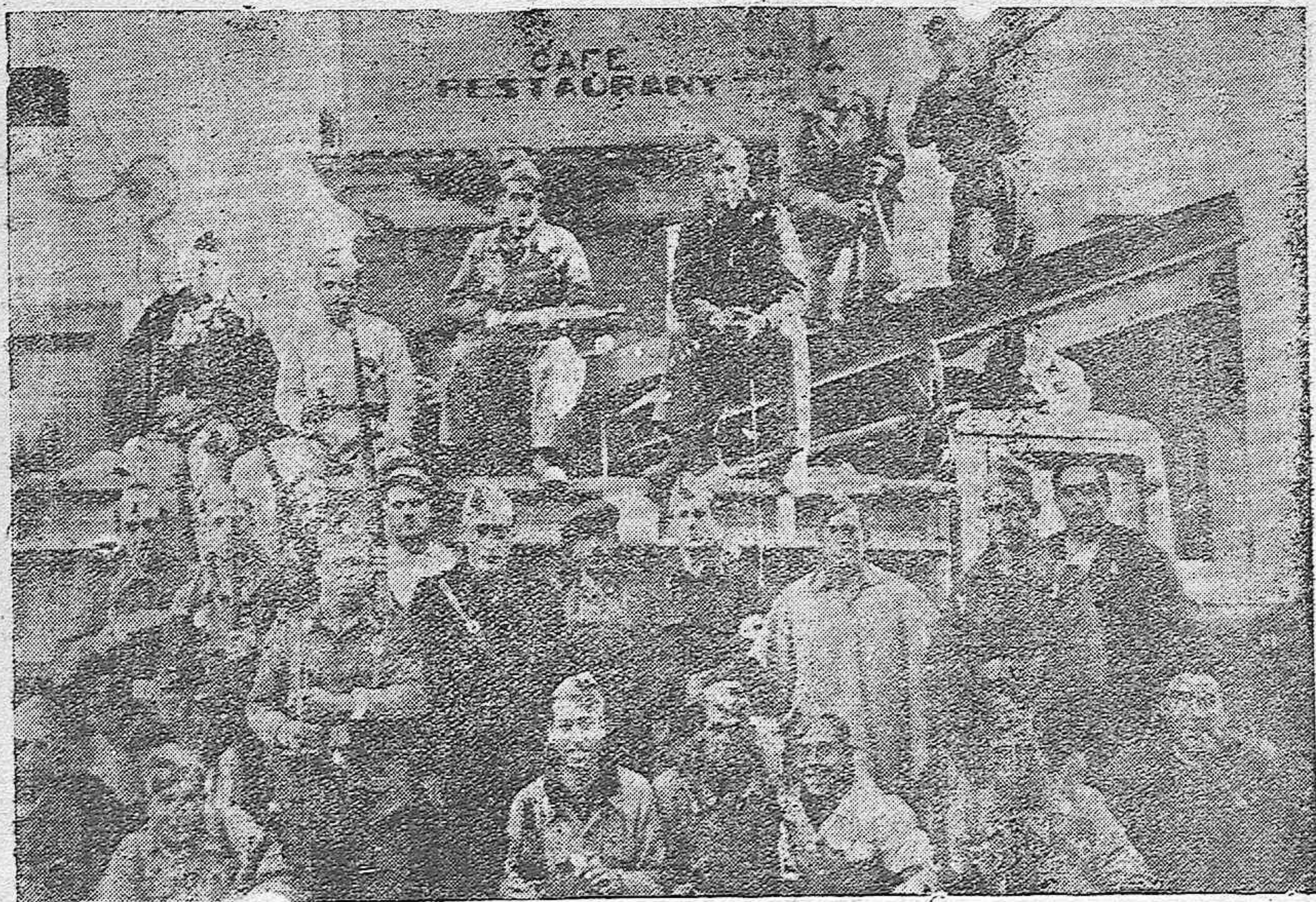
Un grupo de bravos ingenieros, en uno de los pueblos del frente, luchando por España, contra el marxismo criminal