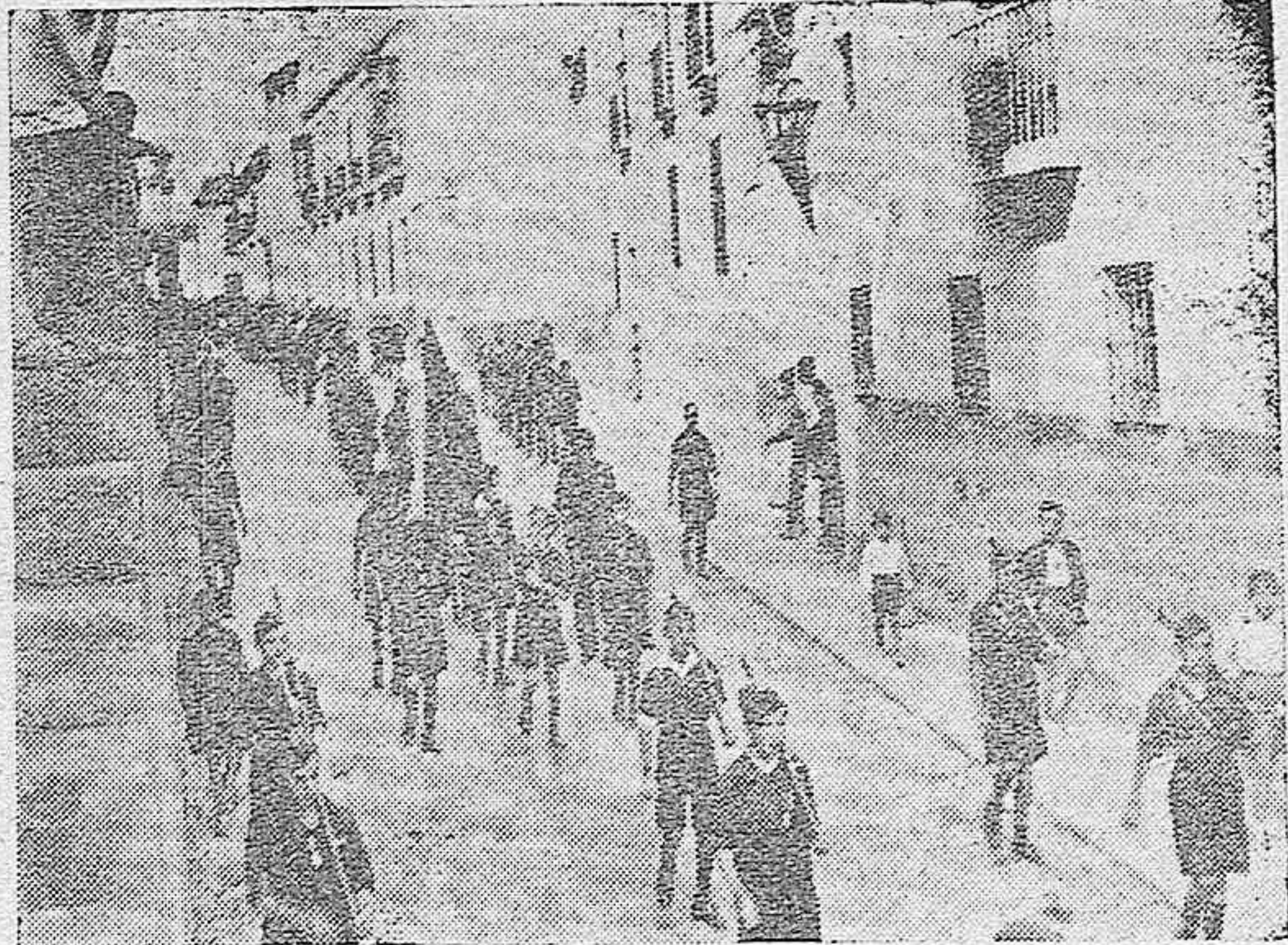
Los "flechas" desfilan marcialmente por una calle de Córdoba después de asistir a misa.