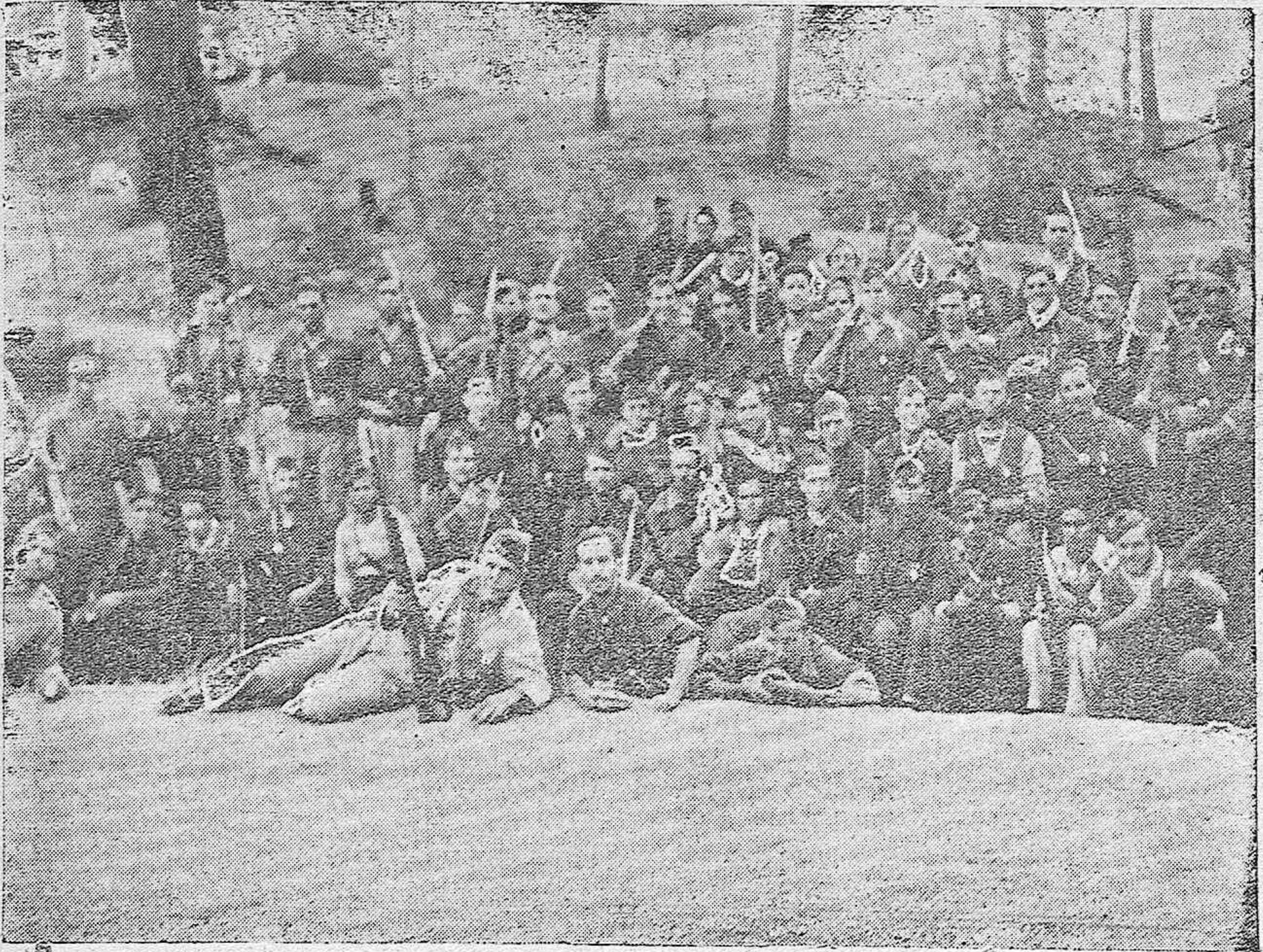
La Falange en el frente.—Nuestros camaradas defienden a España con su heroísmo ejemplar