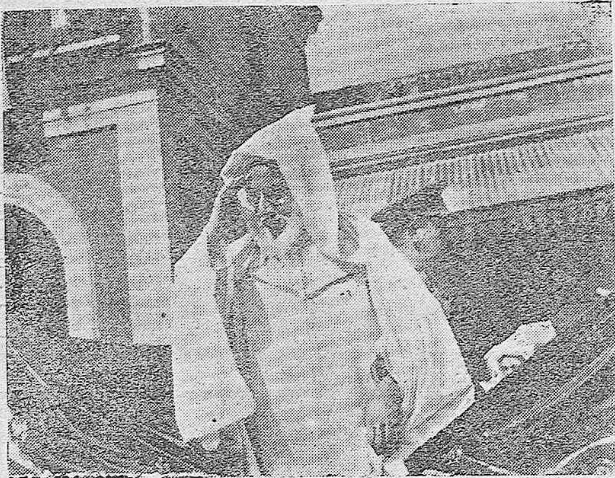
El Gran Visir saluda a su llegada a Córdoba a la multitud que le aclama