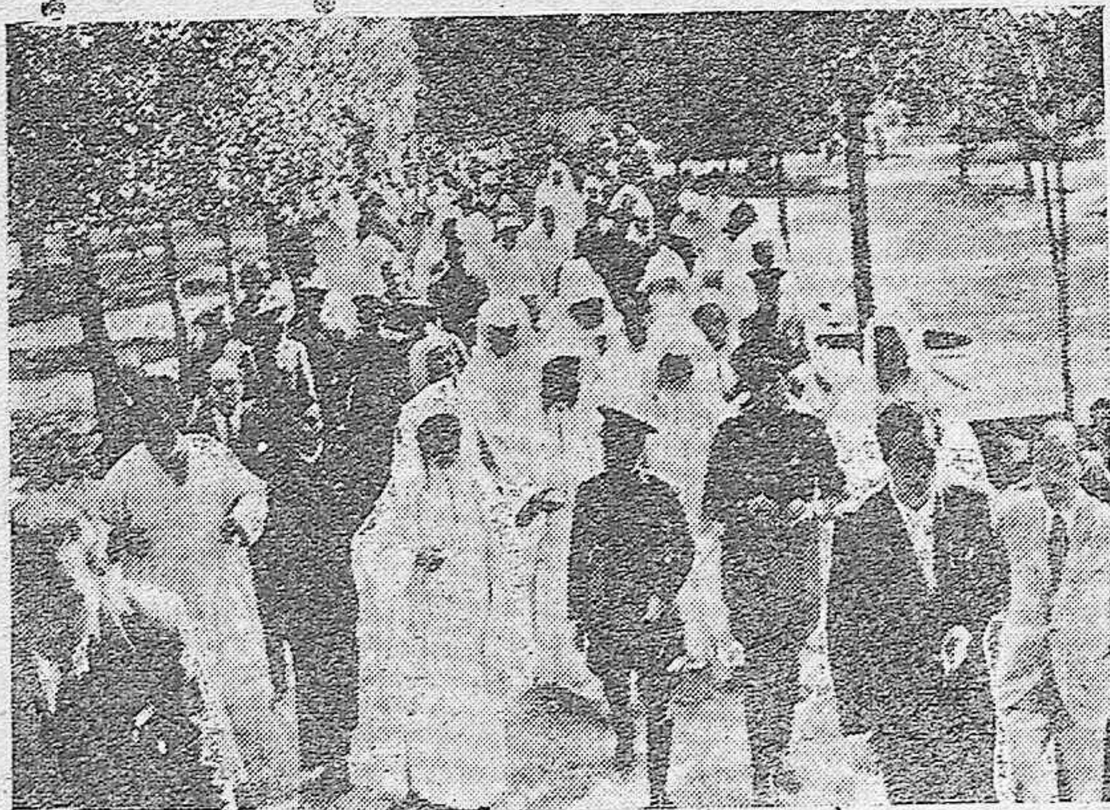
El Gran Visir y su séquito salen de la Mezquita Catedral y atraviesan el patio de los Naranjos