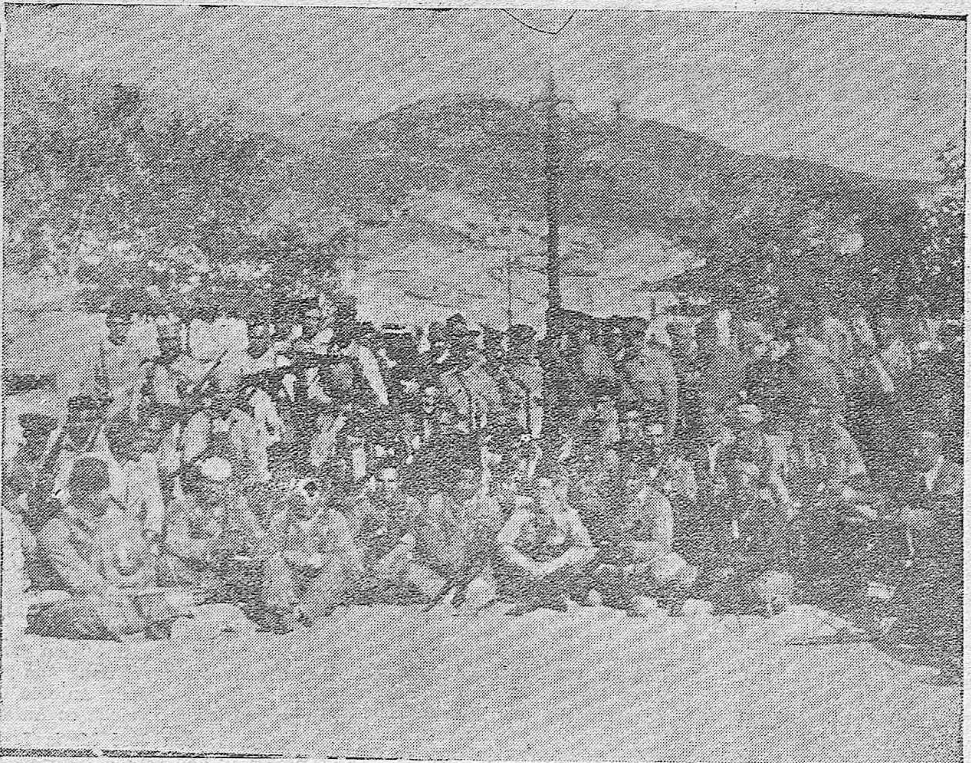
Fuerzas de Regulares, que heroicamente, intervinieron en la toma y defensa de Espiel.