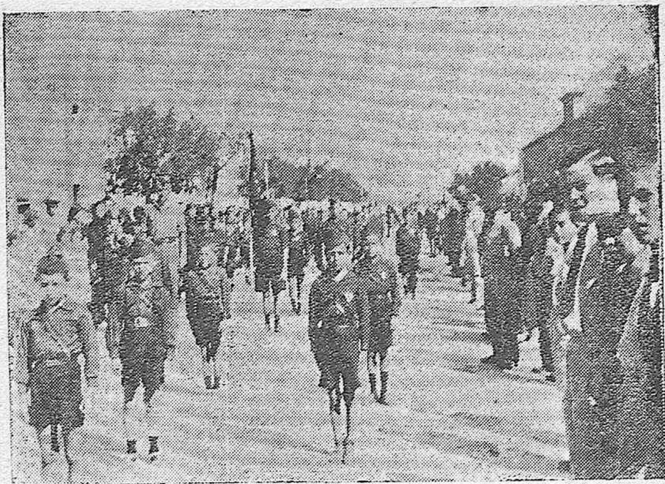
Los flechas de La Carlota desfilando marcialmente.