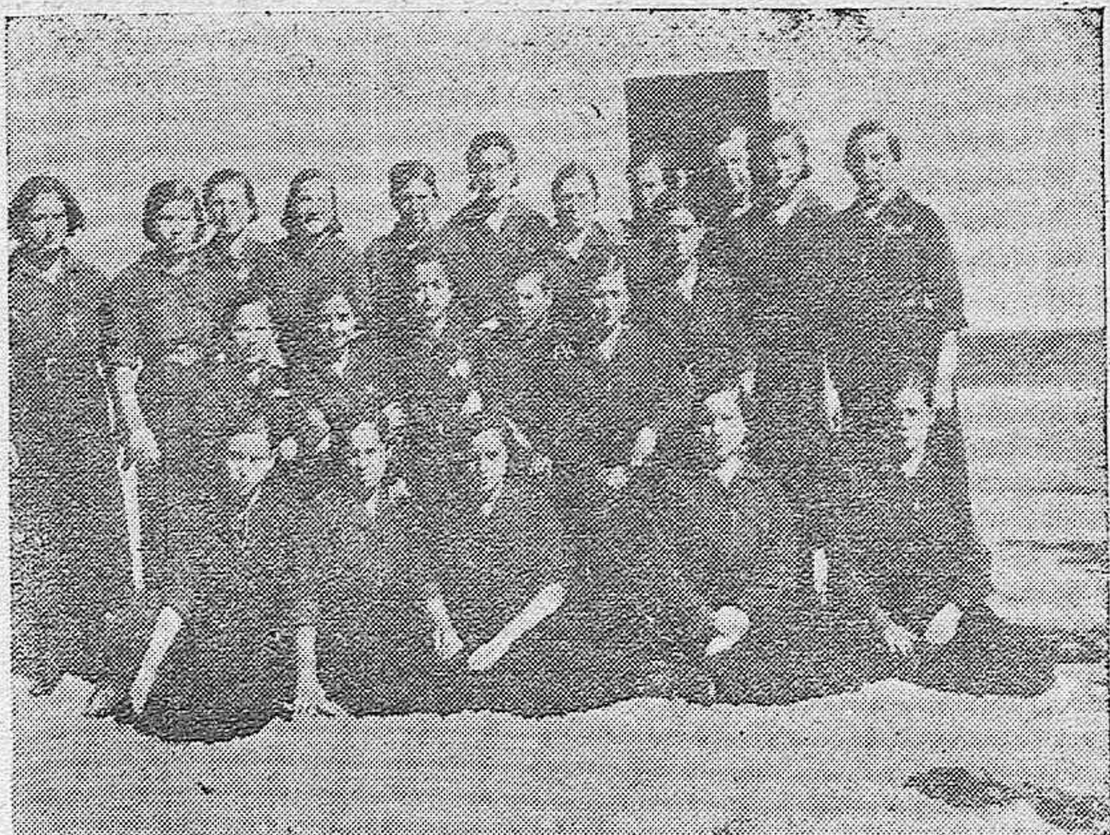
Sección femenina de Falange Española de La Carlota.