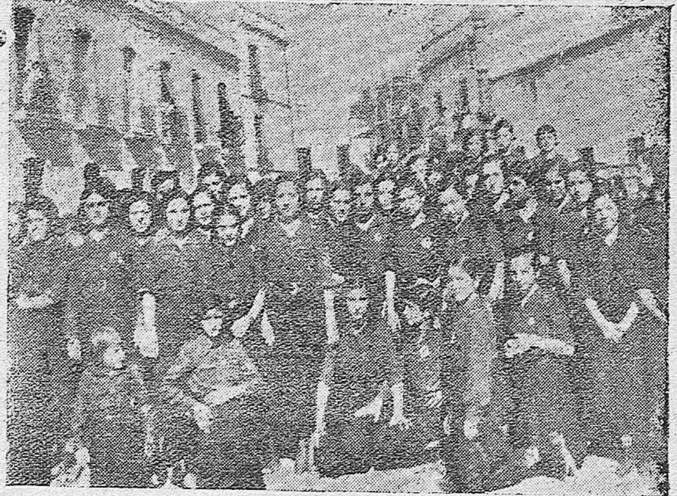
La sección femenina de Falange Española de Posadas.