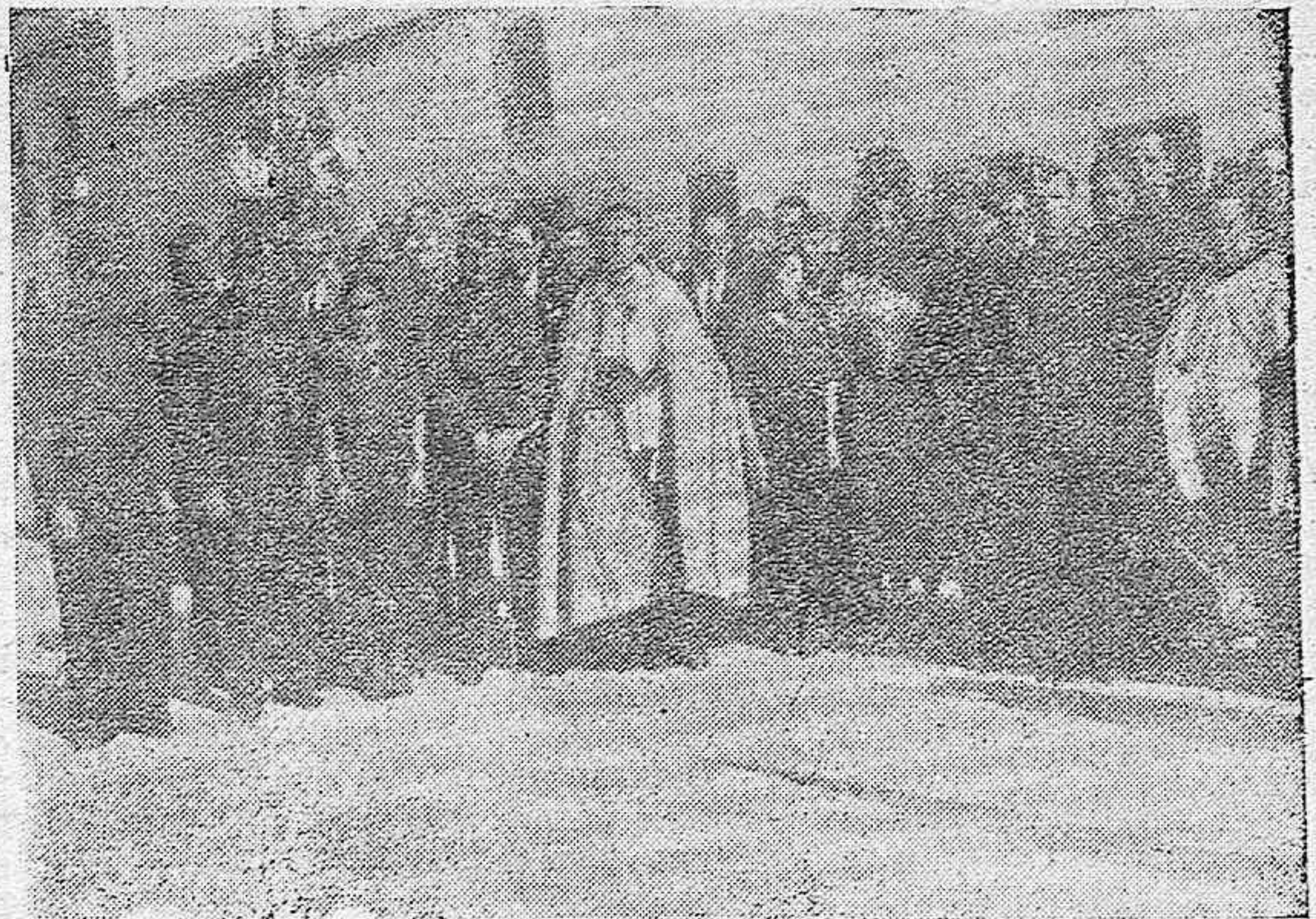
Las autoridades, en el acto de bendecir la bandera de Falange Española en dicha población.