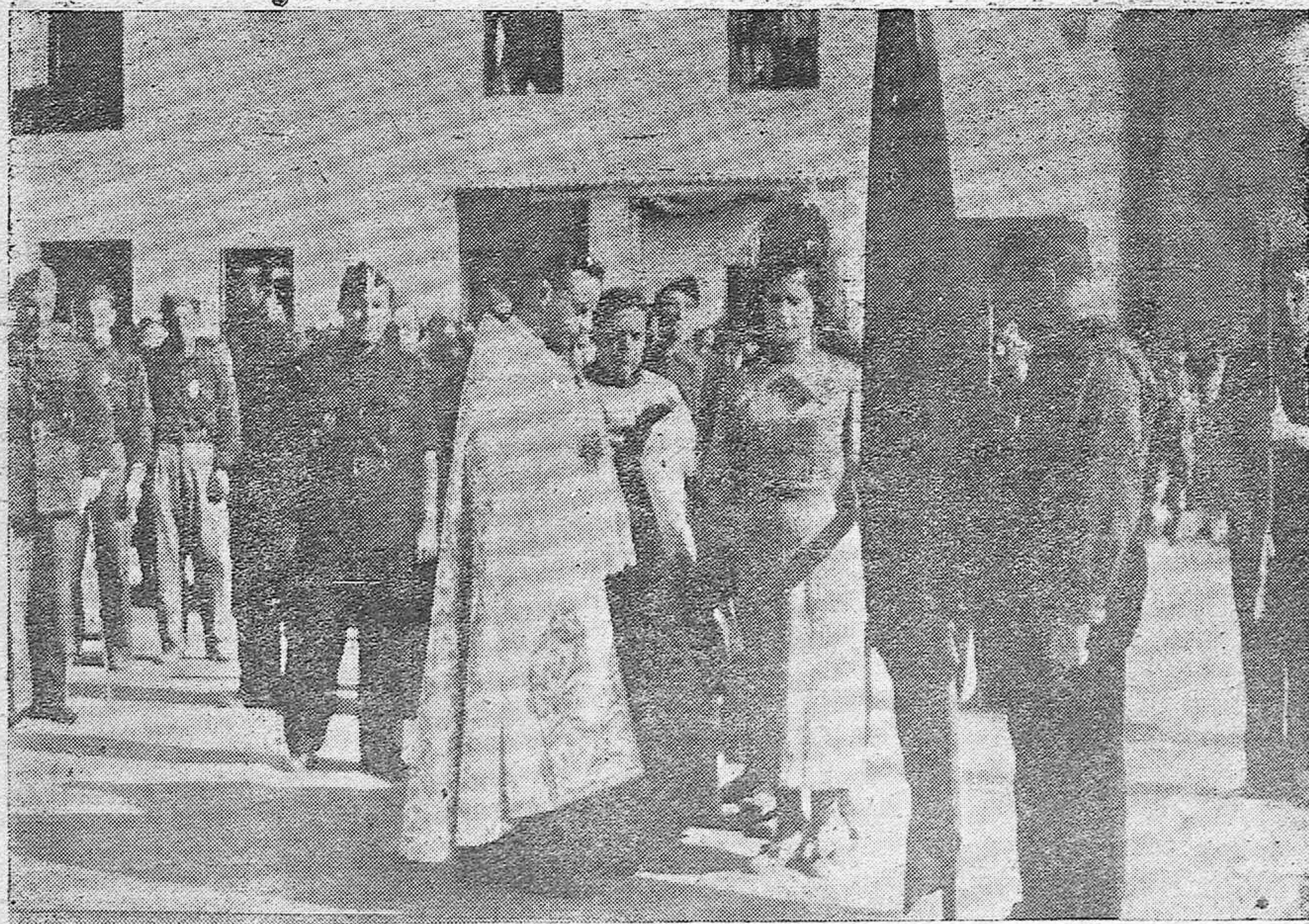
Bendición de la bandera de Falange Española en Posadas.