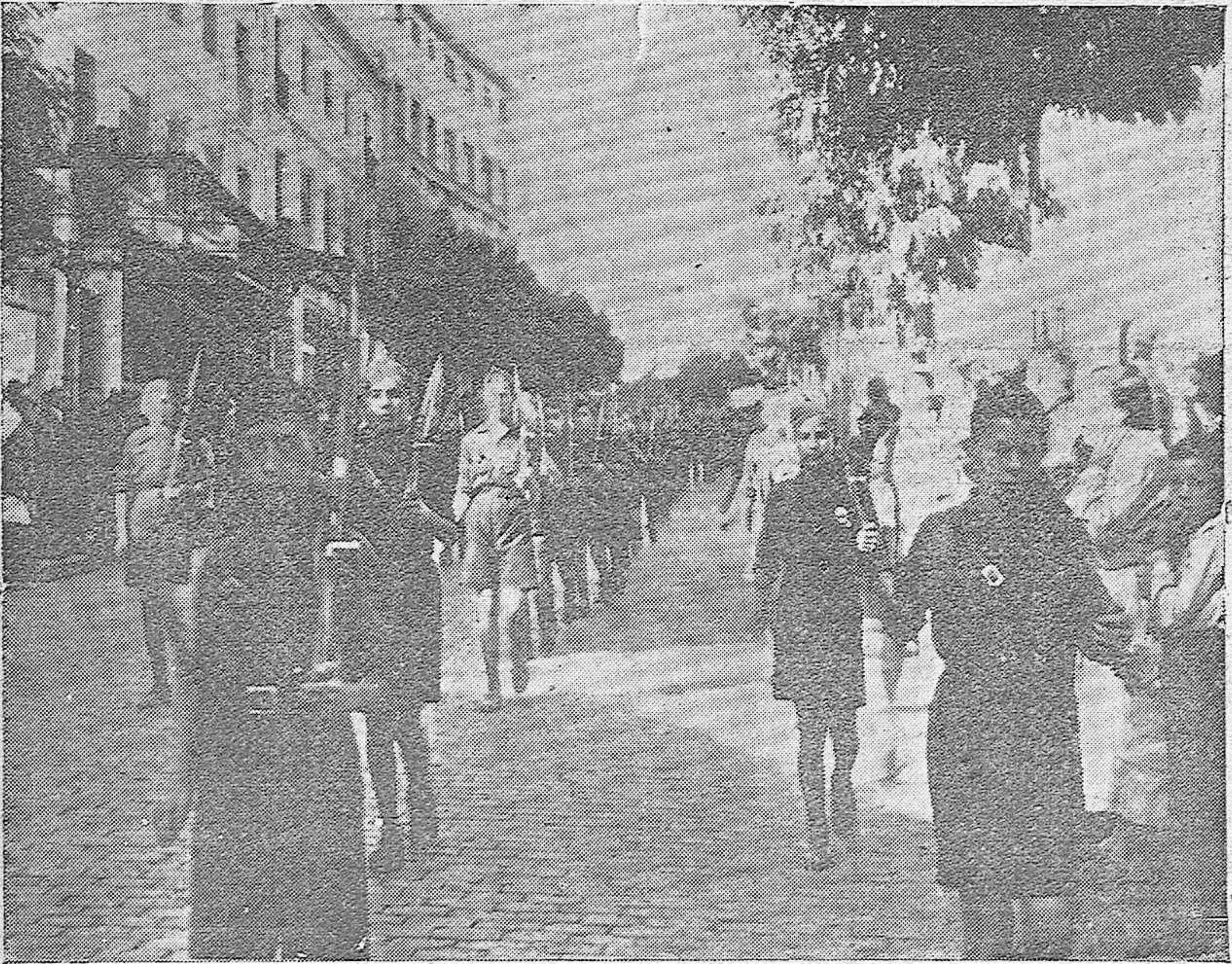
Nuestros Flechas desfilan por las calles de Córdoba.