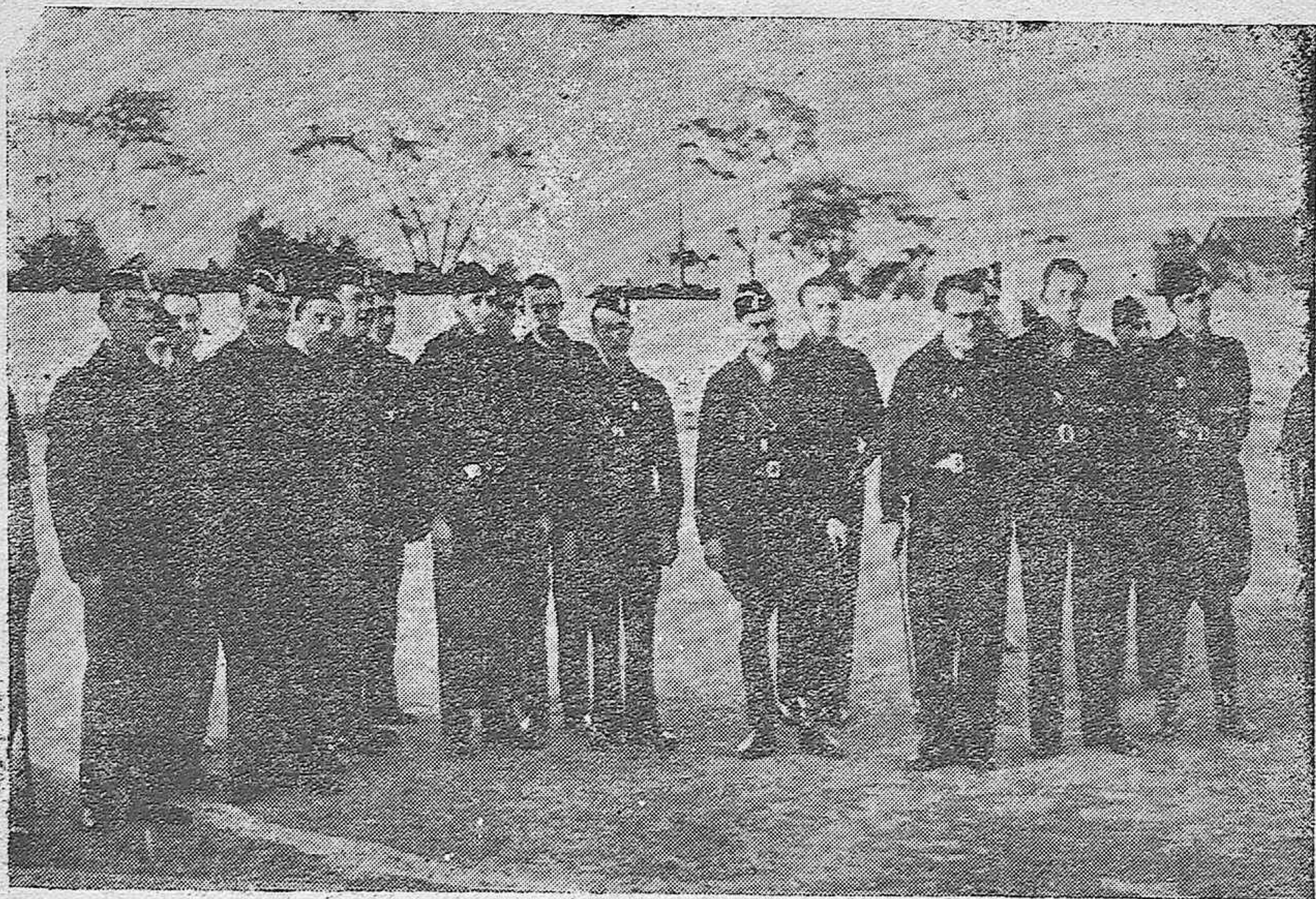
Sancho Dávila rodeado de los jefes de Falange de Córdoba, llega al Stadium América para revistar a los "Flechas".