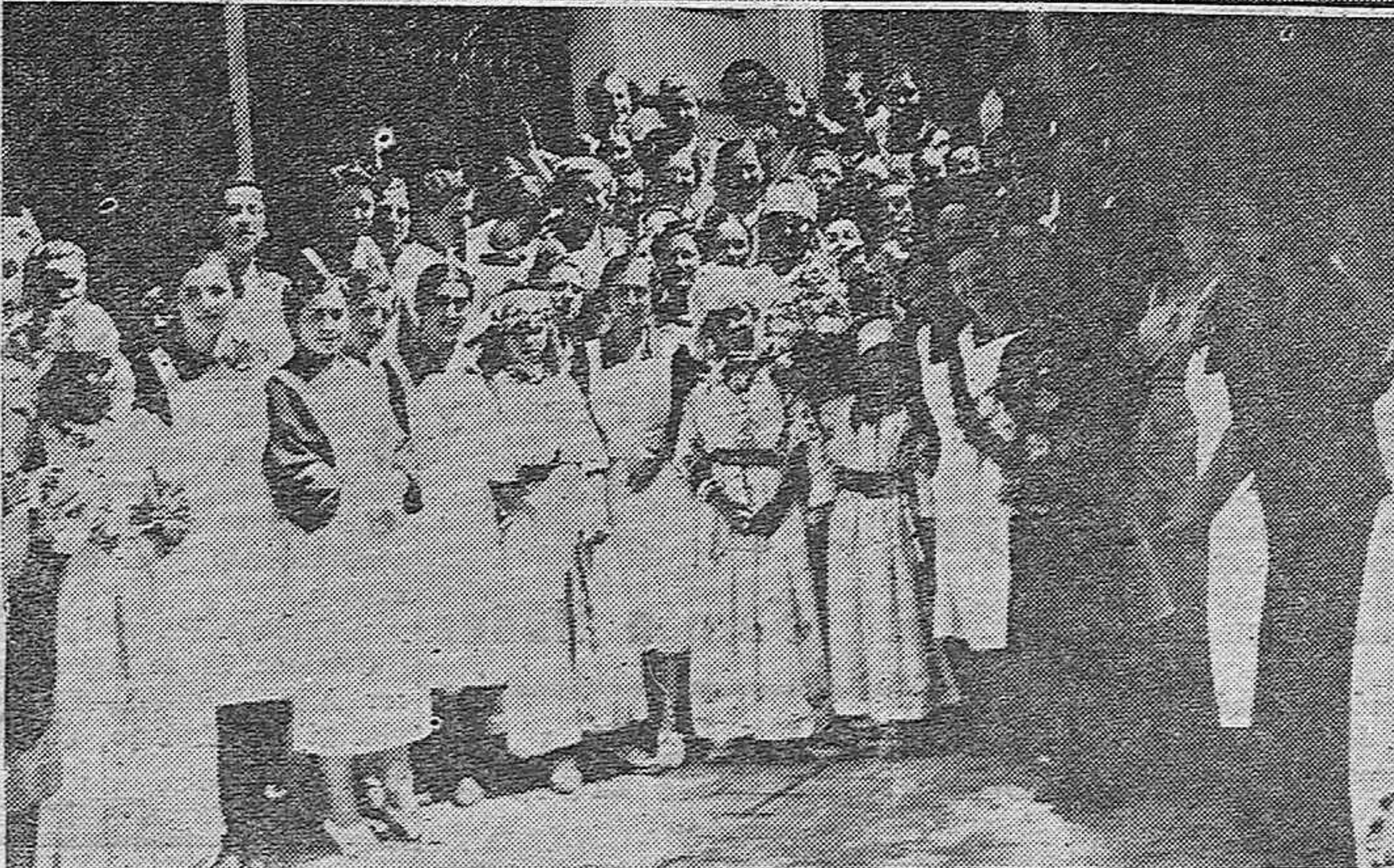
LA VISITA DE LAS NIÑAS MUSULMANAS A CORDOBA.-Las niñas árabes en la puerta de la Mezquita Catedral.-Visita de las niñas al Repero de "Auxilio Social."