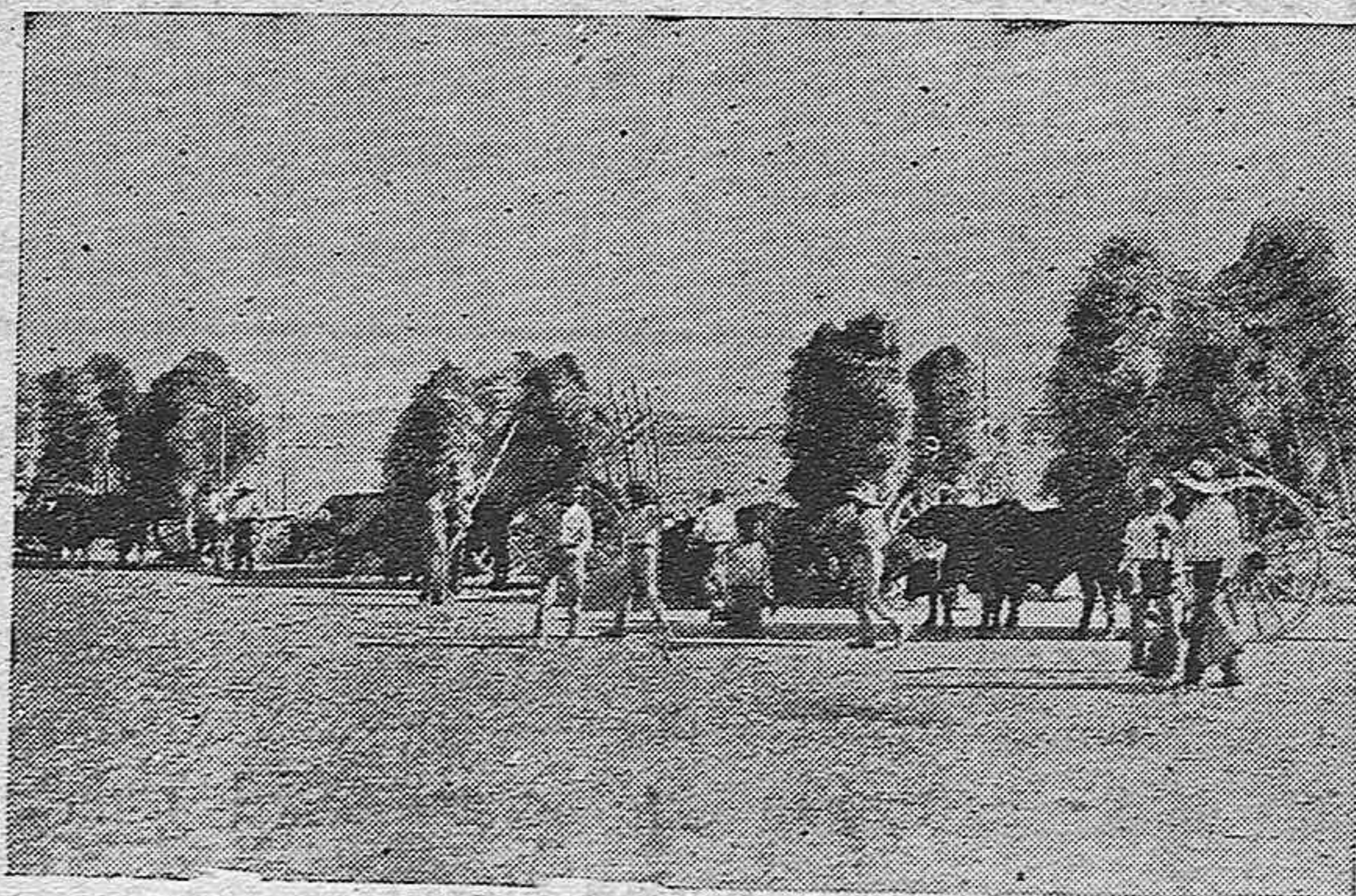
FERNAN-NUÑEZ.—Faenas agrícolas en la campiña