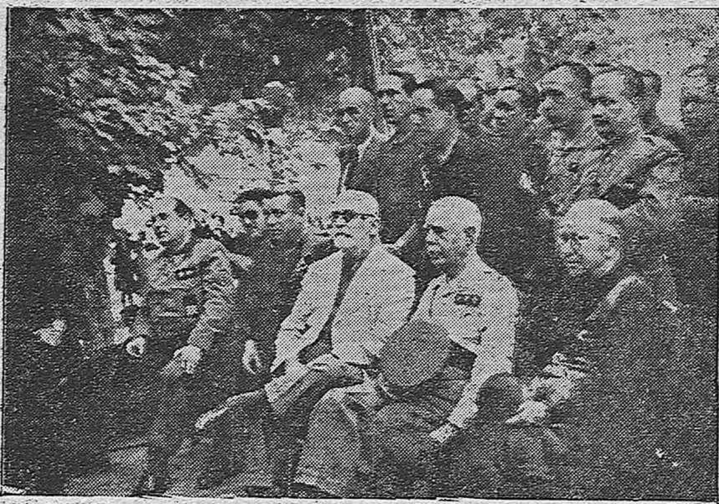
Las autoridades de Córdoba y Cabra y los mandos de Falange presidiendo el acto de afirmación nacional-sindicalista.

Ante la tribuna y por las avenidas del amplio y precioso paseo, al pie