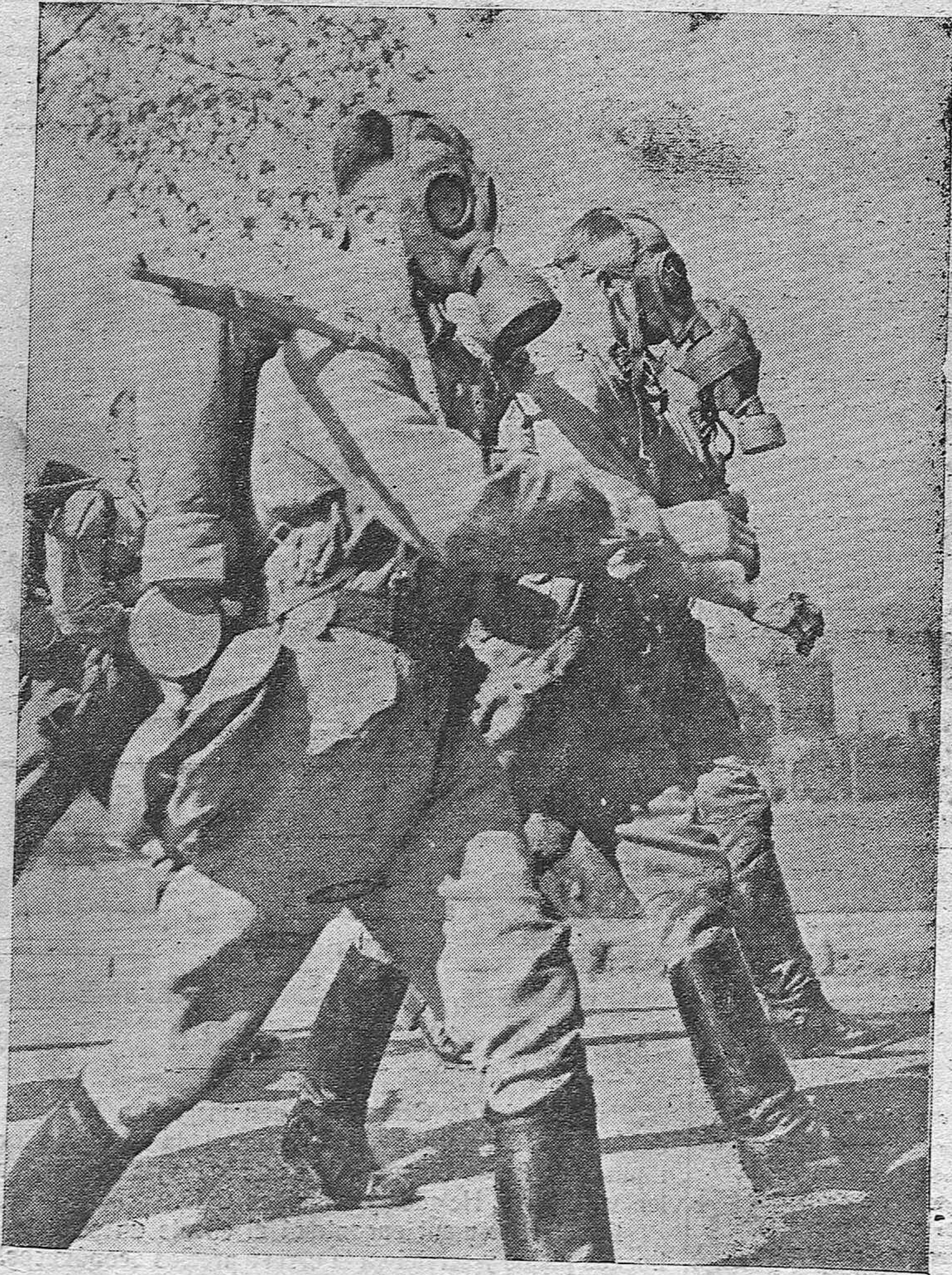
EL CAMPEONATO ALEMÁN DE MARCHA CON CARGA.—Un grupo de hombres con mascarillas de gas, y con equipo completo, en lucha por el campeonato de marcha con carga.

DIARIO DE FALANGE ESPAÑOLA TRADICIONALISTA Y DE LAS J. O. V. S.