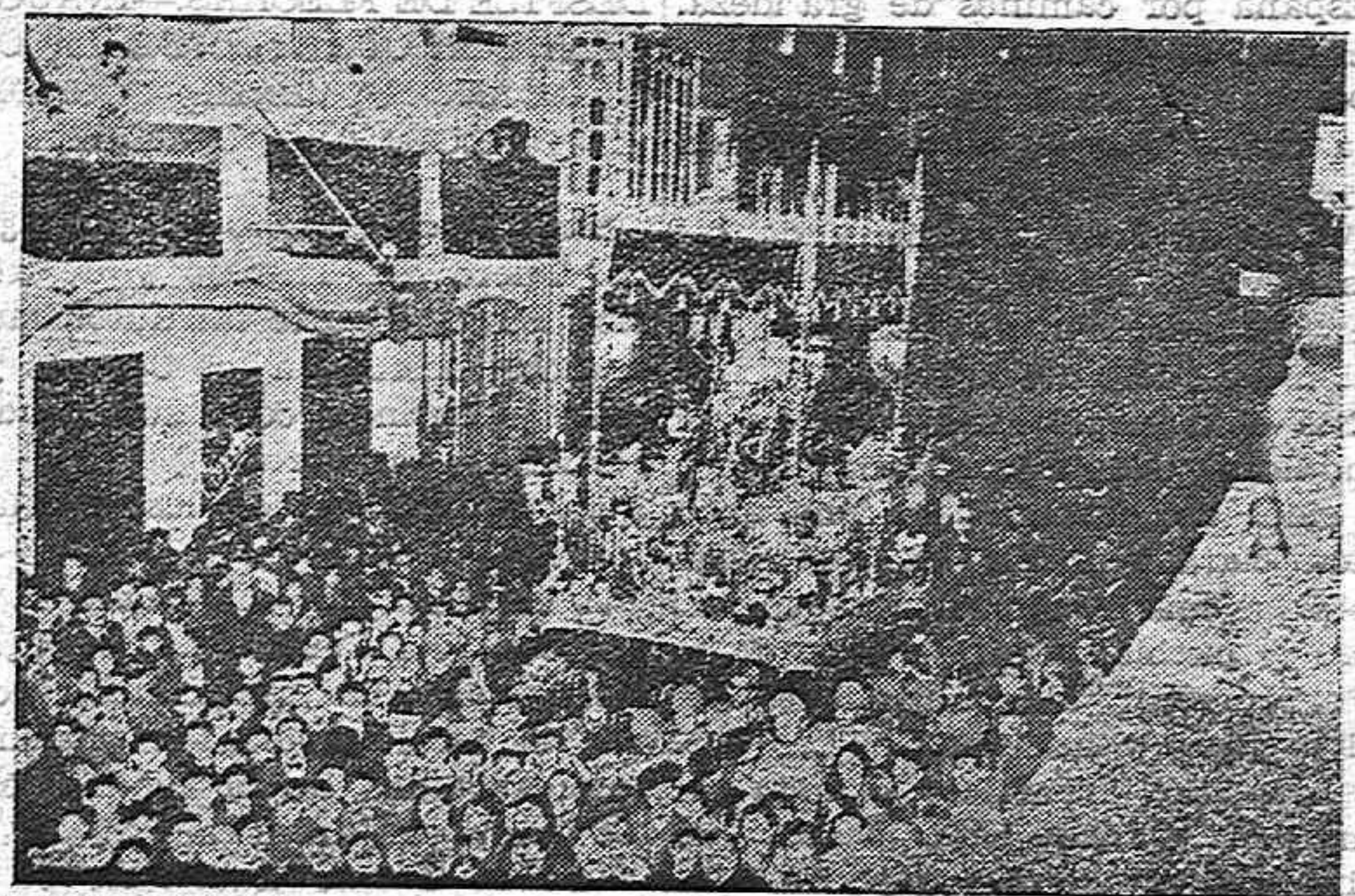
La imagen de la Santísima Virgen de Araceli, Patrona de Lucena, desfilando en procesión, por las calles de la ciudad.

La imagen de la Virgen, en su tro no y bajopalio, dispuesta ya para su carrera triunfal por las calles lu ceninas recibía complacida las ple