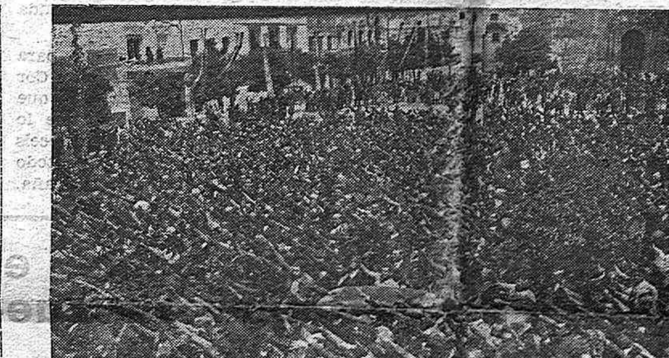
La multitud en la Plaza del Ayuntamiento, escucha brazo en alto el himno de Falange, después de haber oído la palabra de los oradores Nacionalindustrialistas divulgando el "Fuero del Trabajo".

lucenino durante el domingo, cuyas horas estuvieron jaonadas por actos entusiastas, que hicieron inolvidable la jornada.