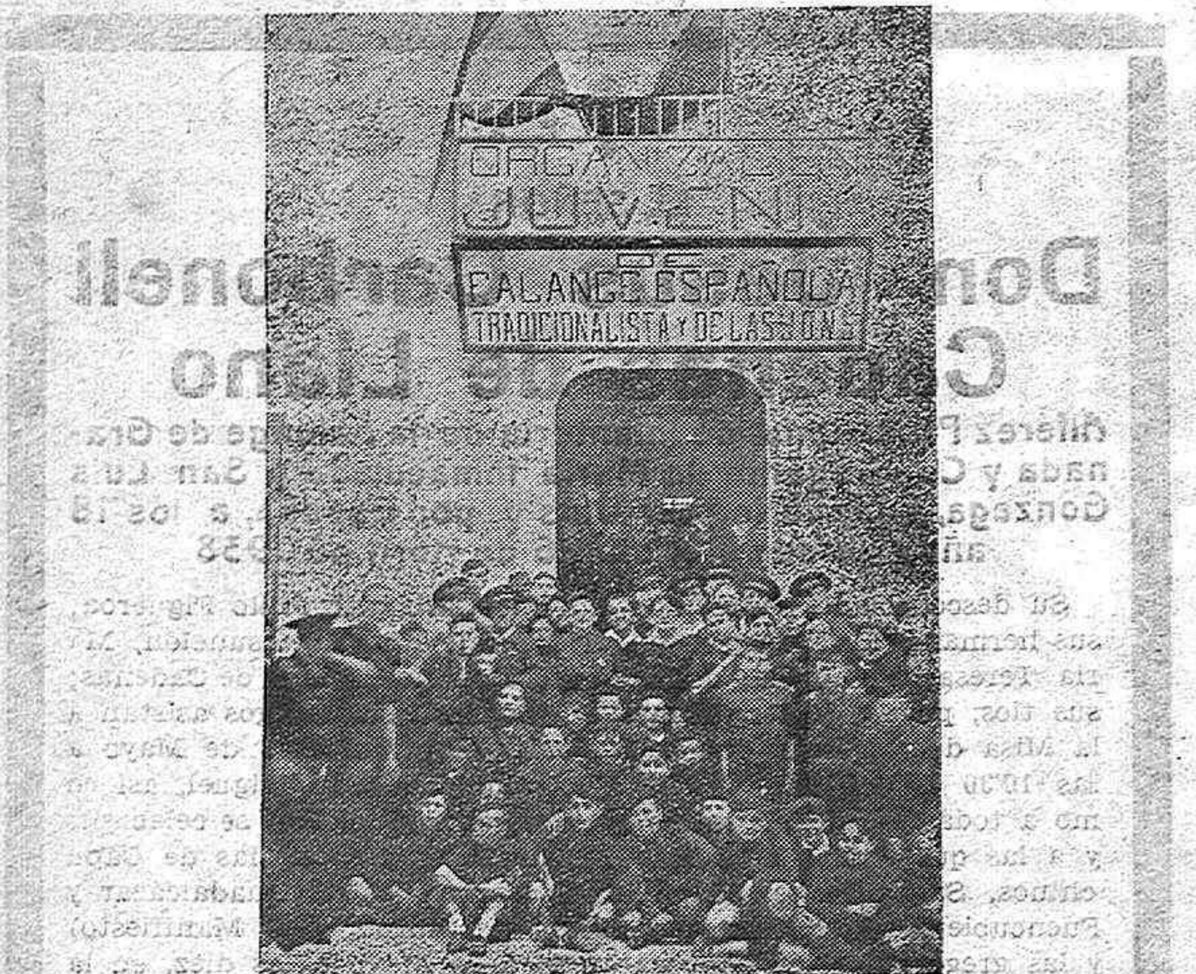
El Cuartel de la Organización Juvenil en Lucena.