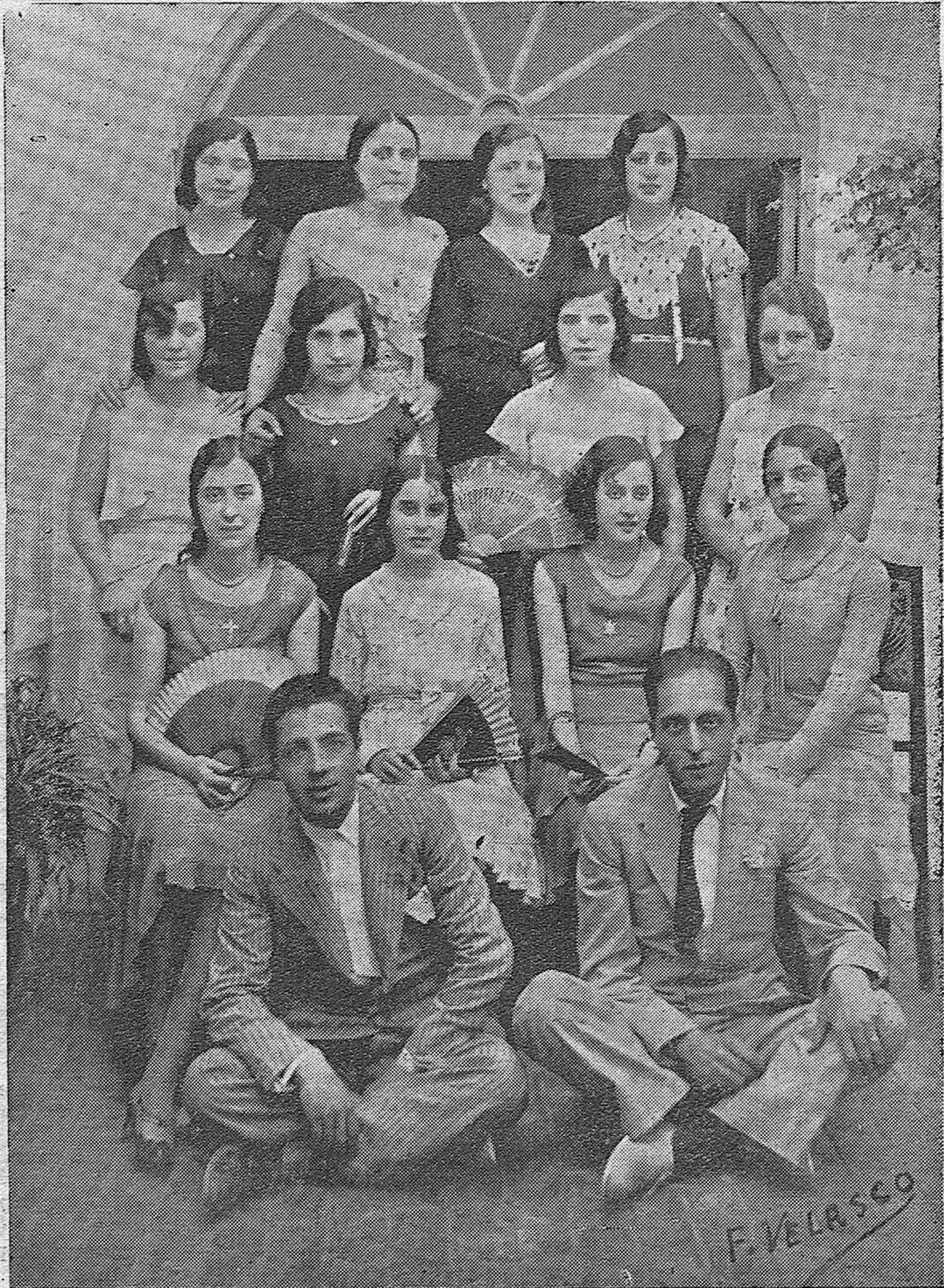
LUCENA EN FIESTAS. —La bella ciudad de Lucena se prepara para celebrar sus tradicionales fiestas. He aquí a un grupo de lindas muchachas lucentinas cuya gentil presencia será el mejor adorno del Ferial. Les acompañan algunos distinguidos jóvenes de la localidad