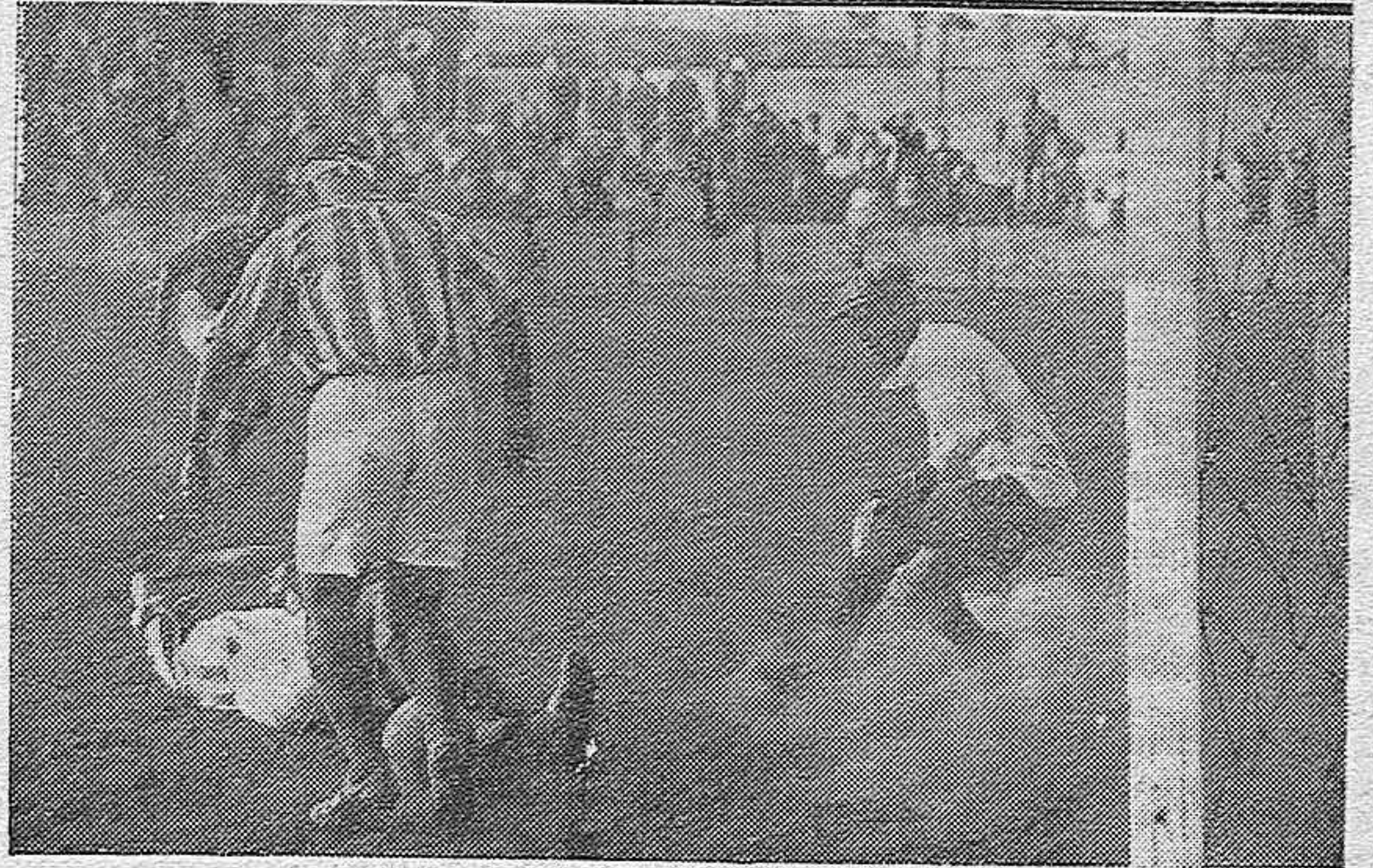
LA INAUGURACION DE LA TEMPORADA FUTBOLISTICA.—El equipo del Racing Club con sus nuevos elementos, muy prometedores para el deporte local. Un momento del estratagemático ataque de los del Betis a la meta del Racing