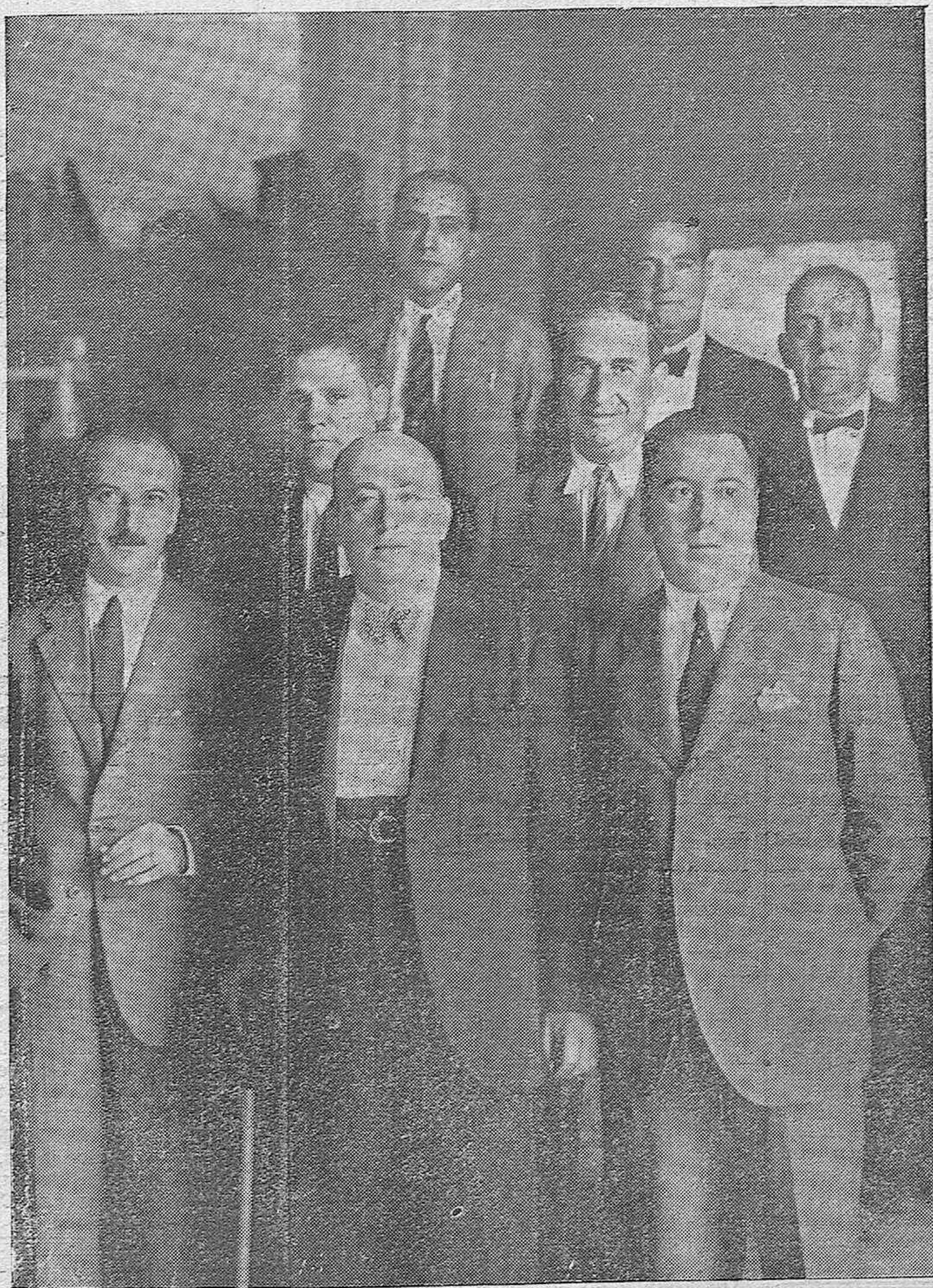
ANTE LA VISITA DEL PRESIDENTE.—El alcalde y concejales que marcharon a Priego para organizar todo lo relacionado con la próxima visita a Córdoba del presidente de la República española