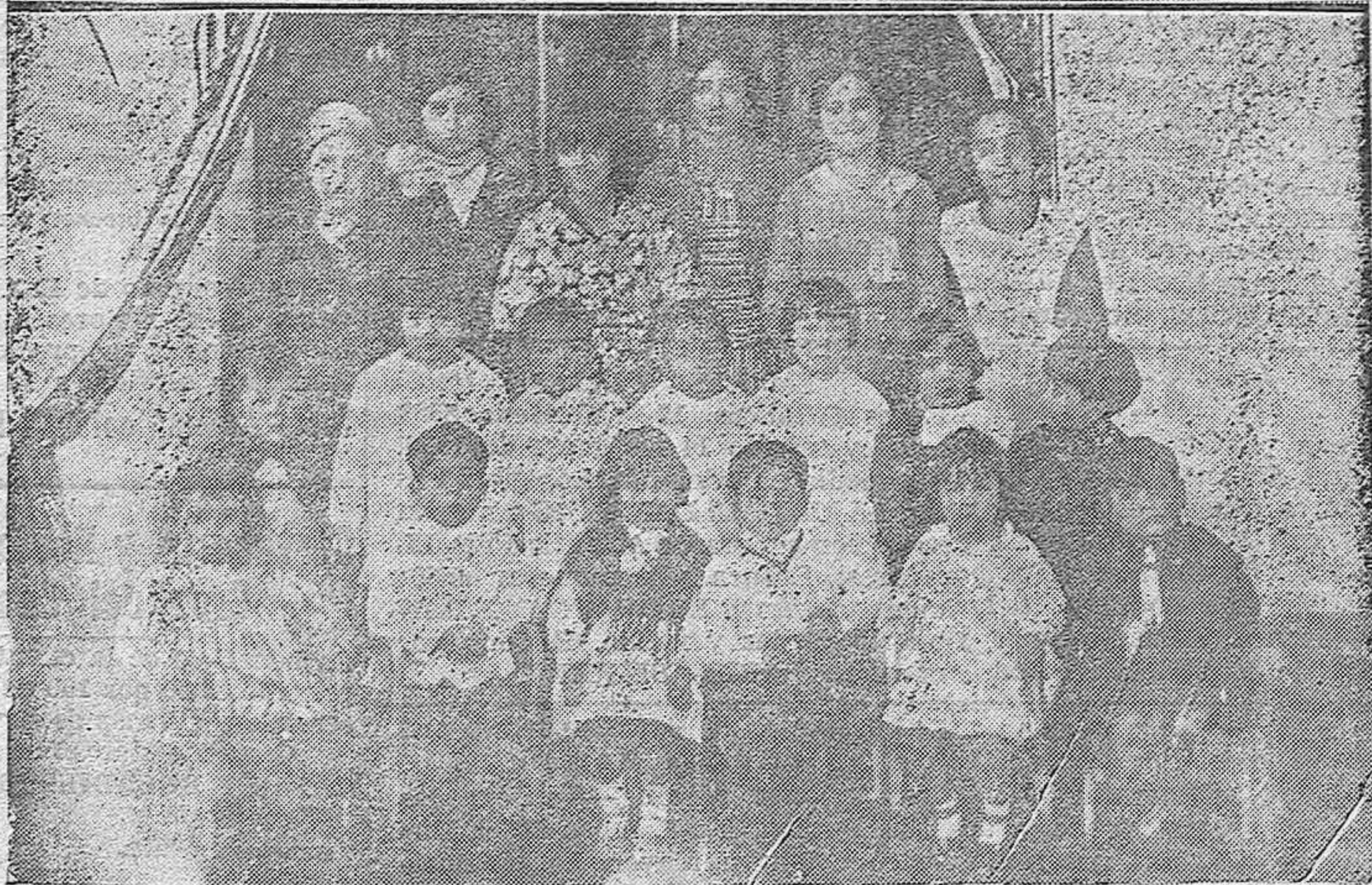
REPARTO DE DIPLOMAS Y JUGUETES EN EL GRUPO ESCOLAR COLON. —El alcalde de la ciudad entregando los diplomas de premio, a las niñas del Grupo que los han merecido por su comportamiento.—Pequeños intérpretes de la fiesta escolar, con que terminó el simpático acto habido ayer en el Grupo Escolar Colón